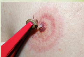
Rys. 2. Usuwanie kleszcza

Główne zagrożenie, jakie stanowią dla ludzi kleszcze to przenoszone przez nie choroby. Drobnoustroje chorobotwórcze przedostają się do kleszczy wraz z krwią zakażonych żywicieli. Do zakażenia dochodzi w czasie ukłucia – rys. 2, gdy następuje bezpośrednie wprowadzenie zarazków do krwi. W Polsce najczęściej przenoszone przez nich choroby to: borelioza i kleszczowe zapalenie mózgu (kzm).