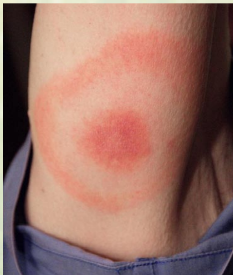
Rys. 3. Rumień wędrujący

W miejscu ukłucia przez kleszcza pojawia się tzw. rumień wędrujący – rys. 3 – zmiana o kształcie owalnym, która w miarę upływu czasu powiększa się. W typowych przypadkach zmiana przybiera kształt obrączkowaty, jednak czasami może mieć inną postać lub w ogóle