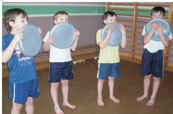
Zajęcia gimnastyki korekcyjnej w PSP w Świeciechowie

Wzrosła również wiedza uczestników projektu: z zajęć dla uczniów z trudnościami matematyczno -przyrodniczymi u 84% uczestników, z zajęć dla uczniów zdolnych w zakresie matematyczno - przyrodniczym u 53% oraz z zajęć dla uczniów zdolnych polonistycznie u 100% uczestników. Wymiernym efektem projektu są zakupione dla szkół pomoce dydaktyczne i wyposażenie na kwotę 135 122,00 zł. Wartość całego projektu wyniosła 206 136,20 zł.