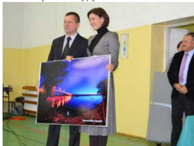
Wręczenie pamiątkowej fotografii

Burmistrz Annapola, na pamiątkę pobytu Pani Minister na terenie naszego miasta wręczył zdjęcie z widokiem przedstawiającym most na Wiśle.