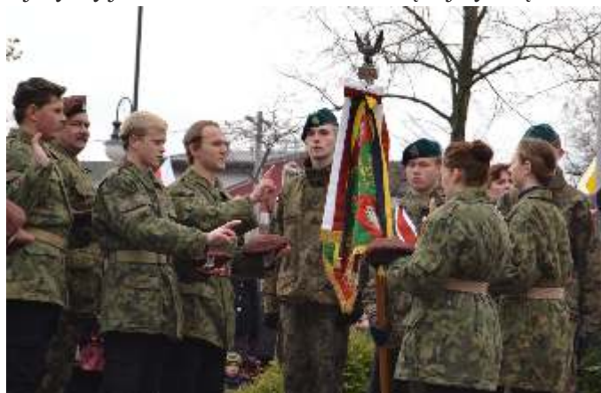
Złożenie uroczystego Przyrzeczenia Strzeleckiego

W swoim wystąpieniu powiedział m.in. „Dzisiejsze święto to doskonała okazja do tego, aby wpajać idee patriotyczne naszej młodzieży, często zagubionej w rozpoznawaniu prawdziwych wartości. Msza święta w intencji Ojczyzny, Rynek przybrany w biało-czerwone barwy narodowe, wspólne śpiewanie hymnu państwowego, przekazywanie historii burzliwych losów odzyskania niepodległości to najlepsza lekcja historii, w której przekazujemy naszym dzieciom, że dobro Ojczyzny jest dla nas Polaków wartością najwyższą”.