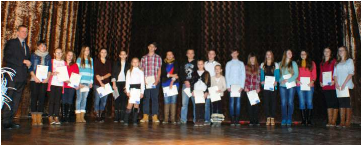
Stypendyści nagrodzeni za wybitne osiągnięcia artystyczne w dziedzinie kultury i nauki

Stypendium Burmistrza za wybitne osiągnięcia sportowe mógł otrzymać uczeń, który w semestrze poprzedzającym przyznanie stypendium uzyskał co najmniej dobrą ocenę z zachowania oraz osiągnął wysokie wyniki sportowe, tj.: zajął I-X miejsce w zawodach ogólnopolskich, lub zajął I-VI miejsce w zawodach wojewódzkich, lub zajął I-III miejsce w zawodach rejonowych.