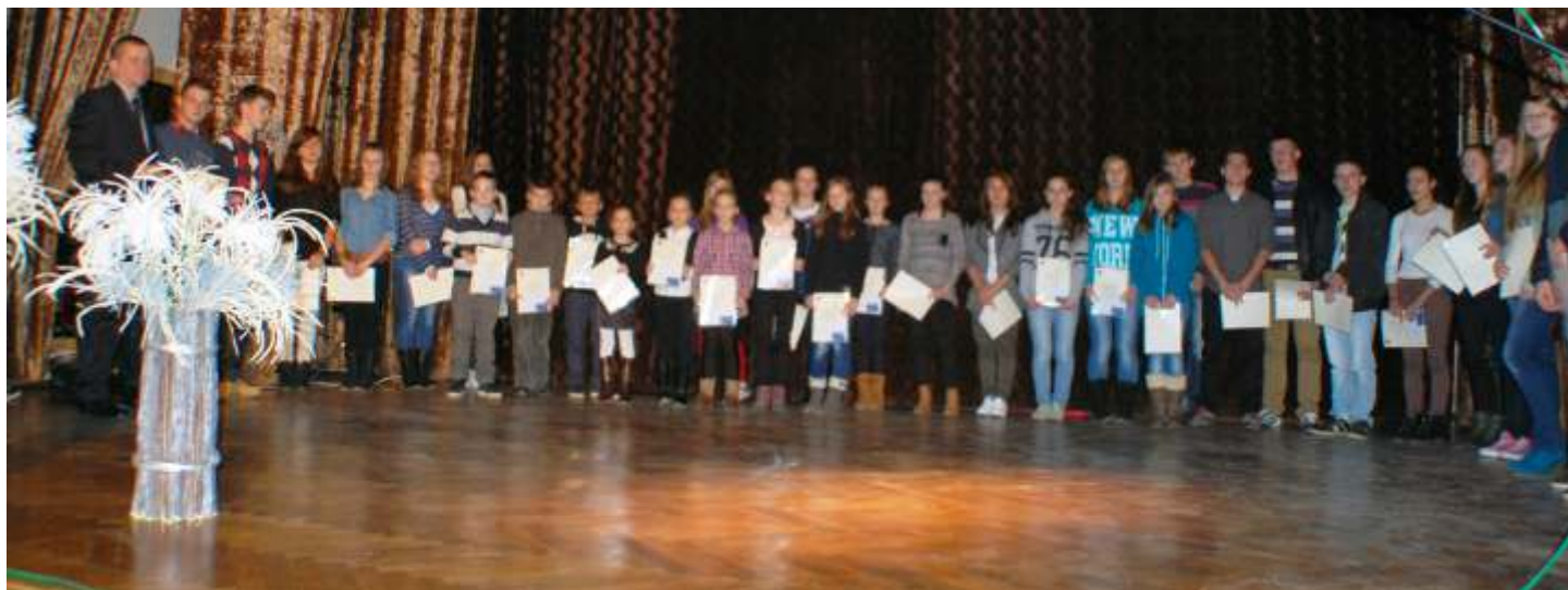
Uczniowie wyróżnieni za wybitne osiągnięcia w sporcie