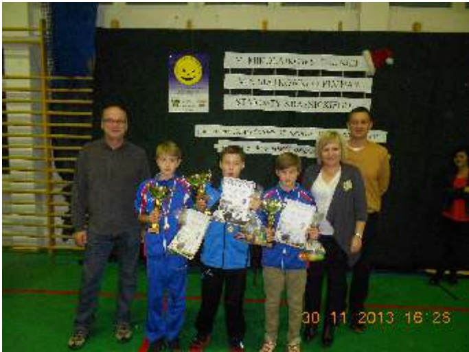
Zwycięcy V Mikołajkowego Turnieju Minisiatkówki