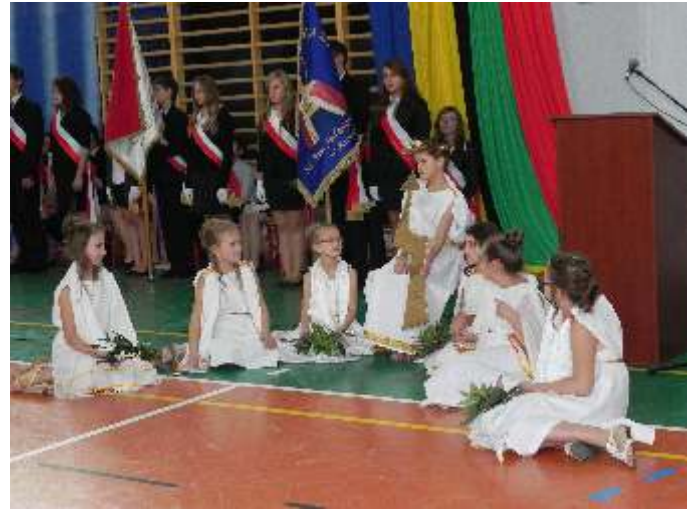
Pierwsze Igrzyska Szkolne-predstawienie przygotowane przez nauczycieli i uczniów MZSz