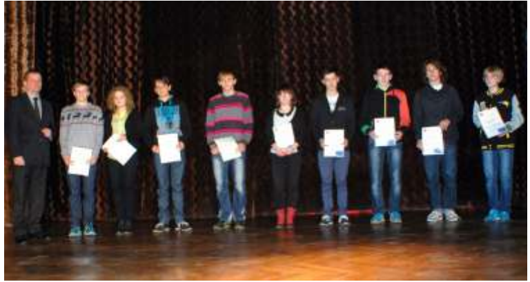
Uczniowie wyróżnieni za wybitne osiągnięcia w nauce