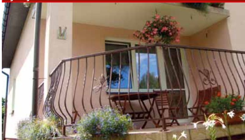
Ogród Agnieszki i Wiesława Drozd