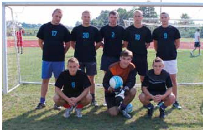
I miejsce – Borzechów