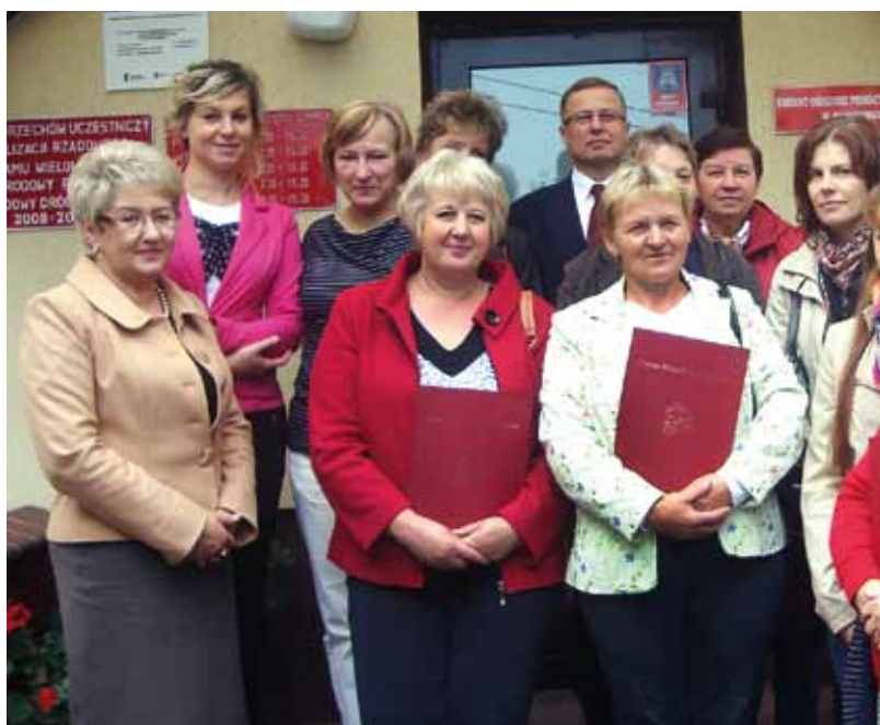
Pamiątkowe zdjęcie z podsumowania konkursu