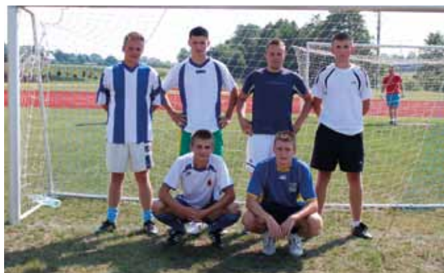
II miejsce – Piorun Kłodnica