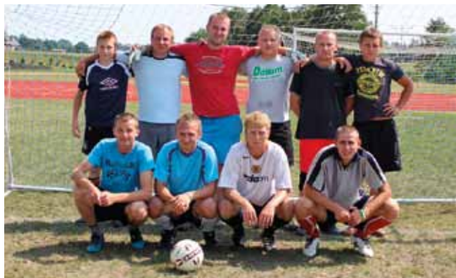
III miejsce – Absolwenci

Borzechowa. Najlepsi zawodnicy turnieju otrzymali puchary, dyplomy oraz statuetki i nagrody rzeczowe.