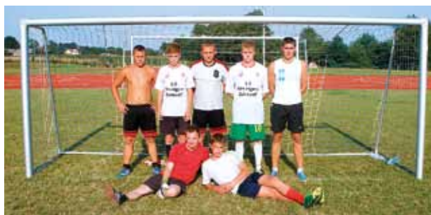
I miejsce – Absolwenci