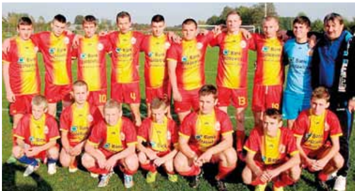
Drużyna Juniorów Perły Borzechów

Po wielkim sukcesie, jakim był awans drużyny seniorów PERŁY Borzechów do klasy okręgowej, wszyscy zastanawiali się, jak spisie się ona na wyższym poziomie.