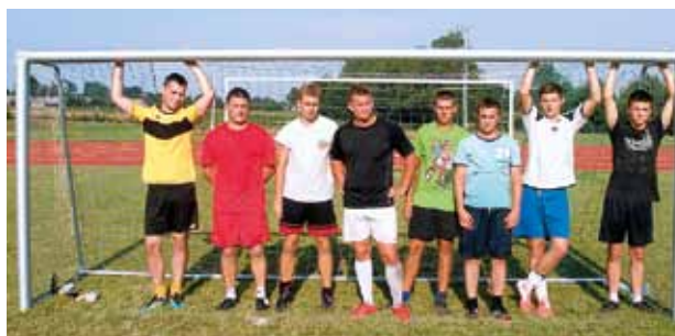
III miejsce – Kolonia Borzechów