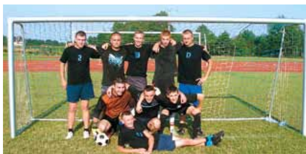
II miejsce – Borzechów