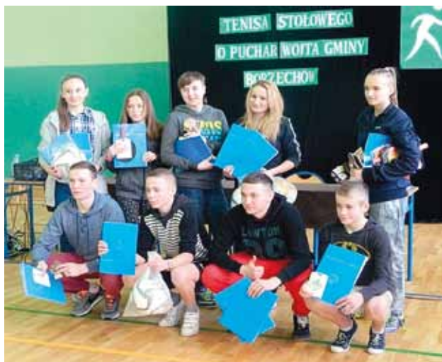
Zwycięzcy w Gimnazjum