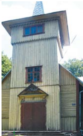
Kościół w Kłodnicy Dolnej