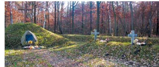
Cmentarz wojenny w PawłóWKu

Na skraju lasu, przy drodze prowadzącej w kierunku Niedrzwicy znajduje się mały cmentarz z okresu pierwszej wojny światowej. Na tablicy informacyjnej widnieje napis: „Tu spoczywają prochy żołnierzy służby ochotników legionu Marszałka Józefa Piłsudskiego walczących o Polskę Niepodległą poległych w bitwie frontowej na polach wsi Borzechów i Majdanu Borzechowskiego w dniach 10–22 lipca 1915 roku. Niech pamięć o nich nie zaginie.” W grobach spoczywają prochy ok. 150 żołnierzy, część z nich jest znana z nazwiska.