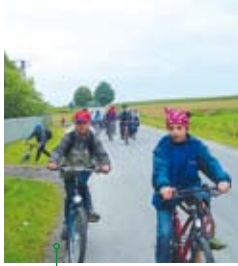
Raid po gminie Borzechów