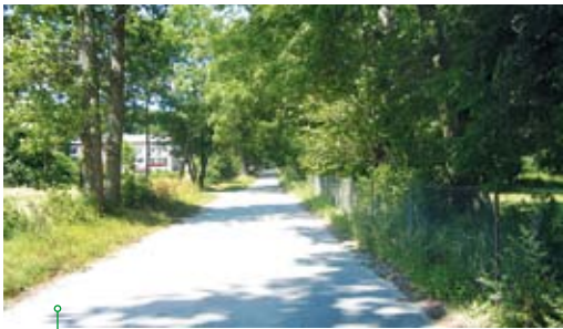
Aleja dworska w Kłodnicy Dolnej