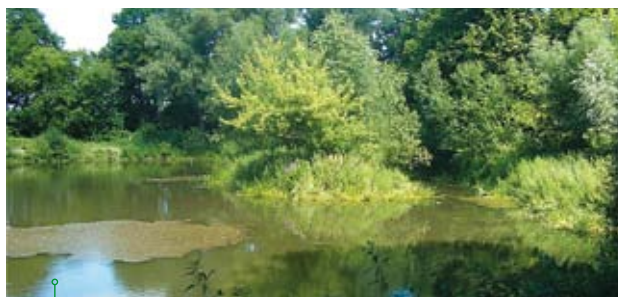
Staw dworski w Łopienniku