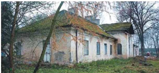
Dwór w Kłodnicy Dolnej