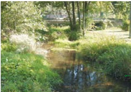
Chodelka w okolicy Borzechowa