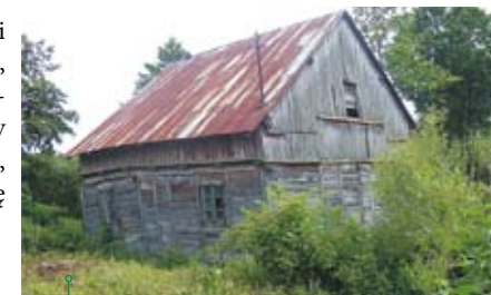
Młyn w Majdanie Skrzynieckim

Młyn pochodzi z II połowy XIX w., obecnie nie funkcjonuje. Położony jest nad Chodelką, obok znajdują się stawy rybne.