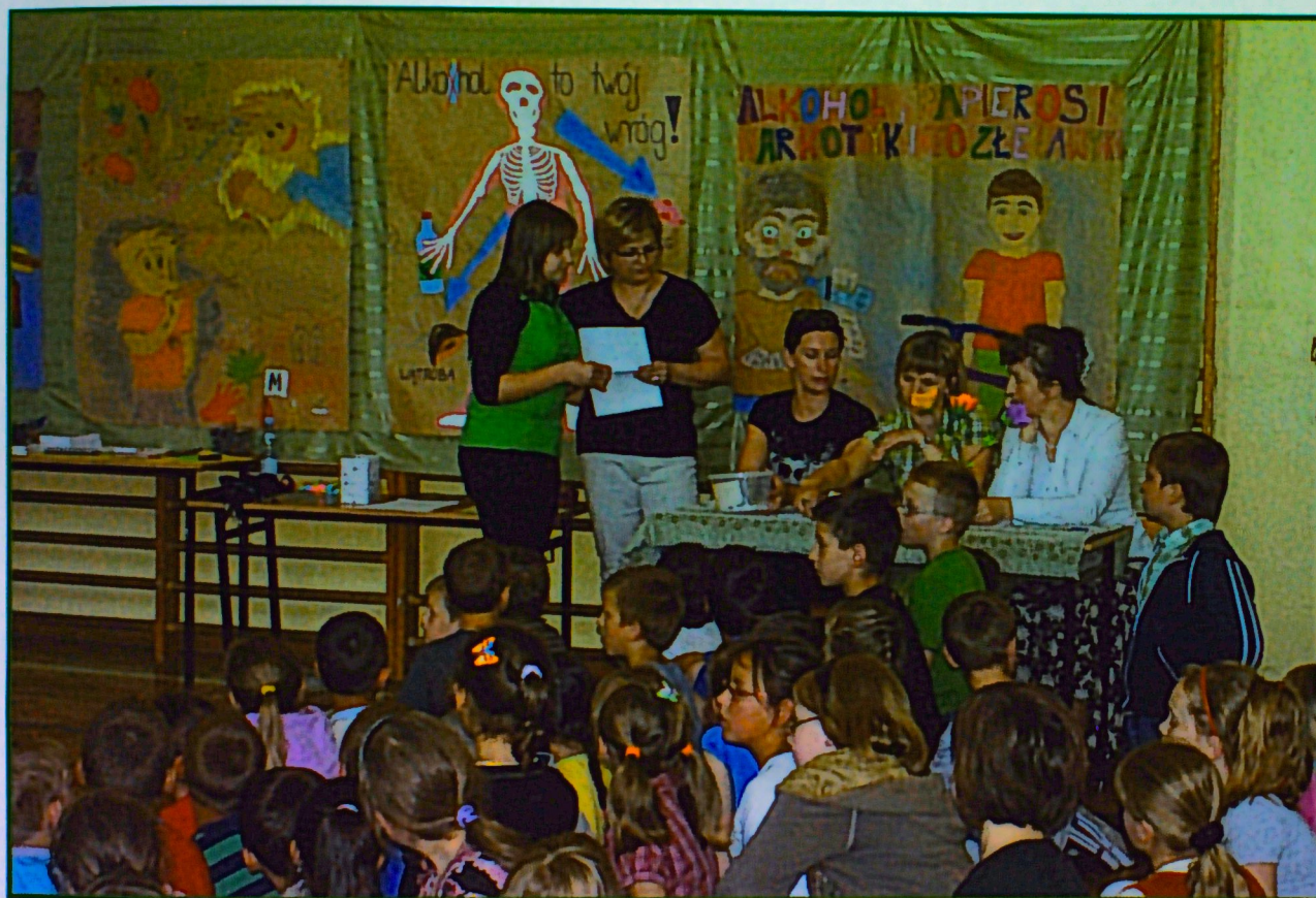
Konkurs antyalkoholowy - Gimnazjum Publiczne w Piotrkowie „Zachowaj Trzeźwy umysł”

Prowadzenie profilaktycznej działalności informacyjnej i edukacyjnej dla dzieci i młodzieży w zakresie rozwiązywania problemów alkoholowych i przeciwdziałania narkomanii. Organizowane są i prowadzone na terenie szkół i świetlic zajęcia promujące zdrowy styl życia dla dzieci i młodzieży min. Gimnazjum Publiczne w Piotrkowie zorganizowało imprezę antyalkoholową.