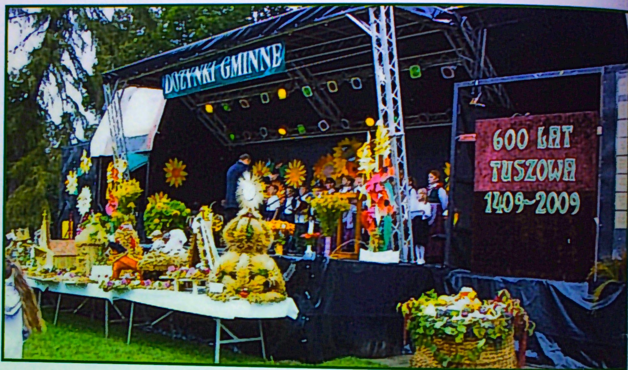
600 lat Tuszowa

Według informacji uzyskanych od członkiń zespołu śpiewaczego z Tuszowa, nazwa miejscowości wywodzi się od staropolskiego słowa tuszyć, co znaczy: dodawać otuchy, obiecywać, wróżyć coś dobrego, mieć nadzieję. Święto 600-lecia Tuszowa, obchodzone było w czasie Dożynek Gminnych, które odbyły się 23 sierpnia 2009 roku.