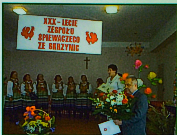
Urodziny Śpiewaczek ze Skrzynic