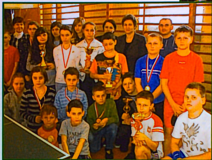
Turniej tenisa stołowego w okresie ferii zimowych w Szkole Podstawowej Jabłonna