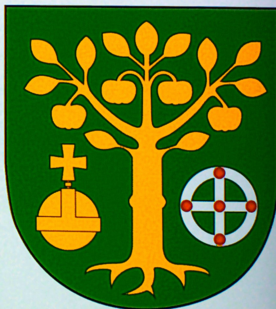
Herb Gminy Jabłonna

W 1388 r. Władysław Jagiełło nadał miejscowości Piotrków prawa magdeburskie, stąd też nawiązanie do insygniów królewskich w formie jabłka. Symbolika tych dwóch elementów: krzyża brygidkowskiego i jabłka królewskiego, upamiętnia nie tylko historyczną przynależność niektórych miejscowości gminy do dóbr klasztornych i królewskich, lecz przede wszystkim królewski majestat Władysława Jagiełły, którego postać niegdyś miała silny wpływ na kształt dzisiejszej gminy.