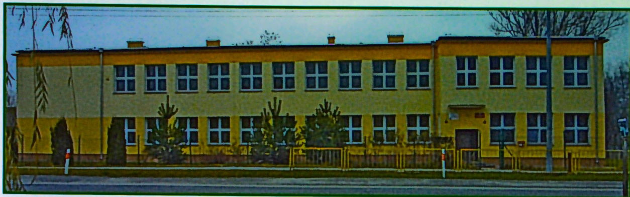
Szkoła Podstawowa w Czerniejowie

Od 2004 r. została rozpoczęta budowa oświetlenia ulicznego przy drodze wojewódzkiej 835 na odcinku Czerniejów - Jabłonna.