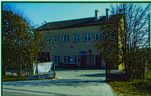
Plac przed remizą w Tuszowie