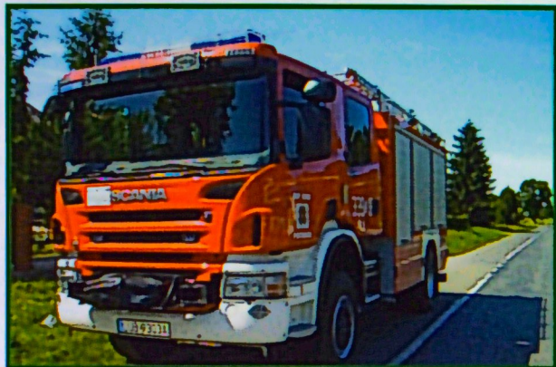
Samochód OSP Piotrków

Do programu PROW 2007-2013 został złożony wniosek na kompleksowy remont strażnicy OSP w Chmielu z przeznaczeniem na działalność społeczno-kulturalną.