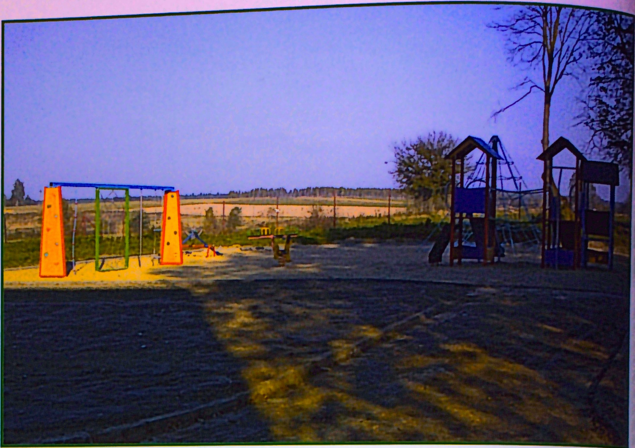
Plac zabaw - Skrzynice

Podjęte zostały działania, by urządzić przy każdej szkole plac zabaw - przy Szkole Podstawowej w Piotrkowie i Skrzynicach. W 2011 r. zostaną urządzone place zabaw przy szkole w Tuszowie oraz przy szkole w Jabłonie i Czerniejowie. Na ich realizację gmina otrzymała dofinansowanie w ramach PROW na lata 2007-2013 oś LEADER.