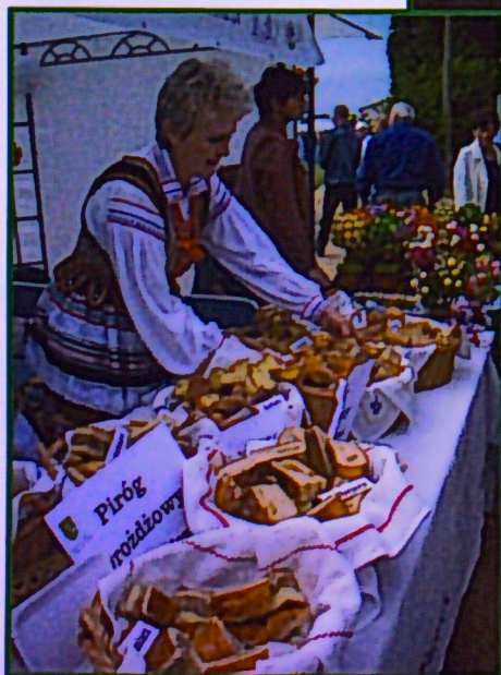
Święto piroga drożdżowego

Aby przypomnieć smak domowego ciasta pieczonego przez nasze babcie, gmina Jabłonna postanowiła zorganizować „Festyn Piroga Drożdżowego”. Podczas czerwcowej imprezy każdy mógł spróbować wypieków przygotowanych przez osiem zespołów Kół Gospodyń Wiejskich z terenu gminy. Degustacja pirogów drożdżowych była możliwa dzięki środkom unijnym, pochodzącym z Programu Rozwoju Obszarów Wiejskich na lata 2007-2013.