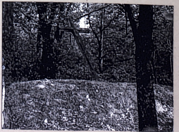
32. Dokumentacja fotograficzna