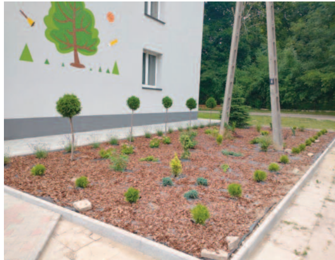
Nasadenia przy Szkole Podstawowej w Tuszowie (sołectwo Tuszów)