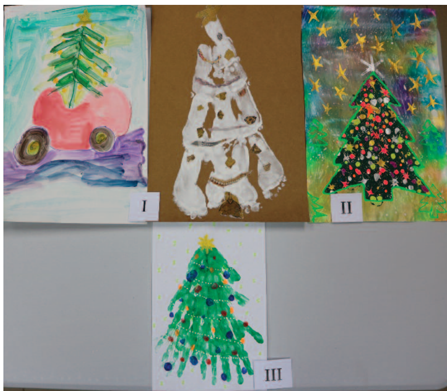
1. kategoria - rodziny z dziećmi do 5 r.ż.