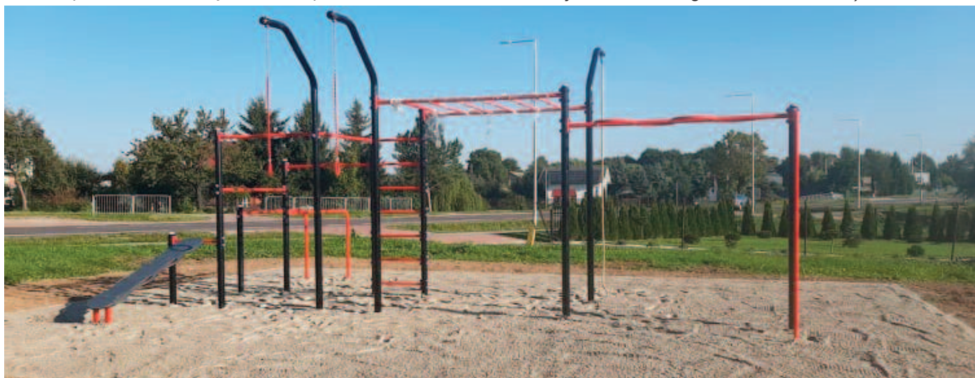
Strefa workout przy remizie OSP Czerniejów (sołectwo Czerniejów i Czerniejów-Kolonia)