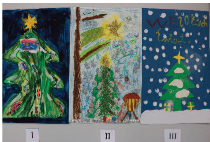
2. kategoria - dzieci w wieku 6-9 lat