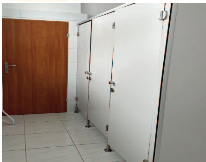
Remont łazienki w ZS w Piotrkowie (sołectwo Piotrków Pierwszy, Piotrków Drugi, Piotrków-Kolonia)