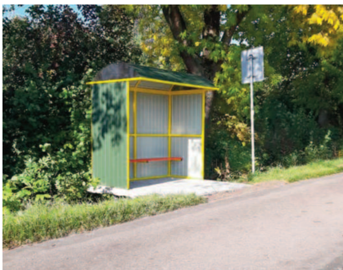
Dostawa i montaż wiaty przystankowej w m. Czerniejów-Kolonia (sołectwo Czerniejów-Kolonia)