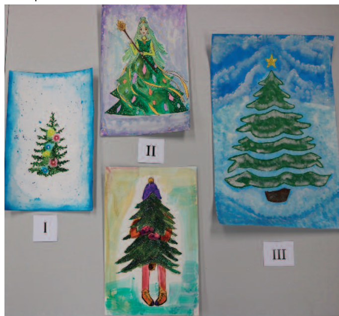
3. kategoria - dzieci w wieku 10-13 lat