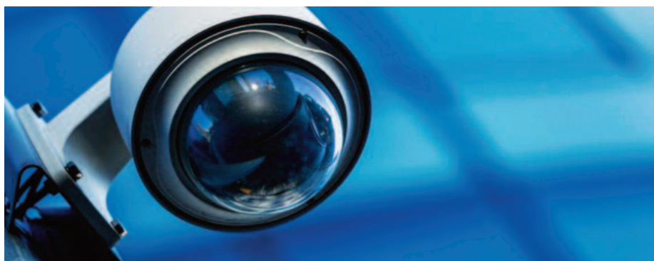
Montaż monitoringu przy OSP Skrzynice (sołectwa Skrzynice Pierwsze i Chmiel-Kolonia)

Wśród zrealizowanych działań znalazły się zadania inwestycyjne i remontowe, jak również przygotowa-