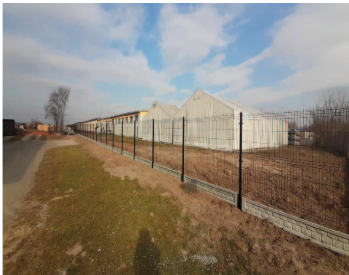
Budowa ogrodzenia przy OSP Jabłonna (sołectwo Jabłonna-Majątek)