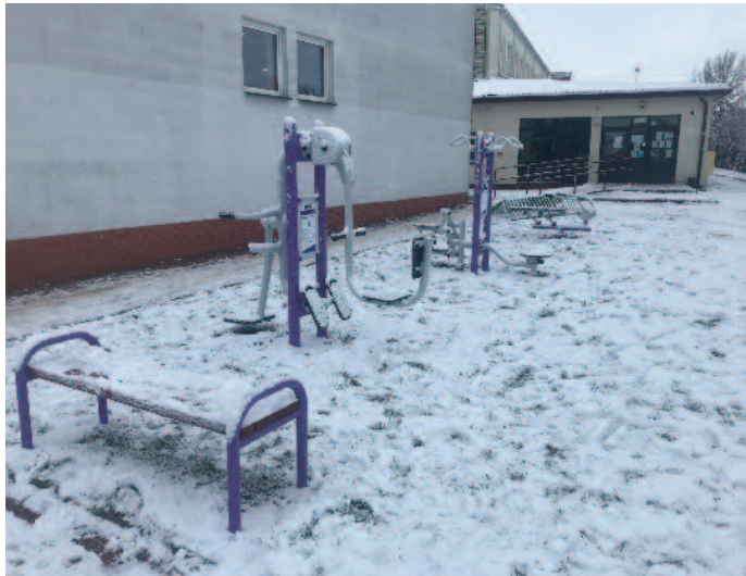
Utworzenie miejsca rekreacyjnego przy ZS w Jabłonie (sołectwo Jabłonna Druga)