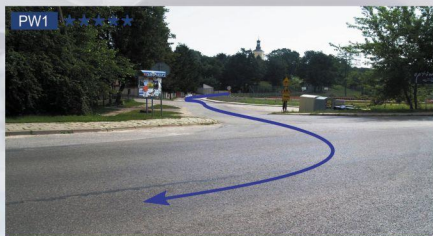
PW1 ★★★★★ OS 3/6 Dys (1,05km; 7,18km) N: 51°18'47.94" E: 22°33'47.59"

Opis: Możliwość oglądania przejazdu żalgów dwukrotnie. Z jednej strony wyjazd z wąskiej drogi na główną z podbielcem, z drugiej widoczna partia kilku żalgów z hopyną na hamowniu do prawego zjazdu. Dojazd do miejscowości Jankowice-Kolonia. Dojazd do punktu przebiegiem wyznaczonym przez organizatora. Parkowanie samochodów jednostronnie, przy prawej krawędzi jezdni.