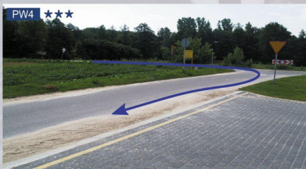
PW4 ★★★ OS 3/6 Dys (0,12km) N: 51°18'58.29" E: 22°32'13.01"

Opis: Po podjeździe, lewy ostry nawrót na zatraczonym asfalcie. Dojazd od drogi nr 19 z miejscowości Ciecierzyn. Możliwość przejazdu do punktu widokowego PW2.