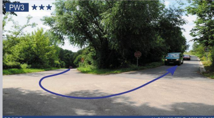
PW3 ★★★ OS 3/6 Dys (0,17km) N: 51°19'26.27" E: 22°34'39.03"

Opis: Z niewielkiego wzniesienia widoczna partia kilku żalgów na otwartym przestrzeni. Dojazd od drogi nr 19 z miejscowości Ciecierzyn. Dojazd do punktu widokowego od punktu PW0 na piechotę ok. 400m w dół przez prawy pasow, przebiegiem wyznaczonym przez organizatora.