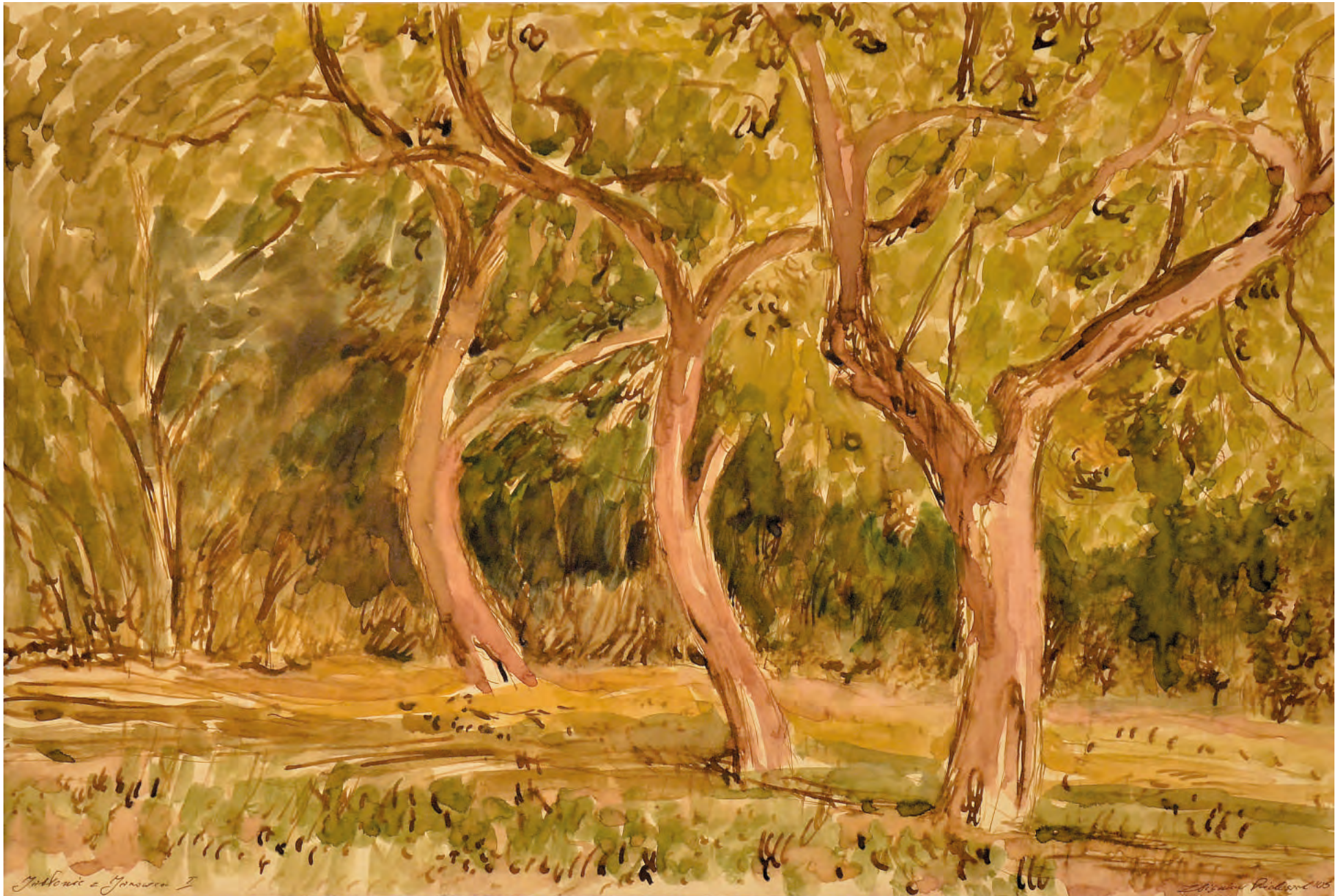
1. SAD W JANOWCU, 2005, akwarela, 34/49 cm