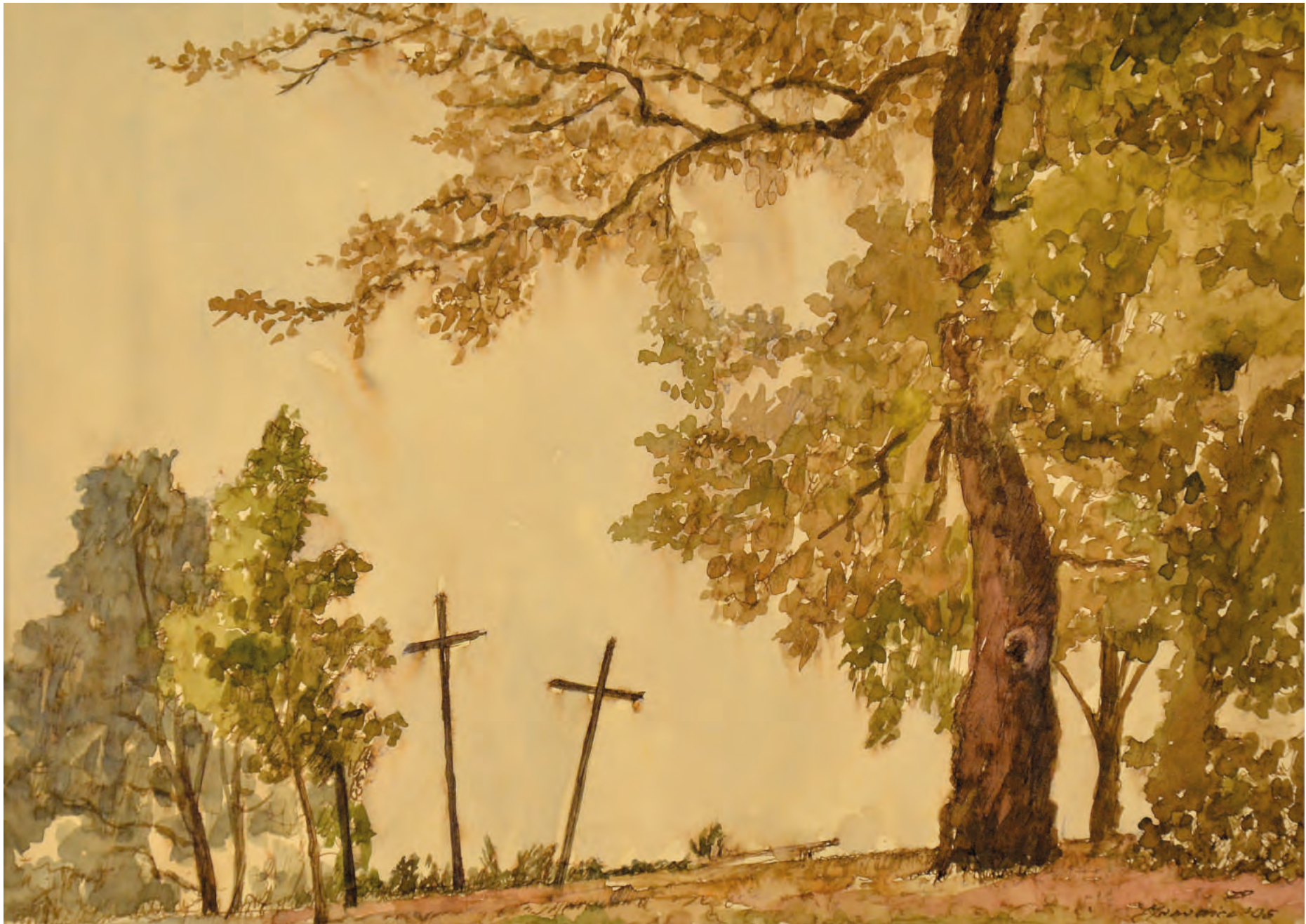
7. PEJZAŻ Z KRZYŻAMI, 2005, akwarela, 32,5/23 cm