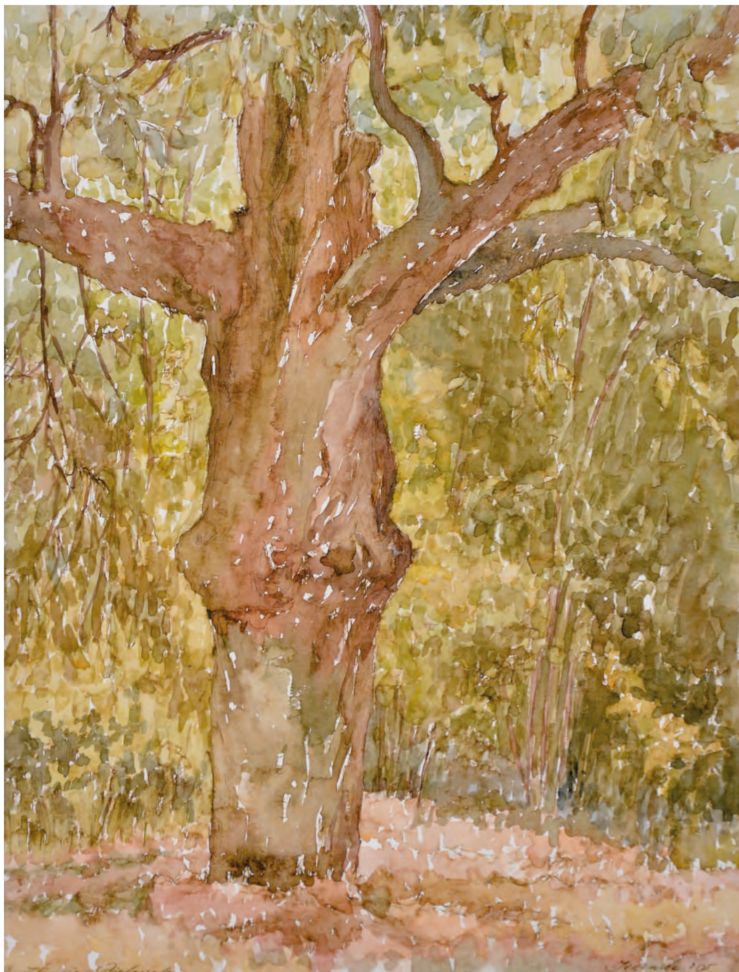
2. STARA CZEREŚNIA, 2005, akwarela, 41/29 cm