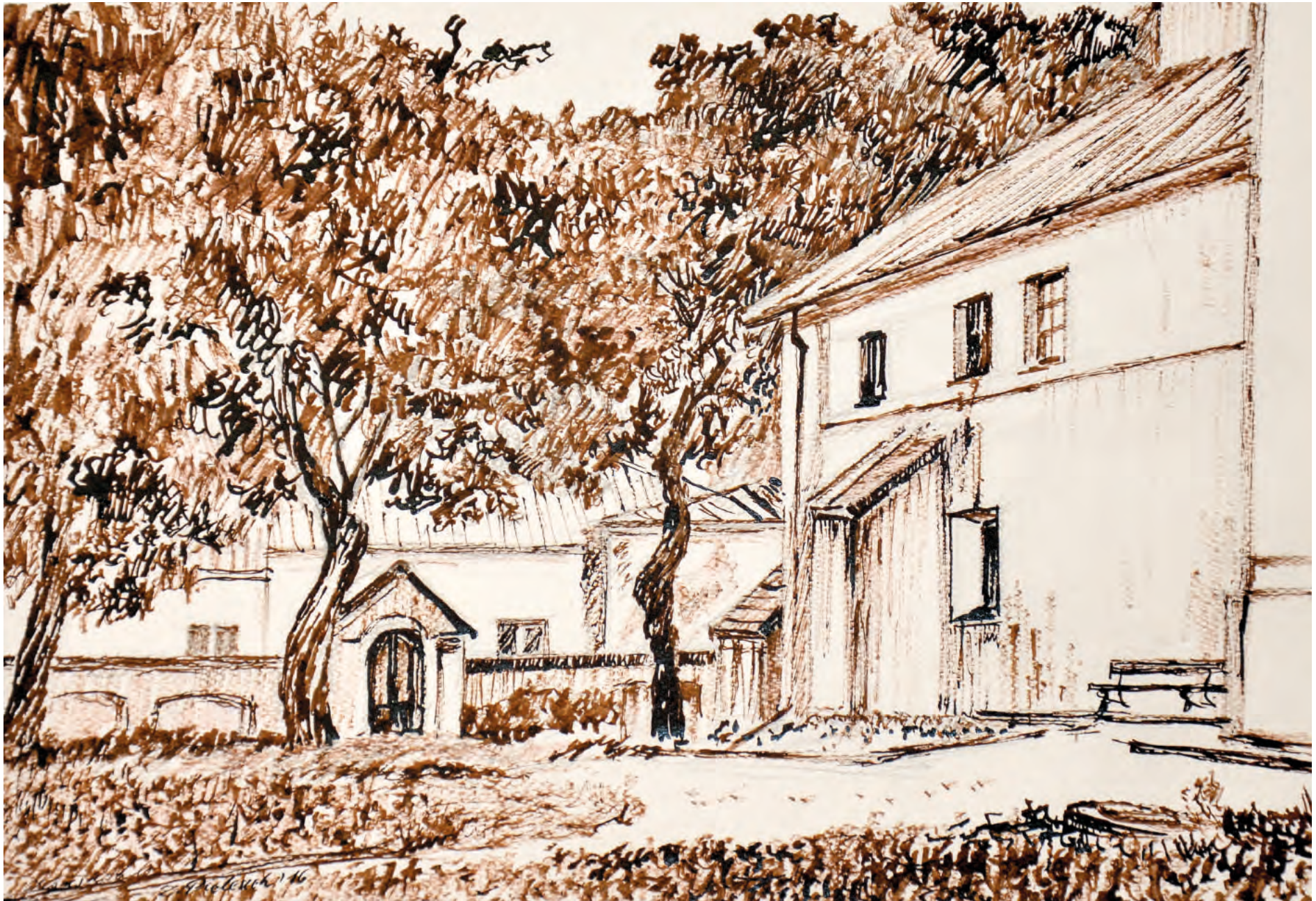
7. FARA W KOŃSKOWOLI, 2017, rysunek, 29/41 cm