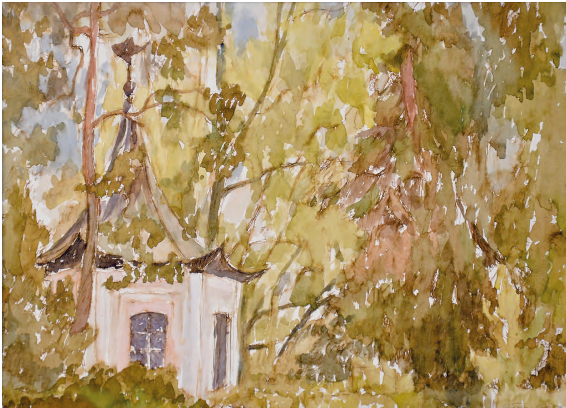
3. DOMEK CHIŃSKI, 2008, akwarela, 27,5/38 cm