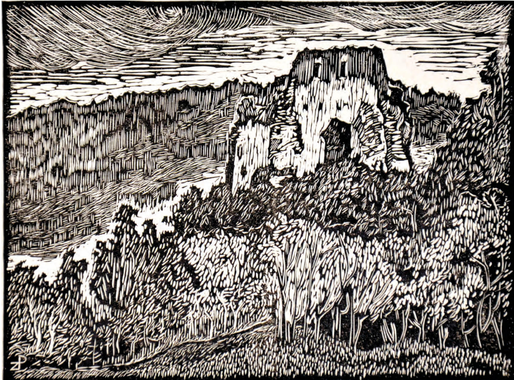
1. RUINY ZAMKU ESTERKI, 2009, linoryt, 15,5/20,8 cm