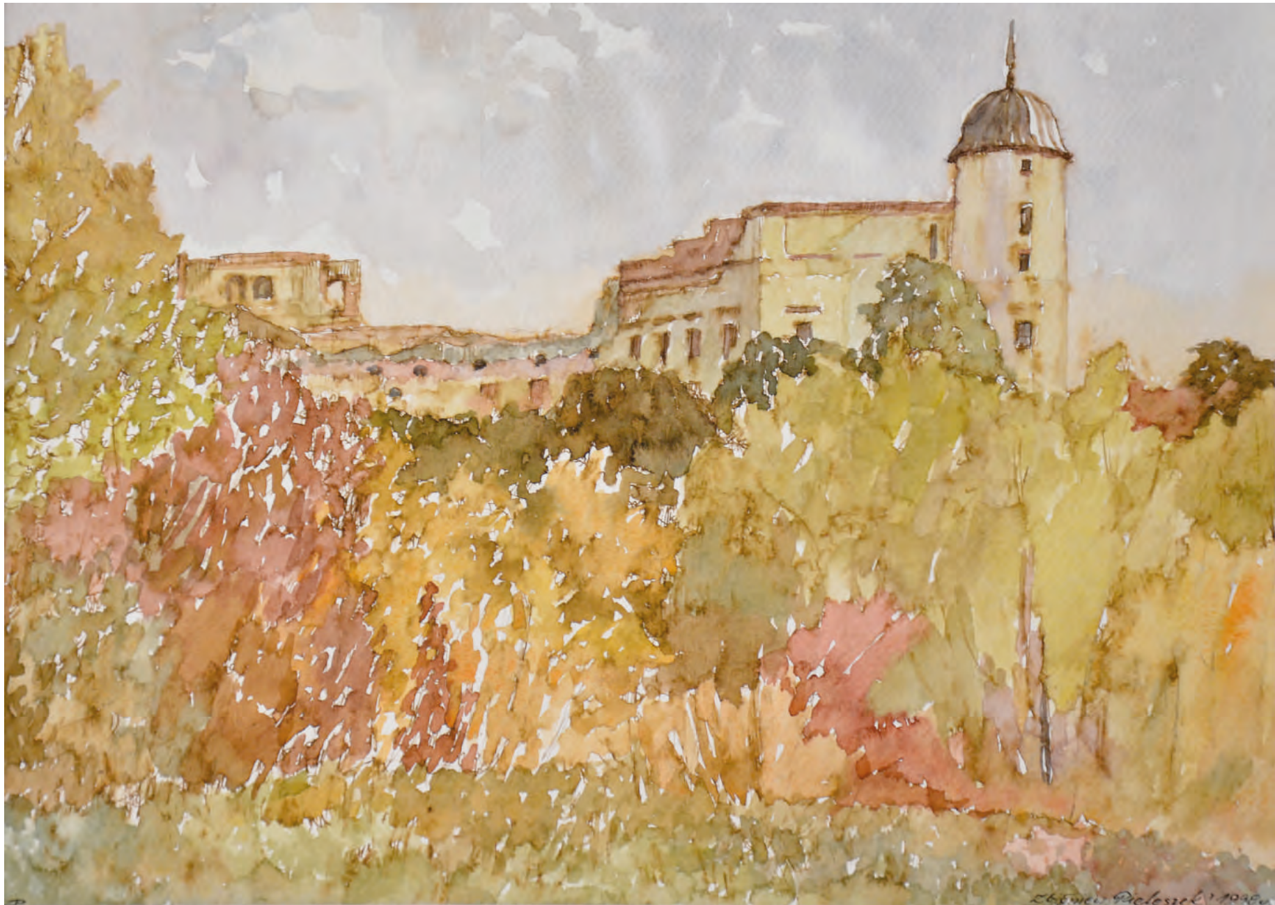
4. ZAMEK W JANOWCU JESIENIĄ, 2008, akwarela, 28/38 cm