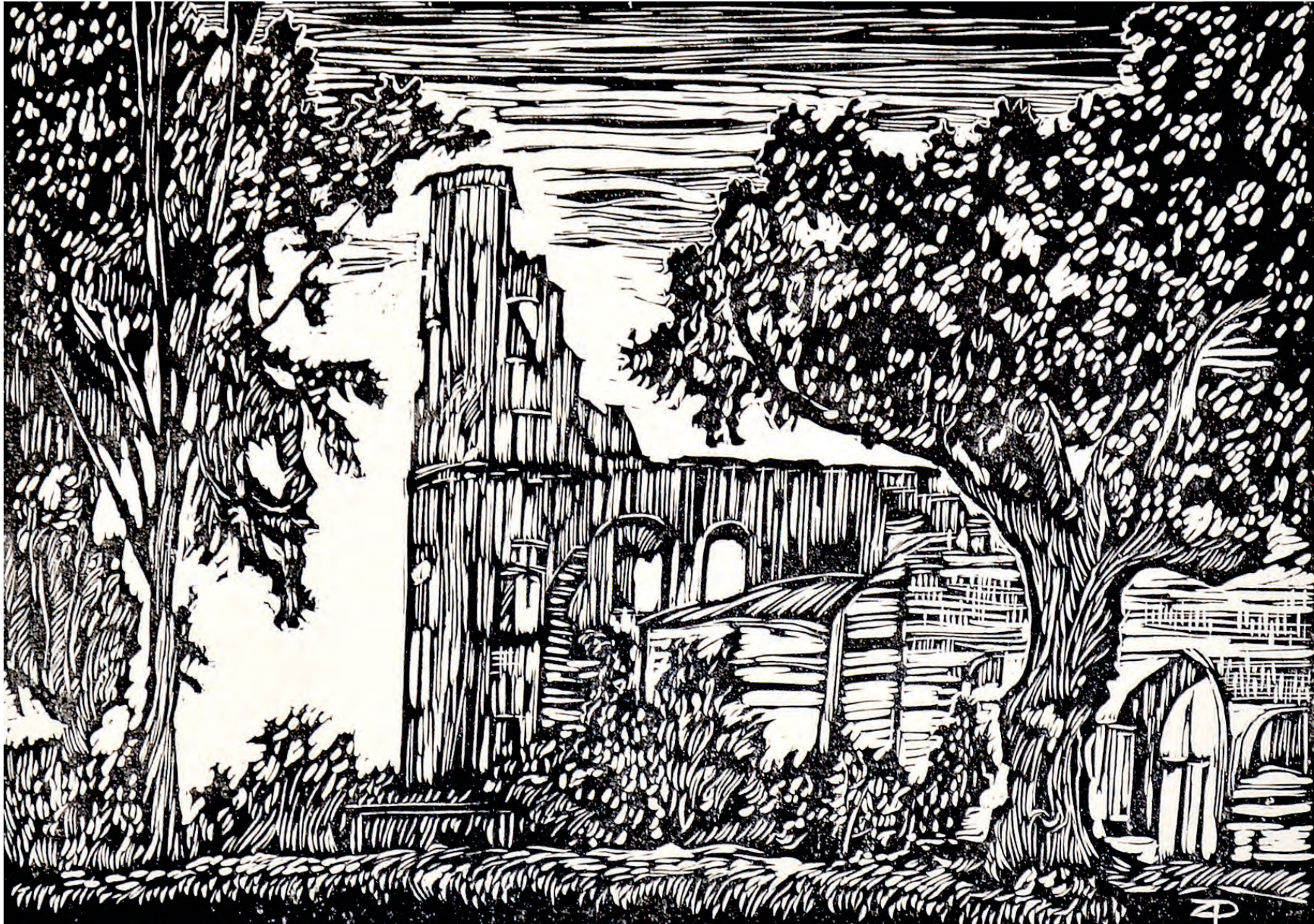
5. RUINY ZAMKU W JANOWCU, 2011, linoryt, 19/27 cm