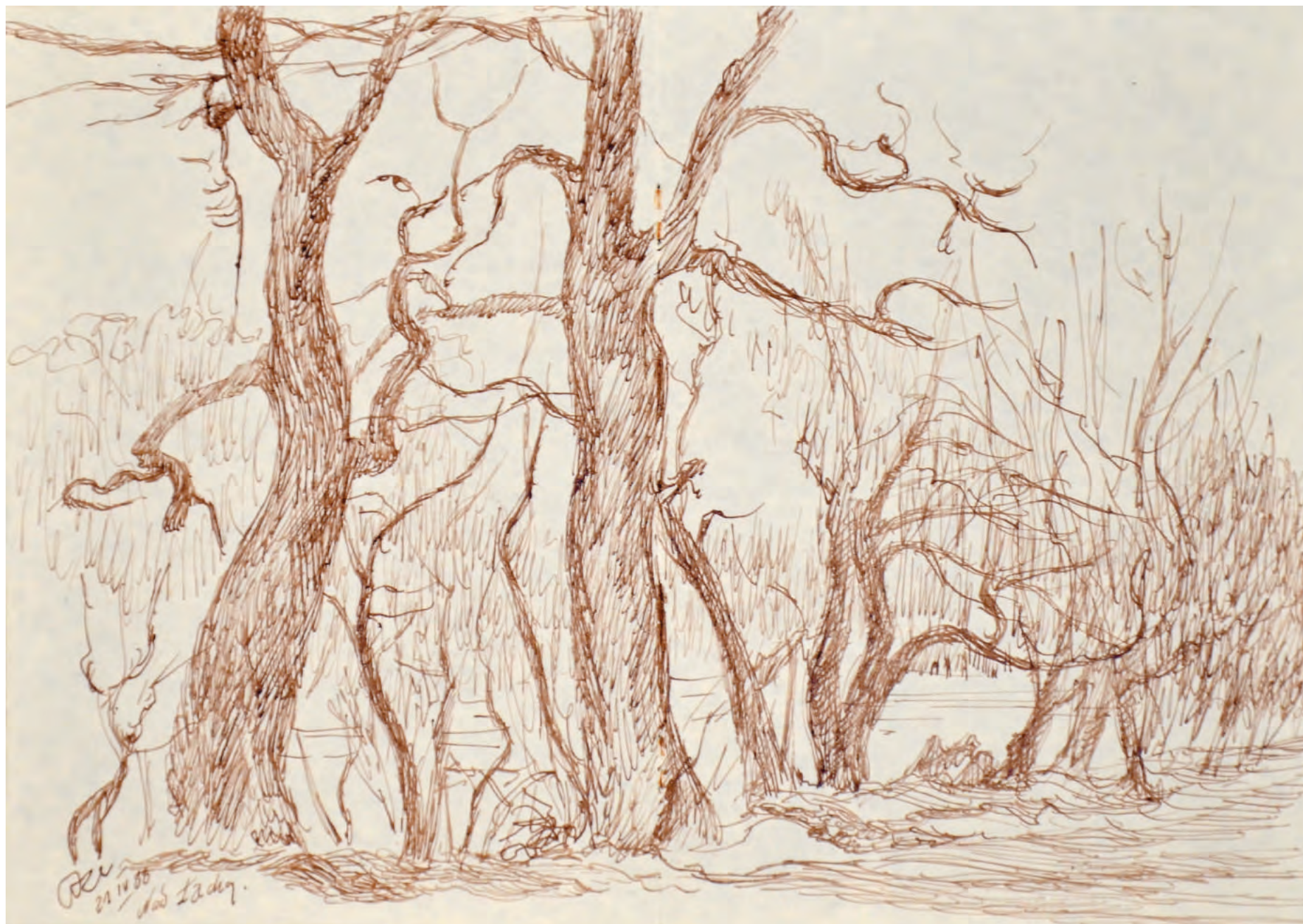
1. NAD ŁACHĄ WIŚLANĄ, 1988, rysunek, 17/27 cm