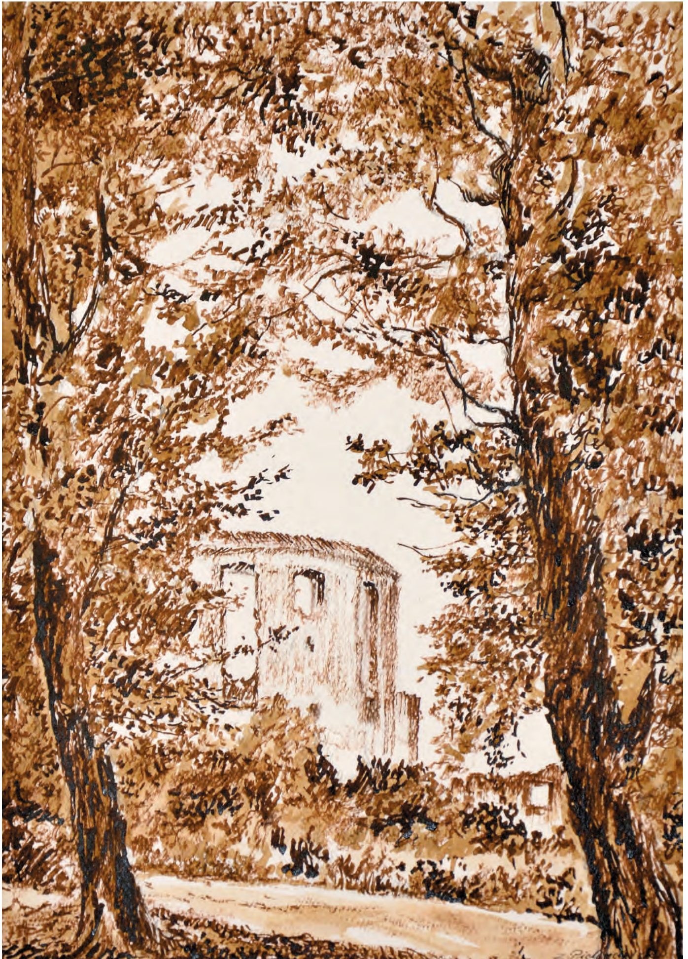
6. BASTEJA ZAMKOWA, 2016, sepia, 41/29 cm