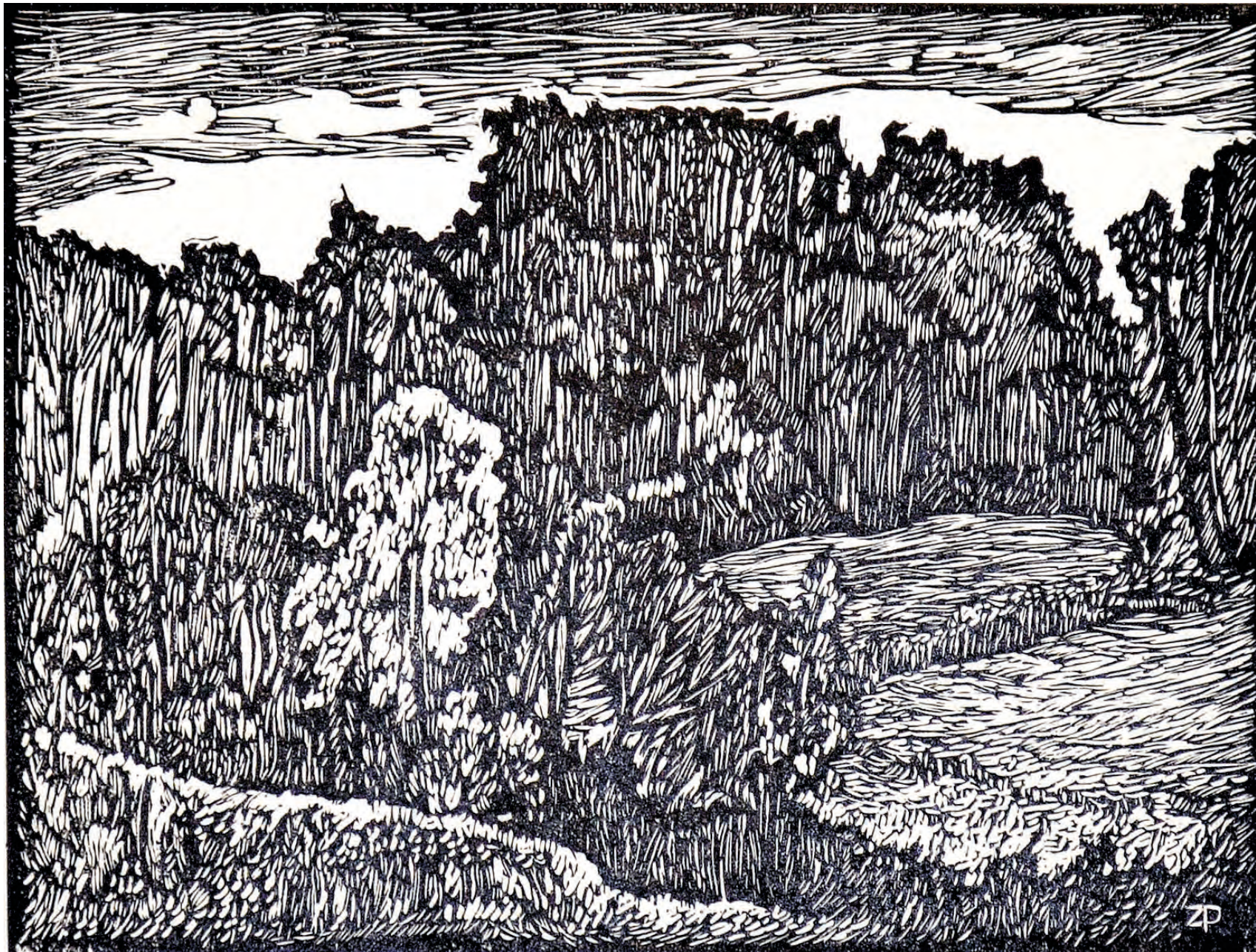
3. WĄWÓZ SKOWIESZYŃSKI, 2010, linoryt, 19/24 cm