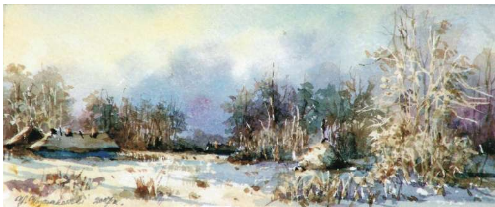
Akwarela 17,5x7 cm