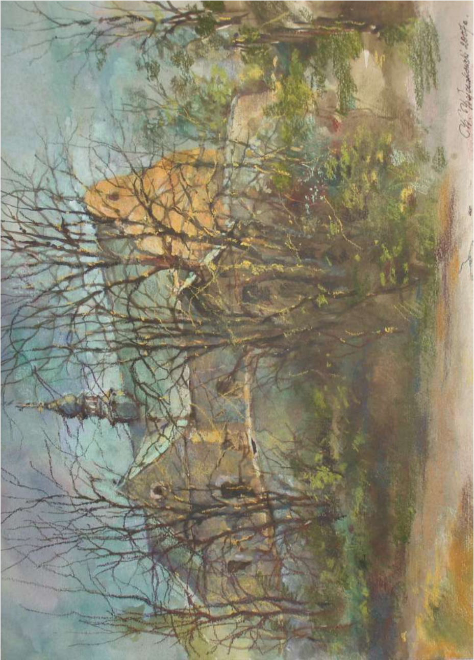
Pastel 43x32 cm