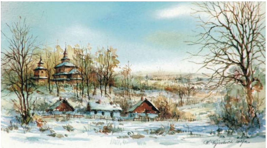
Akwarela 24x13 cm