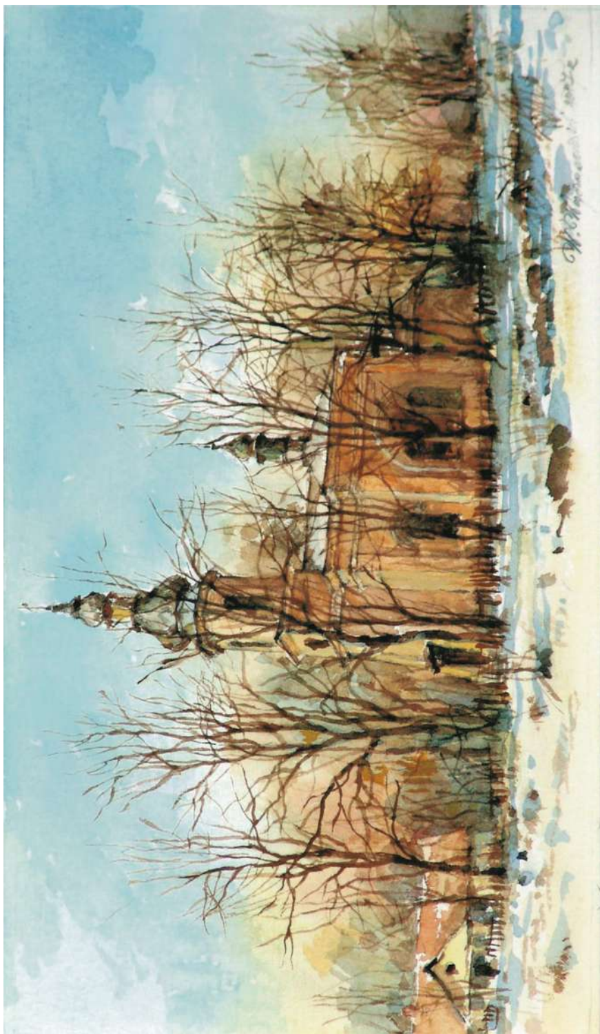
Akwarela 24,5x13,5 cm