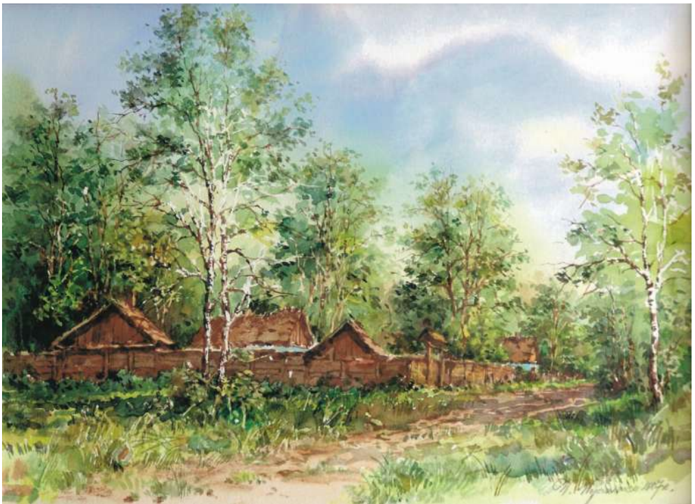
Akwarela 35x24 cm