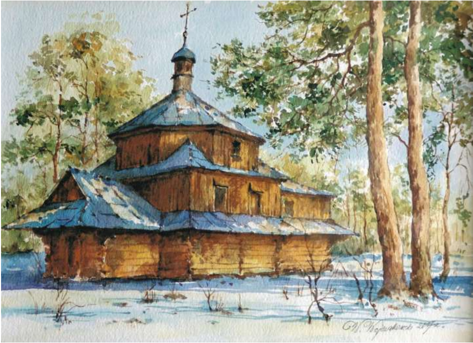
Akwarela 34,5x24 cm