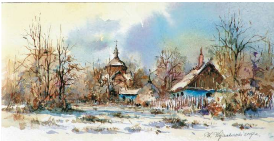
Akwarela 22,5x11 cm