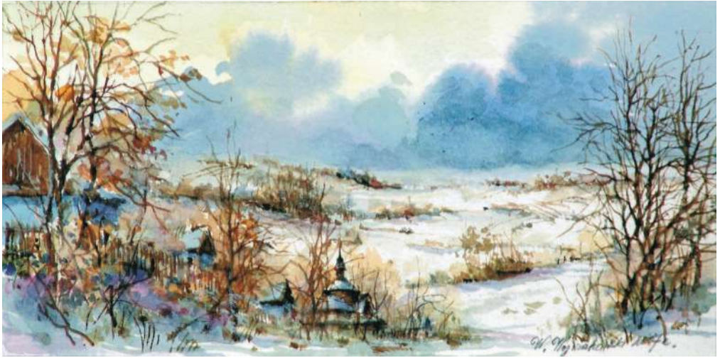
Akwarela 20x10 cm