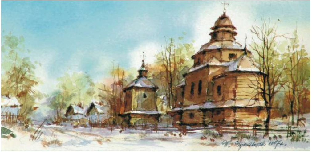
Aquarela 19,5x9,5 cm