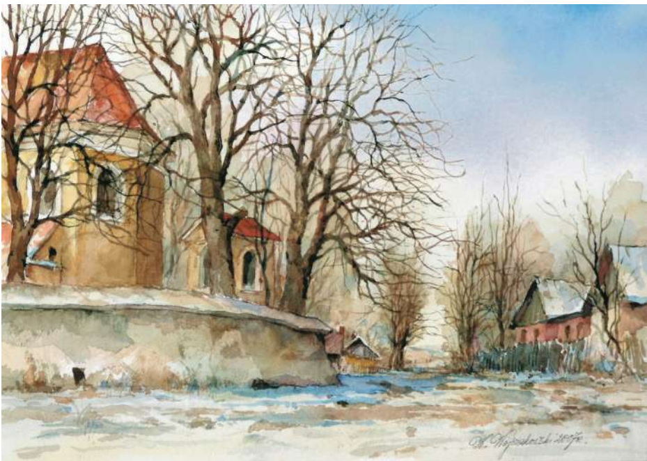
Akwarela 35x24 cm