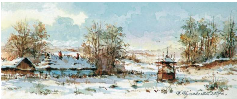
Akwarela 17,5x7 cm