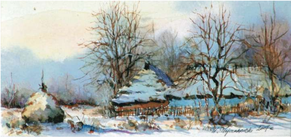
Akwarela 18,5x8,5 cm