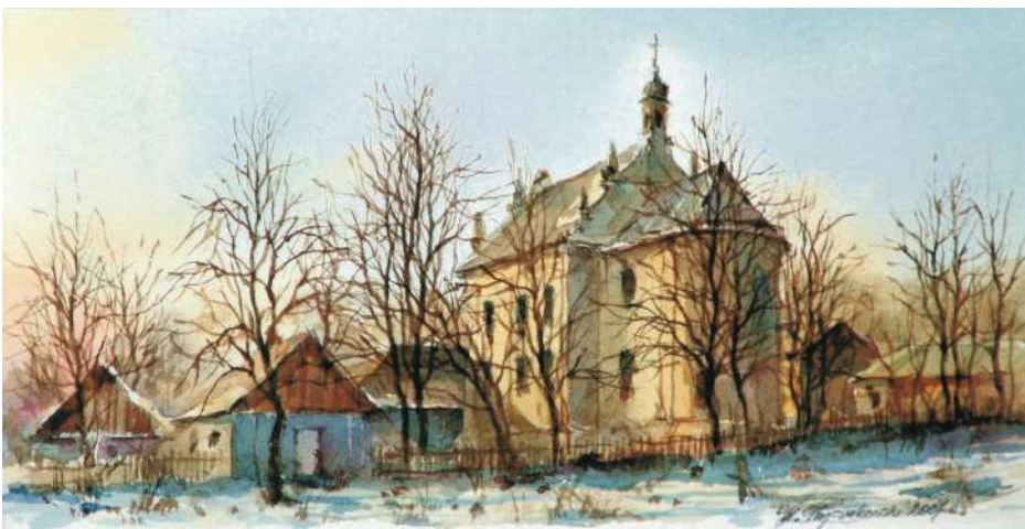
Akwarela 22,5x11 cm