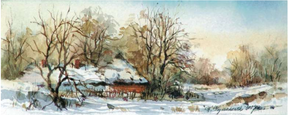
Akwarela 18,5x7,5 cm