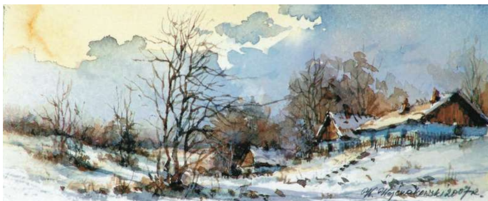
Akwarela 17,5x7 cm