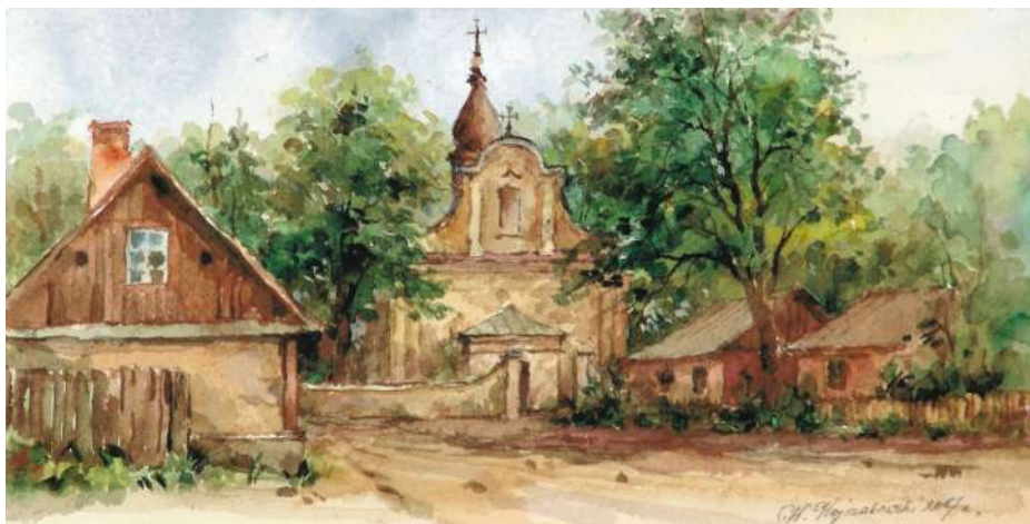
Akwarela 22,5x11 cm