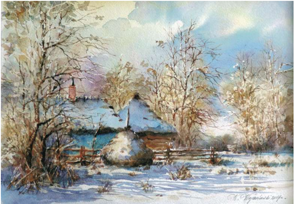
Aquarela 35x24 cm