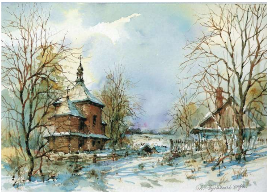
Akwarela 34,5x24 cm