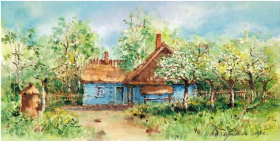
Akwarela 22,5x11 cm