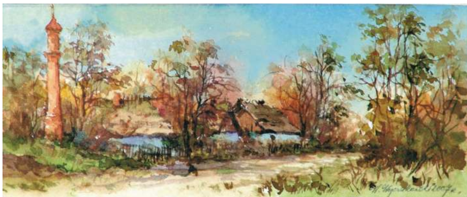
Akwarela 17,5x7 cm