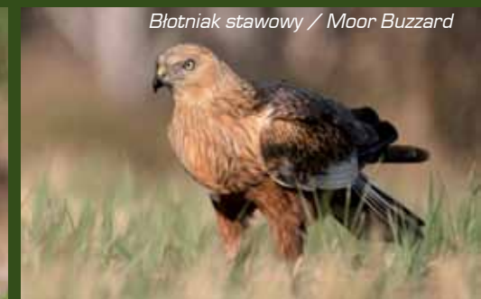
Błotniak stawowy / Moor Buzzard

Wspomniane dwie gminy leżą w dolinie Bystrej, niezwykle urokliwej rzeczki, która zwłaszcza na terenie Wąwolnicy wartko płynie urozmaiconym korytem. Bystra jest rzeką niemal górską i dlatego nie dziwi obecność w jej wodach pstrąga, o czym z pewnością wiedzą wędkarze. Ważnym przyrodniczo terenem są podmokłe łąki nad Bystrą. Od lat obfitują one w pary lęgowe derkaczy. W letnie wieczory i noce słychać ich charakterystyczne nawoływania. Mała lesistość Wąwolnicy i Nałęczowa sprawia, że brakuje tu typowej dużej zwierzyny leśnej. Ze ssaków spotkać można jedynie sarny, lisy, dziki i zające. Również przedstawiciele awifauny to gatunki należące do typowych dla terenów otwartych. Liczna jest tu populacja bażanta. Na polach występują kuropatwy i przepiórki, a polują liczne myszołowy, pustułki i błotniaki. Jak już wspomniano gminy te mają małą lesistość, ale nie oznacza to, że brak jest ciekawych drzewostanów. W Nałęczowie spotkamy bowiem liczne przykłady pomników przyrody, takie jak: miłorząb japoński, dąb szypułkowy i lipa drobnolistna.