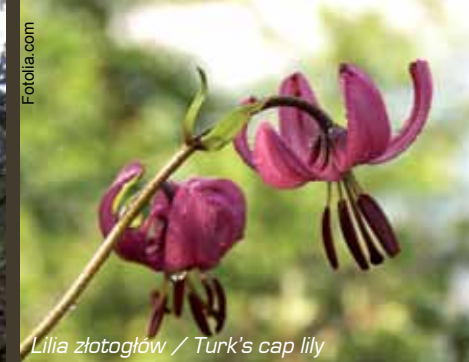
Lilia złotogłów / Turk's cap lily