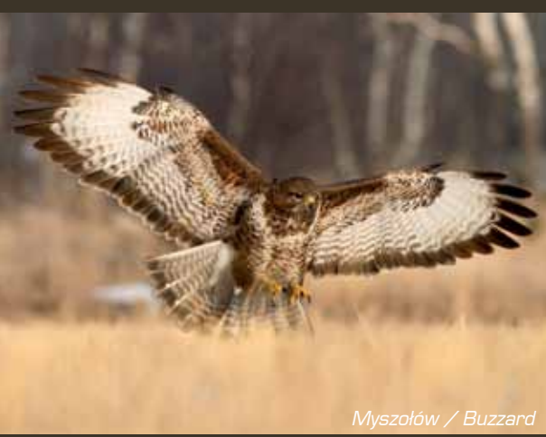
Myszolów / Buzzard