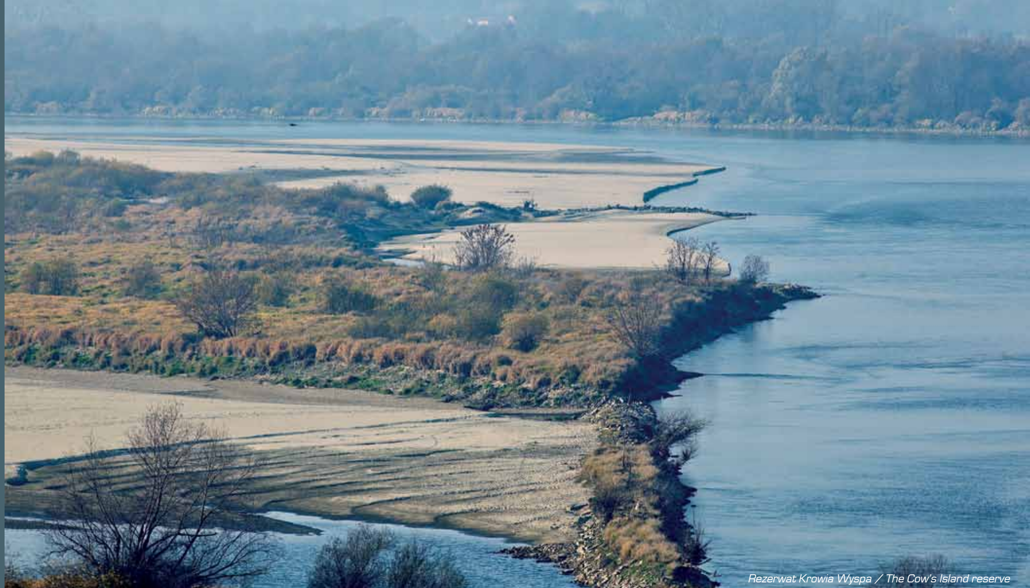
Rezerwat Krowia Wyspa / The Cow's Island reserve

Such conditions make the Vistula river a precious habitat for the animals. Especially the birds find the river area their shelter, a place to rear broods, to migrate and spend winter. South of Kazimierz Dolny a natural reserve Krowia Wyspa (Cow's Island) was formed to protect the avifauna representatives. In the area of the Małopolski Przełom Wisły (the Middle Poland Vistula River) the ornithologists found as many as 14 species of the Birds Directive and minimum two species of the Polish Red Data Book of Animals. The dominating species are seagulls and terns. On the islands the broods are reared by e.g. Mediterranean Gull – a species rare in Poland. This area is one of the most important breeding grounds in the country of Common Tern and Little Tern, Common Black-headed Gull, Mew Gull and Caspian gull, as well as Little Ringed Plover and Common Ringed Plover. Most of the national oystercatcher population nests here. Apart from birds one may find also mammals such as otter, beaver or American mink.