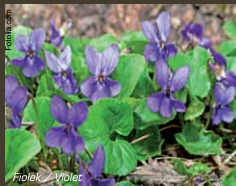
Fiolet / Violet