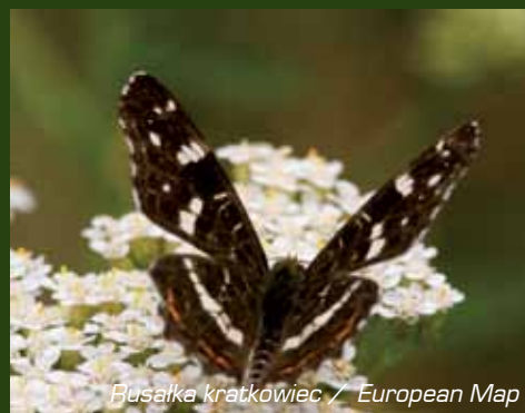
Husałka kratkowiec / European Map