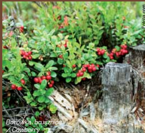
Borówka brusznica / Cowberry