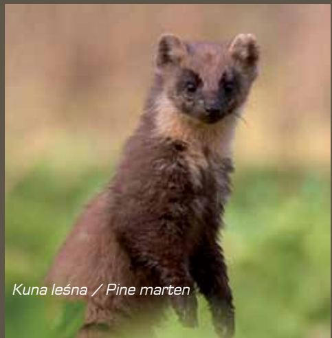
Kuna leśna / Pine marten