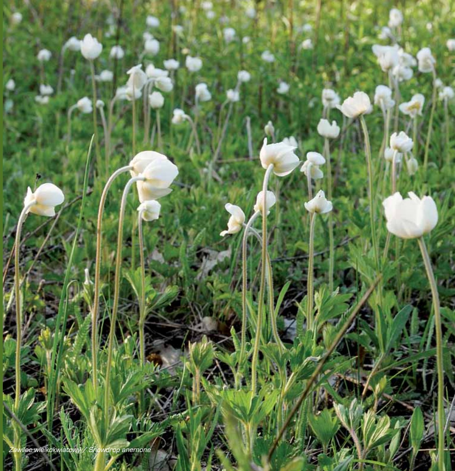
Zawilec wielokwiatowy / Snowdrop anemone

Na łąkach, w zaroślach i lasach porastających brzegi rzeki tętni życie. Schronienie znajdują tu sarny, zajęce i lisy. Na brzegu rzeki swoje nory budują bobry, norki amerykańskie i piżmaki. W stromych zboczach doliny zamieszkują także jaskółki brzegówki i zimorodki, które niczym szmaragdowo-pomarańczowe strzały latają nisko nad wodą lub przesiadują na wystających nad taflę Wisły konarach i gałęziach. Zarośla dają schronienie dziwonii – jednemu z ciekawiej ubarwionych polskich ptaków. Samiec tego niewielkiego ptaszka ma intensywnie czerwoną głowę i pierś. Ten egzotycznie wyglądający gatunek przebywa w kraju bardzo krótko, tylko latem. Równie pięknie prezentuje się spotykany w nadrzecznych zaroślach podróżniczek. Wieczorami z wysokich traw dobiegają odgłosy derkacza, a z zarośli strumieniówki. Z kolei w lasach nadrzecznych spotkać można kilka gatunków dzięciołów (w tym rzadkiego dzięcioła biało-grzbiatego). Samotne wierzby nadwiślańskie dają z kolei schronienie dudkom. Bardzo bogaty jest również świat owadów. Na stepowych, ciepłych łąkach spotkać można modliszki. Latem oko cieszy wielobarwny świat motyli. Żyje tu największy środkowoeuropejski motyl – pawica gruszówka, której rozpiętość skrzydeł osiąga nawet 15 cm.