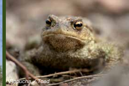
Ropucha / Toad