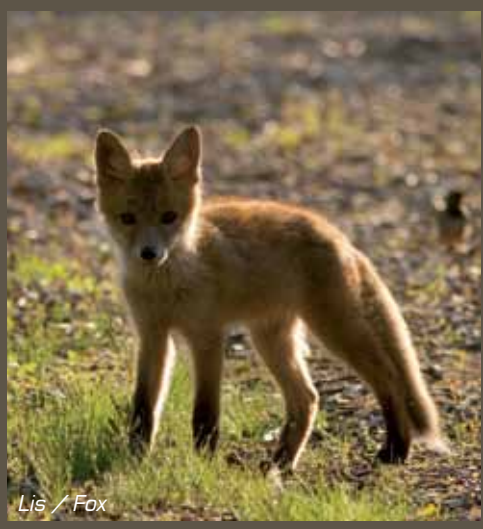
Lis / Fox