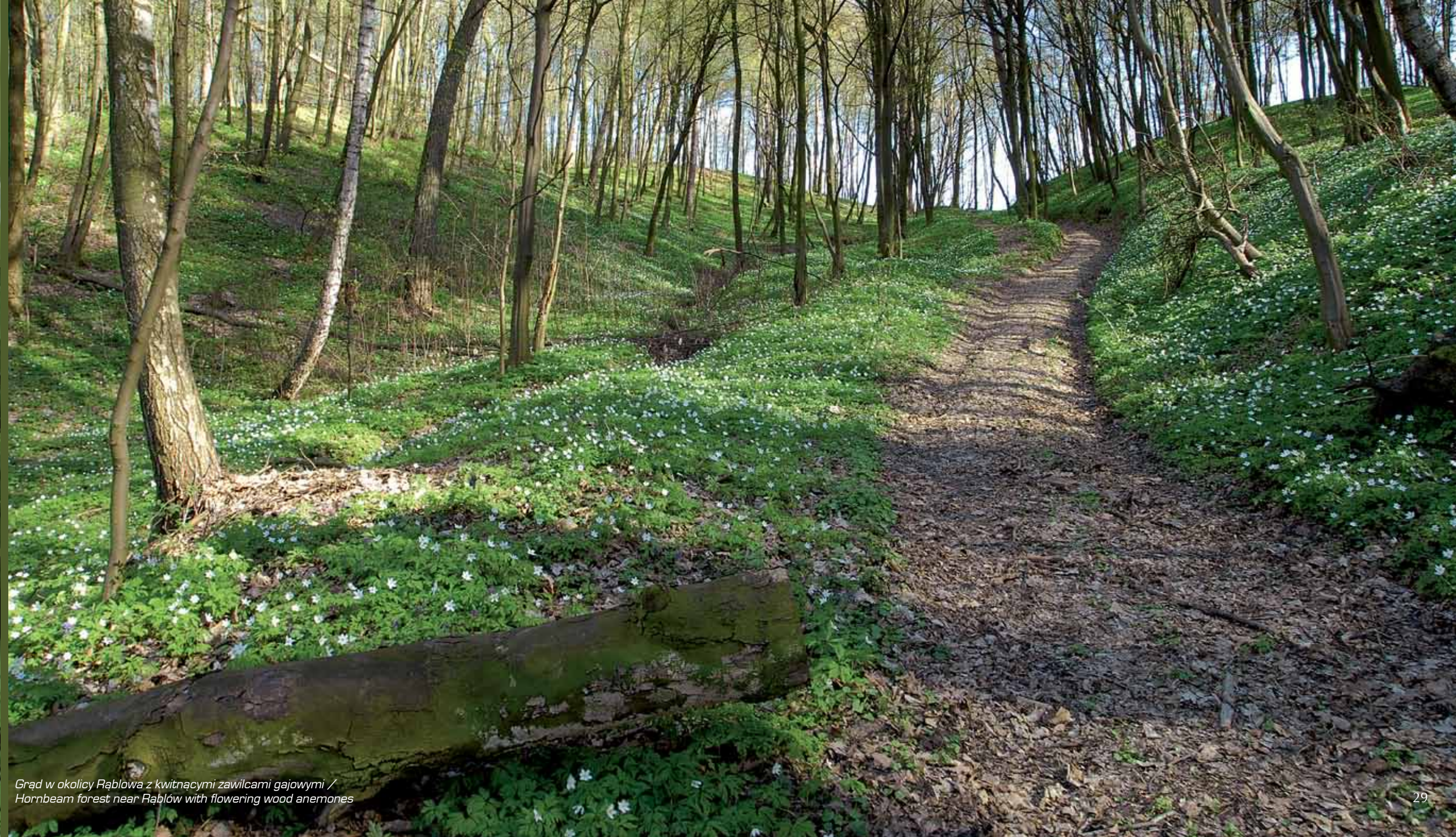
Grząd w okolicy Rąblowa z kwitnącymi zawilcami gajowymi / Hornbeam forest near Rąblów with flowering wood anemones