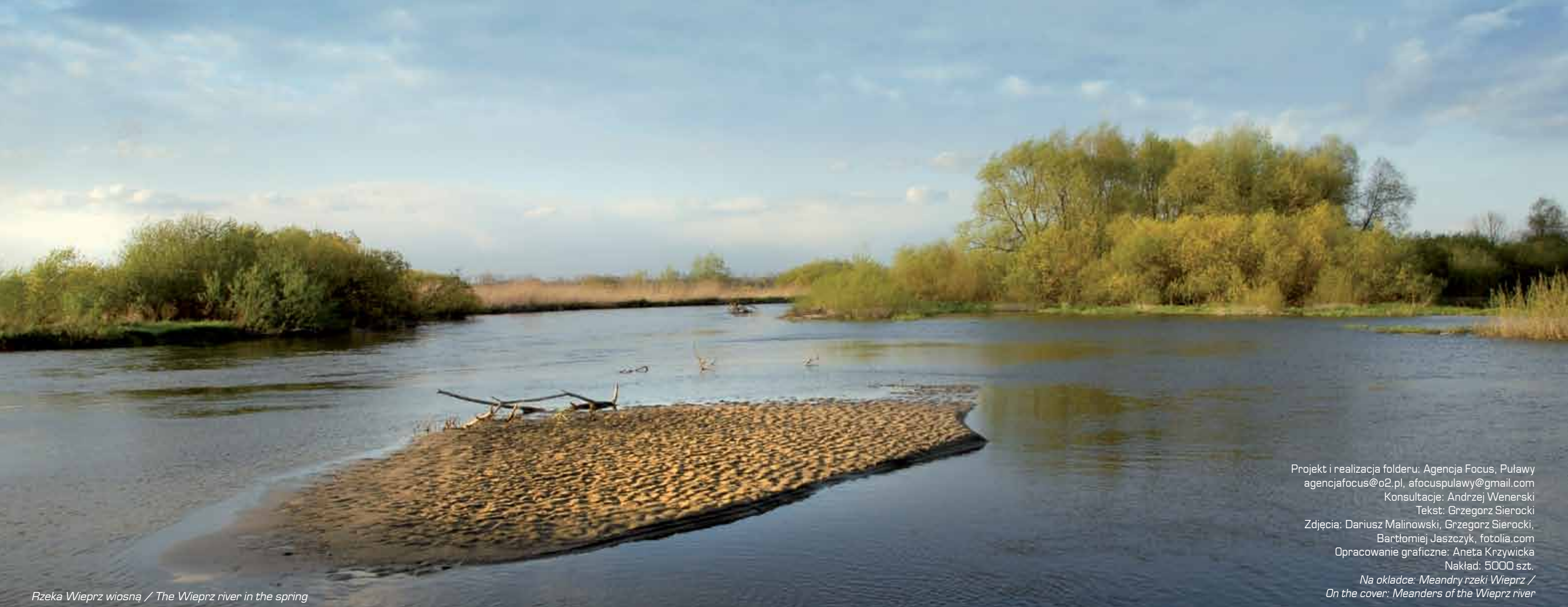
Rzeka Wieprz wiosną / The Wieprz river in the spring

Projekt i realizacja folderu: Agencja Focus, Puławy agencjafocus@o2.pl, afocuspulawy@gmail.com Konsultacje: Andrzej Wenerski Tekst: Grzegorz Sierocki Opracowanie graficzne: Aneta Krzywicka Nakład: 5000 szt. Na okładce: Meandry rzeki Wieprz / On the cover: Meanders of the Wieprz river