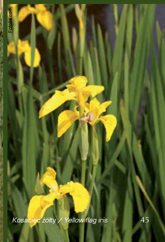
Kosaciec żółty / Yellow flag iris