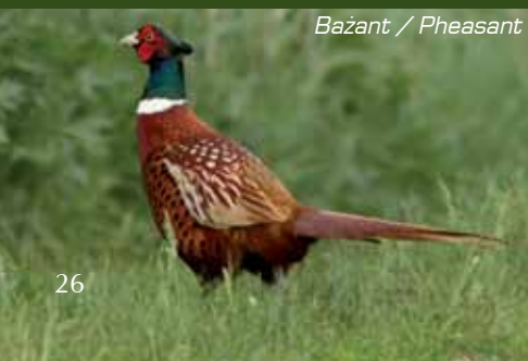
Bażant / Pheasant