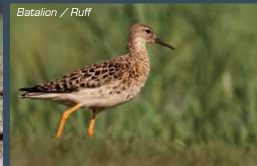
Batalion / Ruff