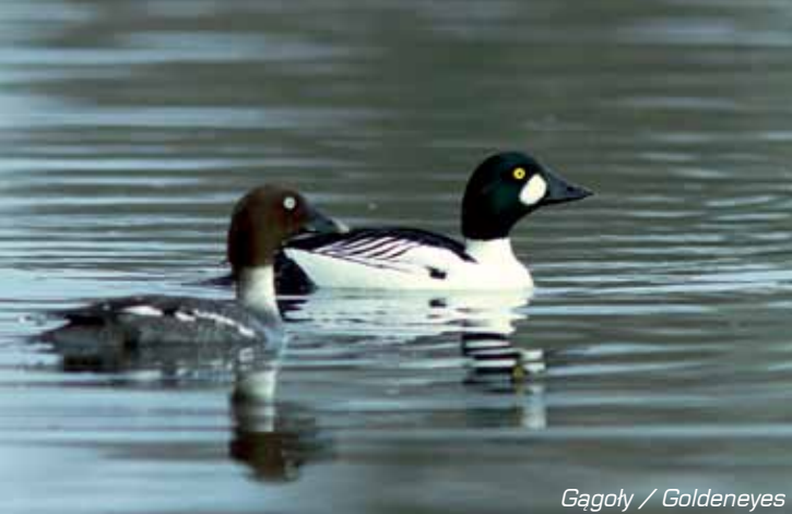
Gagoly / Goldeneyes