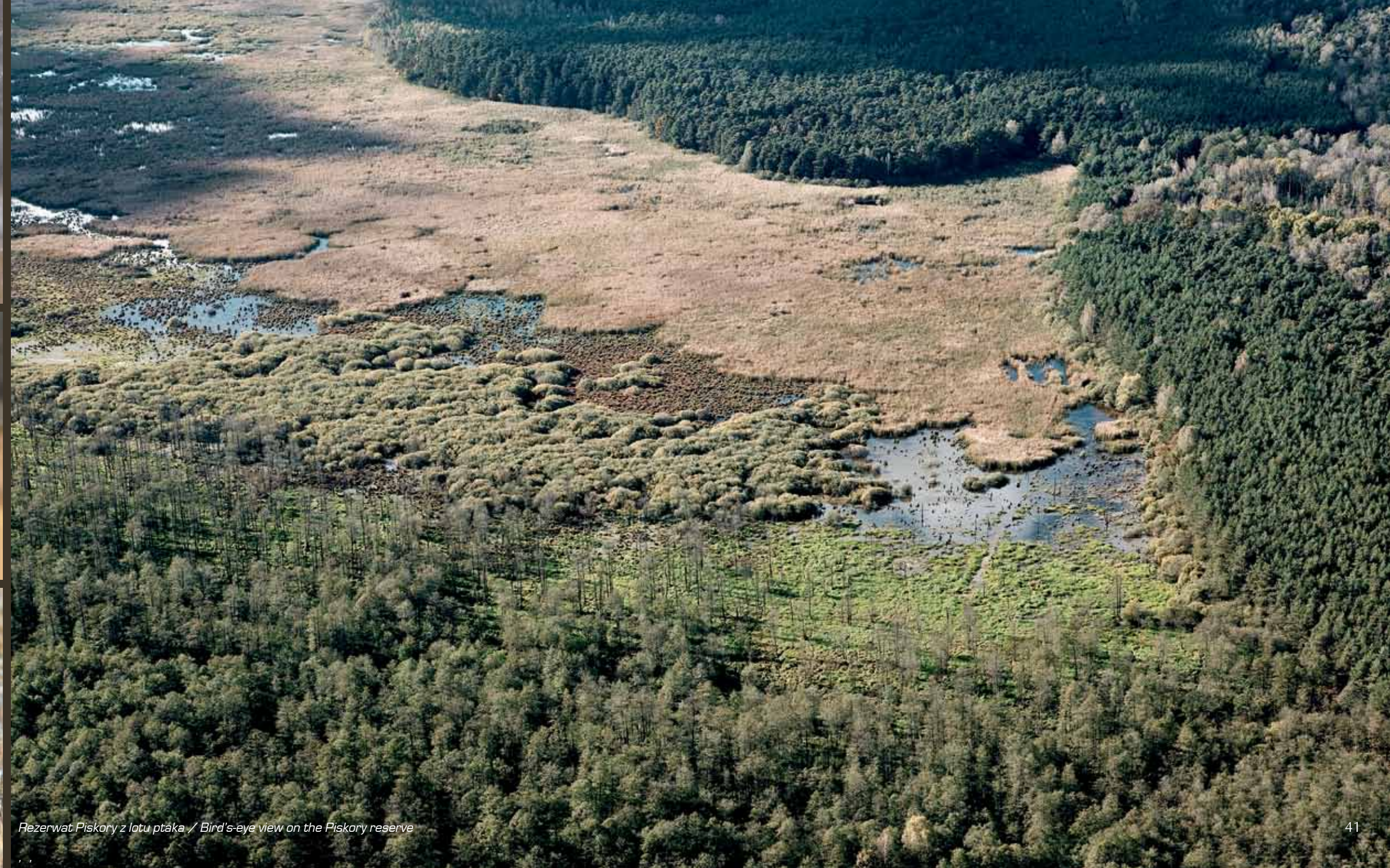
Rezerwat Piskory z lotu ptaka / Bird's-eye view on the Piskory reserve