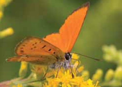
Czerwończyk dukacik / Scarce Copper