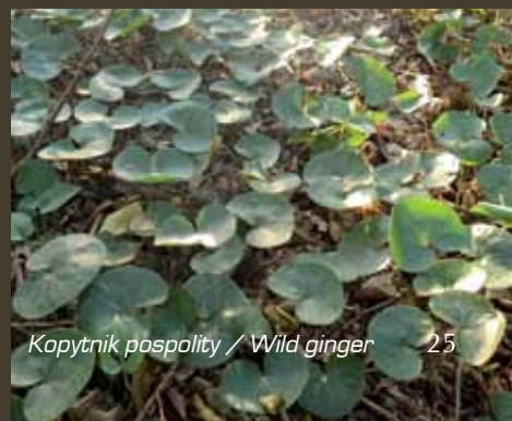
Kopytnik pospolity / Wild ginger