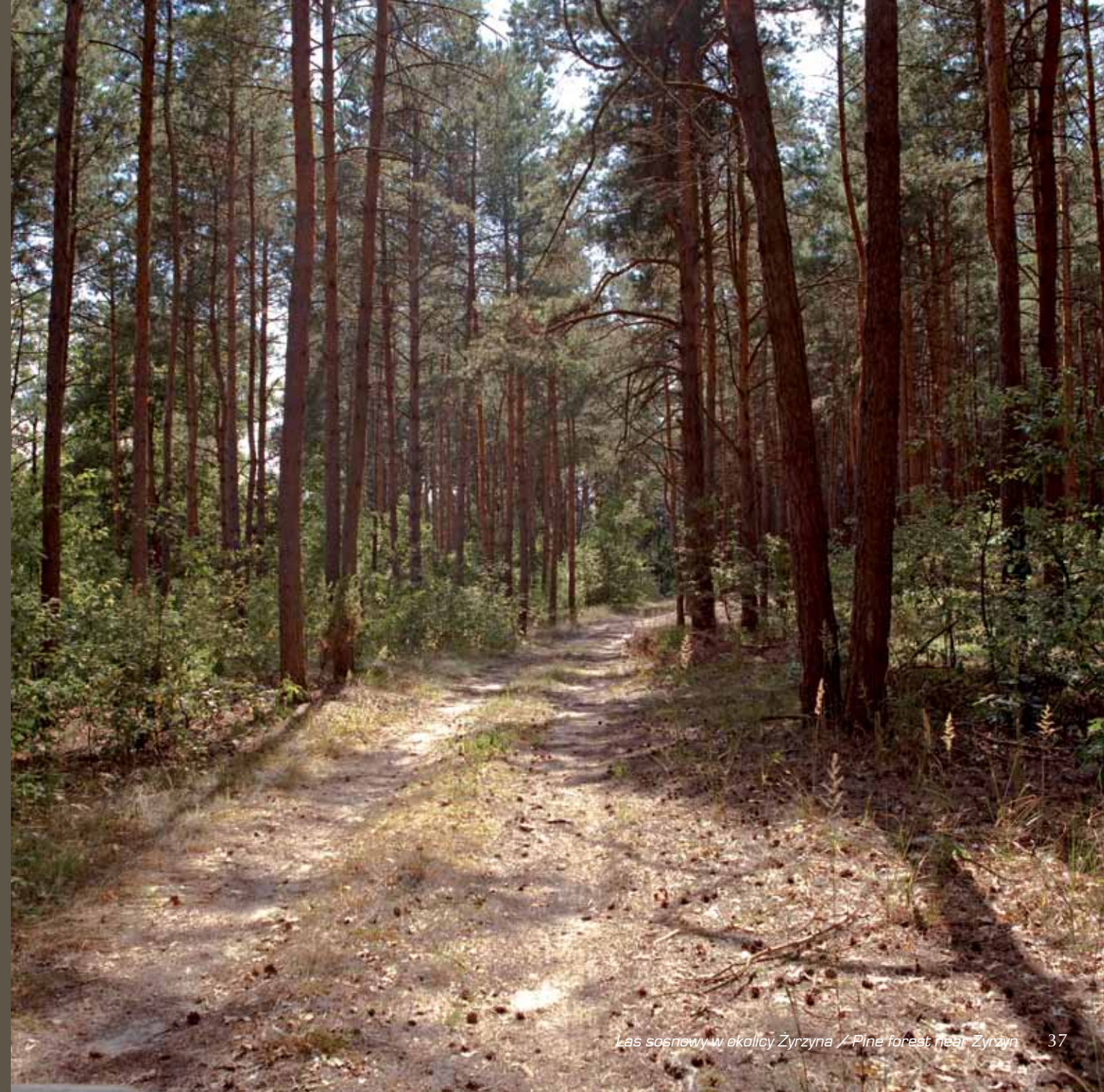
Las sosnowy w okolicy Żyrzyna / Pine forest near Żyrzyn 37