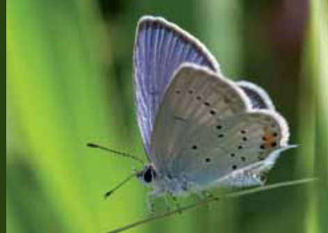
Modraszek argiades / Short-tailed Blue