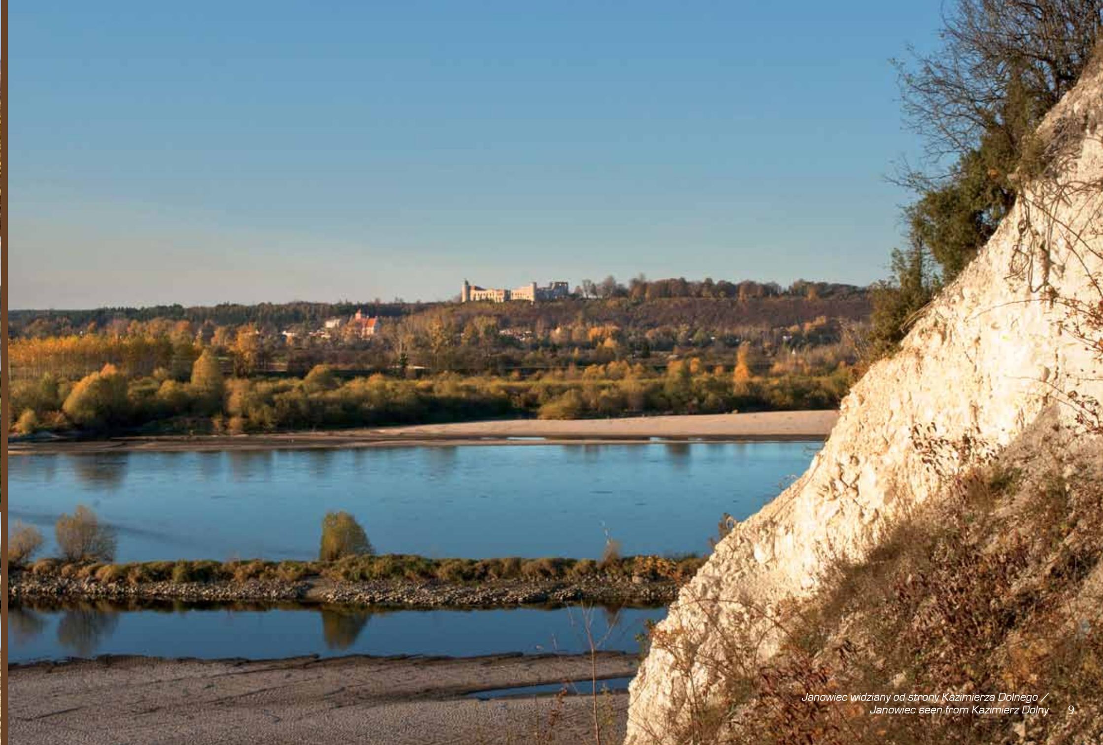
Janowiec widziany od strony Kazimierza Dolnego / Janowiec seen from Kazimierz Dolny