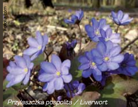
Przyłaszczka pospolita / Liverwort