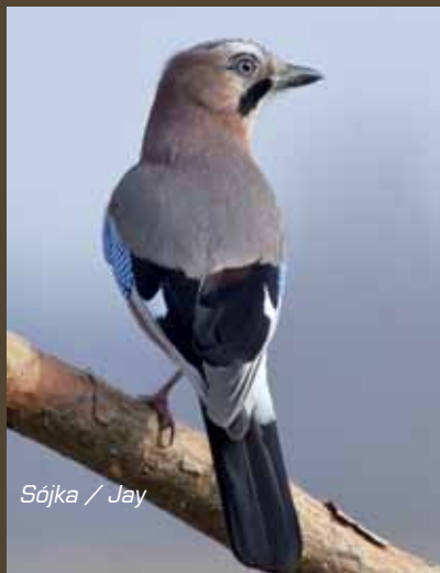
Sójka / Jay

W okolicach Kazimierza Dolnego z Małopolskim Przełomem Wisły graniczy niepowtarzalna w skali całej Europy kraina – Płaskowyż Nałęczowski. Swą wyjątkowość teren ten zawdzięcza budowie geologicznej i procesom erozyjnym. Z geologicznego punktu widzenia Płaskowyż Nałęczowski to pokłady wapienne przykryte czapą podatną na niszczenie, miękkiej skały lessowej. Pokrywa lessu sięga nawet 30 m, a ponieważ płyną tędy wartkie rzeki i strumienie, teren ten został „pocięty” licznymi wąwozami i jarami. Ich głębokość dochodzi do 30 m. Średnia gęstość wąwozów to 11 km na 1 km 2 powierzchni. Tak gęstej sieci nie ma w całej Europie. Co ciekawe, procesy erozyjne na tym terenie zachodzą stale, dlatego sieć wąwozów, jarów i dołów zmienia się niemal każdego roku. Miłośnicy geologii mogą tu zaobserwować wszystkie stadia procesów erozyjnych.