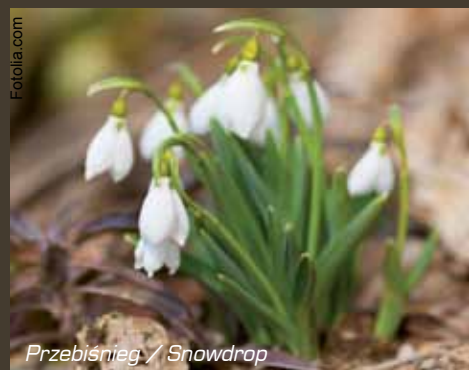
Przebiśnieg / Snowdrop