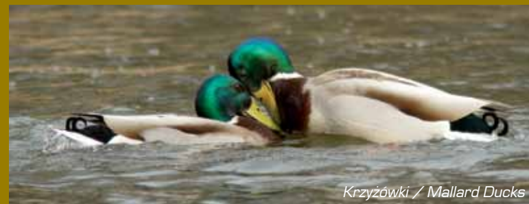
Krzyżówki / Mallard Ducks

While staying in Puławy one must visit the Czartoryskis' park. Apart from its historical values the park plays a crucial natural role. For the botanists it is a habitat for many trees, including exotic ones. Unfortunately, a lot of these were destroyed during a storm in the 90s, but there are still c. 300 tree species. One may find small-leaved lime, Pedunculate oak, Sessile oak, Norway maple, sycamore, European ash, white poplar, hornbeam, black and grey alder, beech, elm and many others. Among exotic trees, introduced in this area, we admire horse-chestnut, yellow buckeye, black locust, tulip tree, catalpa, Weymouth pine, thuja, Turkish hazel, ginkgo biloba, red oak, sumac, black and grey walnut, Canadian hemlock, Douglas-fir, tree of heaven. The old trees provide shelter for many birds. We encounter here e.g. Great Spotted Woodpeckers, Middle Spotted Woodpeckers, Green Woodpeckers, black woodpeckers, numerous tits, nuthatches, doves or treecreepers. Broods are reared by two pairs of tawny owl in the park. An important place for the animals is the Vistula sandbank situated in the so-called lower garden. The easily overgrown reservoir became the breeding place for the goldeneye – a duck species from the north. Apart from that it is a brood rearing site for swans, Mallard ducks, moorhens and coots. In the thicket one may observe the grass snakes and slow worms. The sandbank is also a habitat for numerous frogs. Recently one could also spot the European pond turtles.