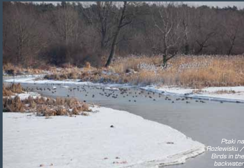
Ptaki na Rozlewisku / Birds in the backwater

Talking of the Vistula one may not forget its fish inhabitants. The anglers know the regional waters' abundance in impressive specimens of pike, catfish, asp, as well as bream, roach and chub. Also rare species of fish find shelter in the river's water – these are Amur bitterling, eel and spined loach.