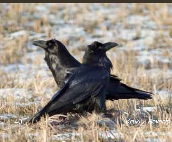
Kruki / Ravens