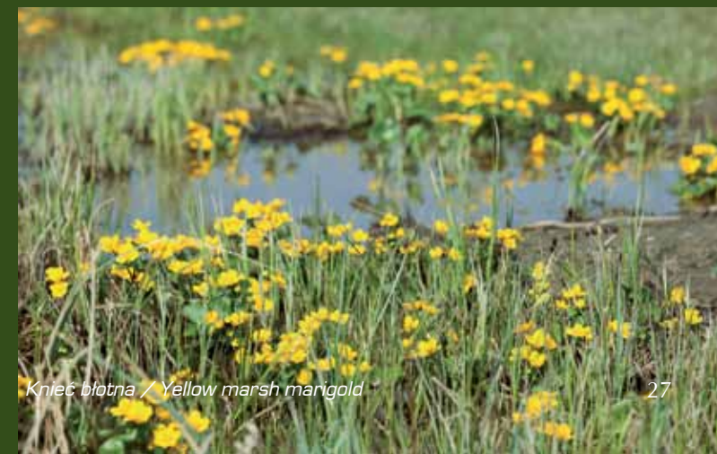
Knieć błotna / Yellow marsh marigold