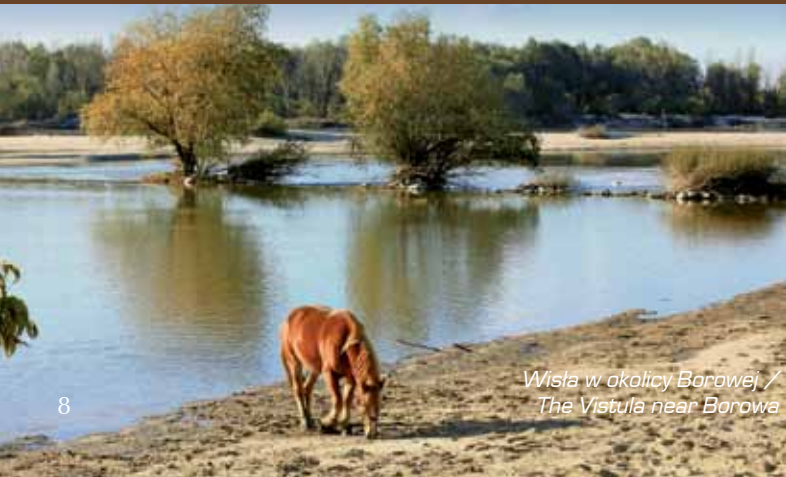
Wisła w okolicy Borowej / The Vistula near Borowa