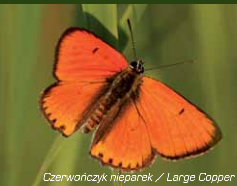
Czerwończyk nieparek / Large Copper