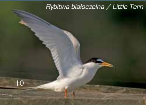
Rybitwa białoczelna / Little Tern