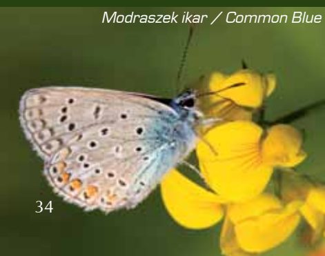
Modraszek ikar / Common Blue