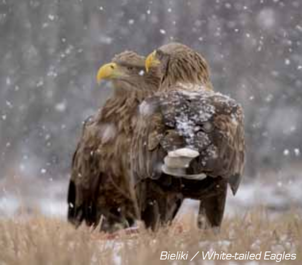
Bieliki / White-tailed Eagles