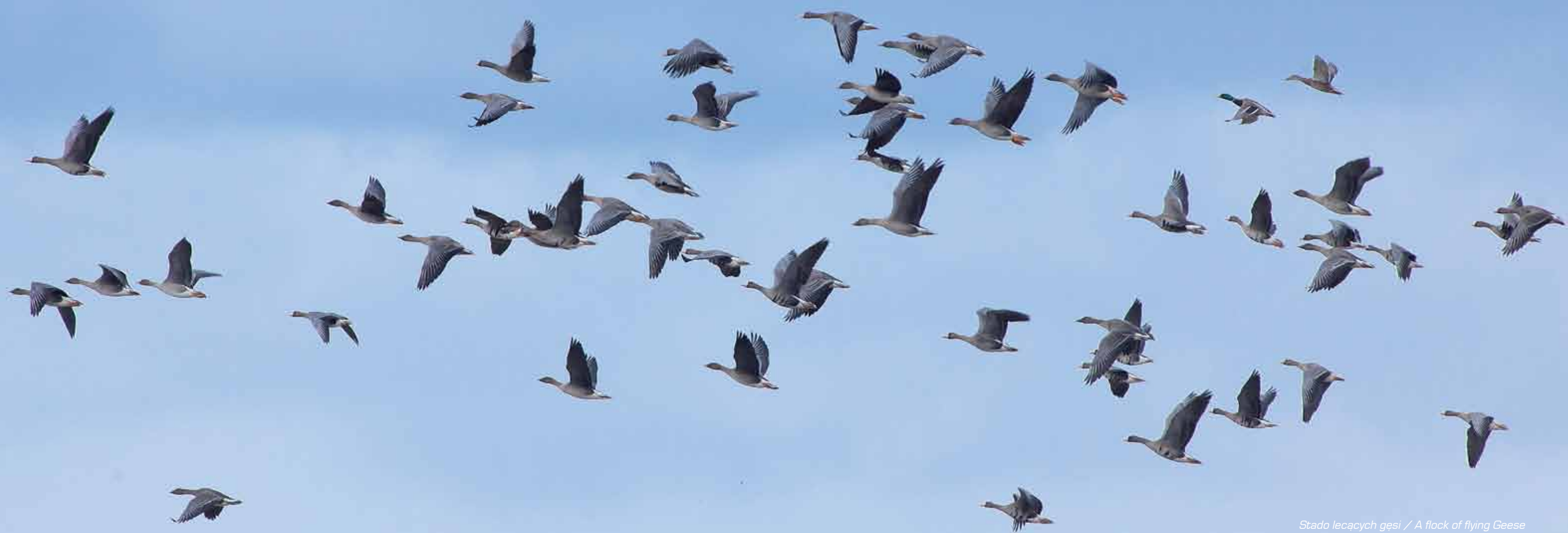
Stado lecących gęsi / A flock of flying Geese

Doskonałe warunki panują także na kolejnym odcinku rzeki – tzw. Dolinie Środkowej Wisły, która ciągnie się od Puław aż po Płock. Brzegi nie są tu tak strome, ale nie brakuje pięknych piaszczystych wysp i bujnie porośniętych brzegów. Wisła ma tu charakter rzeki roztokowej z licznymi starorzeczami. Świat zwierząt reprezentowany jest głównie przez ptaki. Spotkać tu można około 300 gatunków, z czego ponad połowa wyprowadza tu lęgi. Aż 30 spotykanych tu gatunków znalazło się w Załączniku I Dyrektywy Ptasiej, a 5 wpisanych jest do Polskiej Czerwonej Księgi Zwierząt. Obok wspomnianych wcześniej mew, rybitw i sieweczek spotkać tu można wiele gatunków kaczek i traczy – lęgi wyprowadzają tu krzyżówka, płaskonos, nurogęs. Stałym mieszkańcem wysp rzecznych są także brodziec piskliwy, rycyk, krwawodziób i czajka. Przez cały rok spotkać tu można również polujące czaple siwe i białe oraz bociany: białego i czarnego. Na kaczki chętnie poluje bielik, a ryby są obiektem polowań rybołowa i błotniaka stawowego.