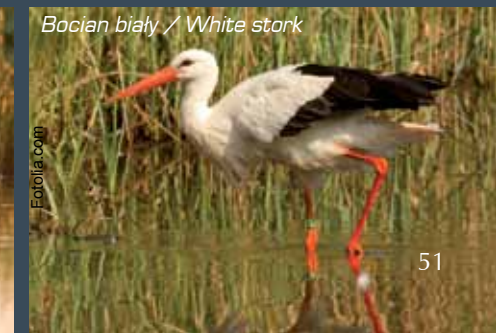
Bocian biały / White stork