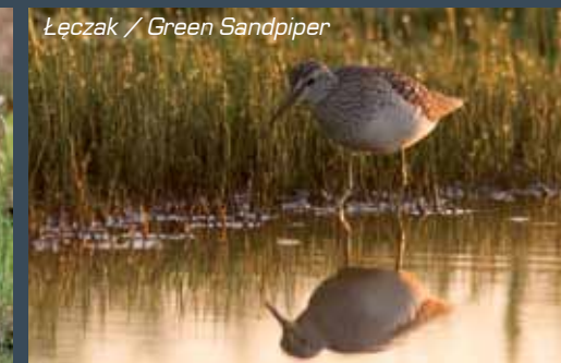
Łęczak / Green Sandpiper