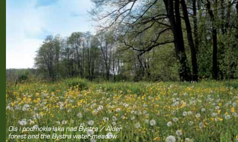
Ols i podmokła łąka nad Bystrą / Alder forest and the Bystra water-meadow

The two above mentioned communities are located in the Bystra river valley – an immensely picturesque river which flows rapidly through a varied river bed in Wąwolnica area. The Bystra is almost a mountain river and it is no surprise for the anglers to find the trout here. The water-meadows by the Bystra river are important and for years they have been habitat for the breeding couples of corncrakes. On summer evenings and nights one may hear their characteristic calls. Poor forest cover of Wąwolnica and Nałęczów makes the area not frequented by typical big forest animals. The mammals are represented only by deer, foxes, boars and hares. Also the representatives of the avifauna are specific for open areas, e.g. a numerous population of the pheasant. In the fields one may trace partridges and quails and the hunting species are buzzards, kestrels and harriers. The communities are poorly forested but it does not mean that there are no interesting tree stands. In Nałęczów we encounter numerous natural monuments such as ginkgo biloba, Pedunculate oak and small-leaved lime.