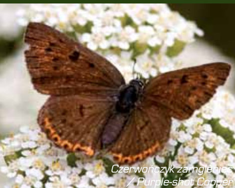
Czerwończyk zamglony / Purple-shot Copper