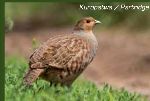
Kuropatwa / Partridge