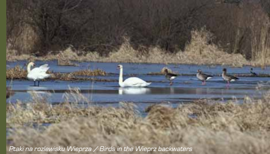
Ptaki na rozlewisku Wieprza / Birds in the Wieprz backwaters

In the community of Żyrzyn it is worth to visit the naturally abundant Wieprz river areas included in the Special Areas of Conservation 'The Lower Wieprz'. There are 8 different types of natural habitats such as old river bed, xerothermic grassland, flooded muddy river banks, riverside herbs, lowland marsh-, sedge meadow-, moss meadow-type alkaline fen, willow, poplar, alder, ash forests. This area is habitat for numerous plant species, including the only site of in Poland. In the Wieprz and its surroundings there are 6 animal species protected by European Union's law – fish (asp and eel), amphibians (fire-bellied toad), reptiles (European pond turtle) and mammals (European beaver and otter). Due to these values this area is protected in the form of 'The Wieprz ice-marginal valley' Landscape Protection Area.