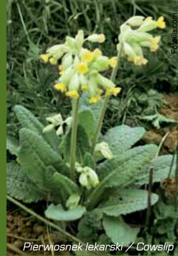
Pierwiosnek lekarski / Cowslip