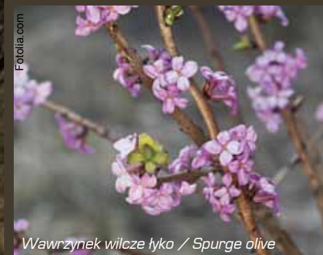
Wawrzynnik wilcze hyko / Spurge olive