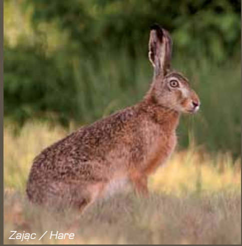
Zając / Hare