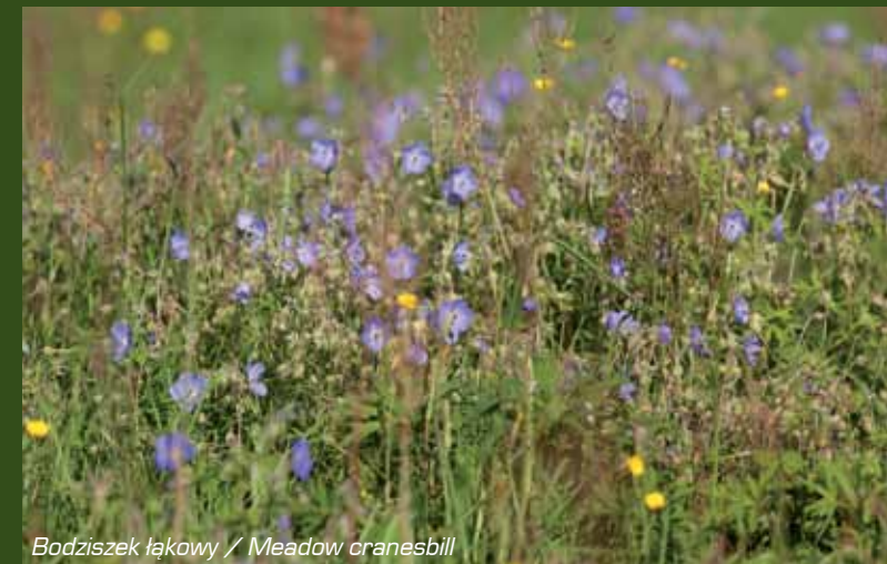
Bodziszek łąkowy / Meadow cranesbill