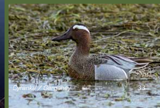
Cyranka / Garganey