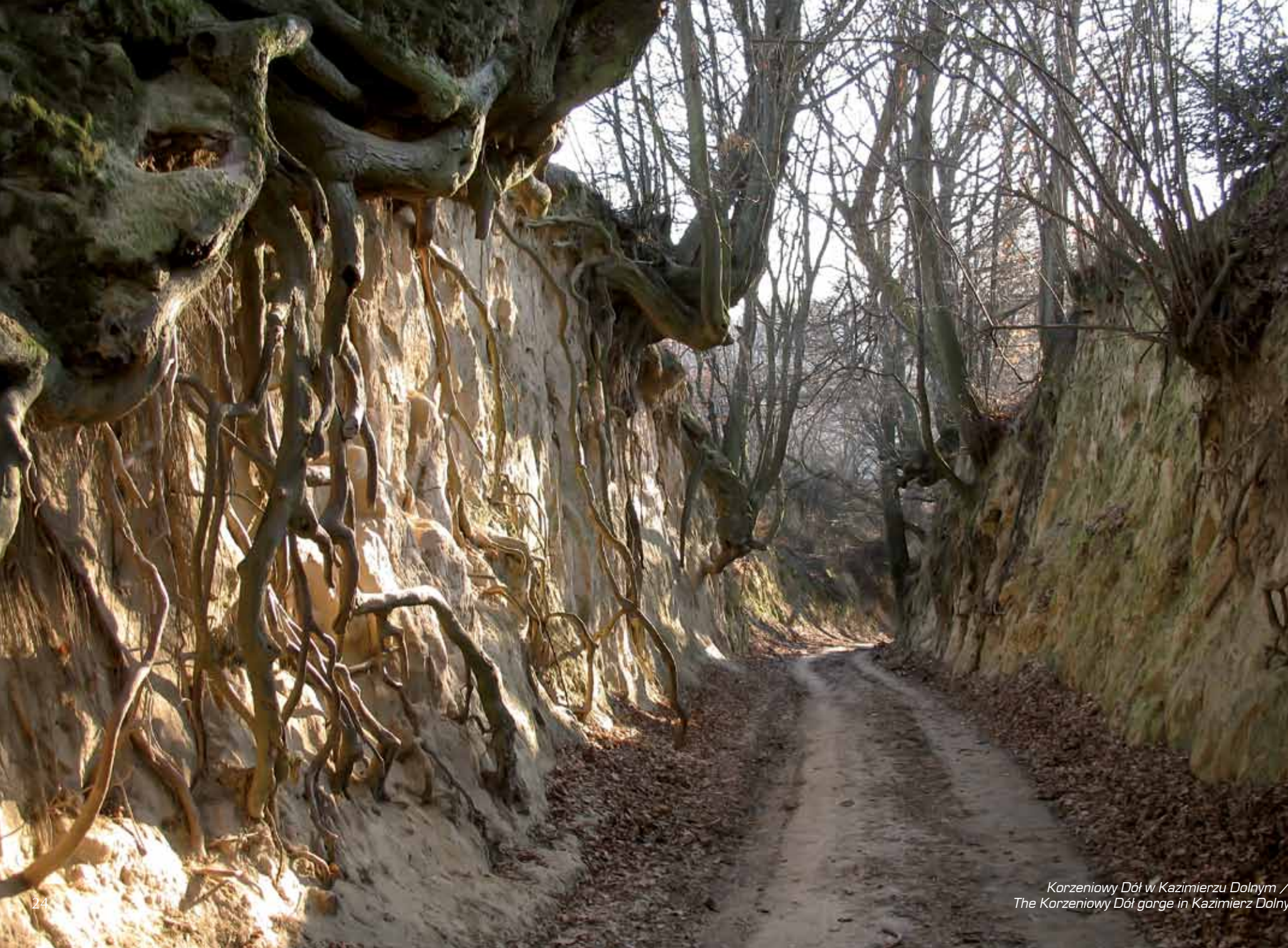
Korzeniowy Dół w Kazimierzu Dolnym / The Korzeniowy Dół gorge in Kazimierz Dolny