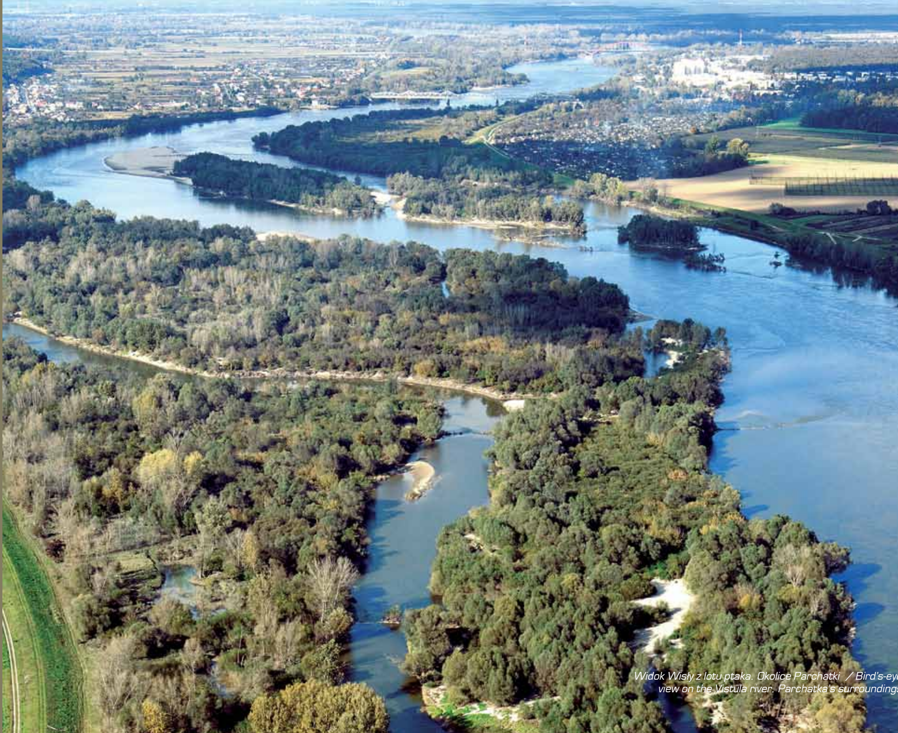
Widok Wisły z lotu ptaka. Okolice Parchatki / Bird's-eye view on the Vistula river. Parchatka's surroundings