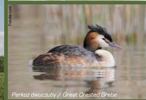
Perkoz dwuczuby / Great Crested Grebe