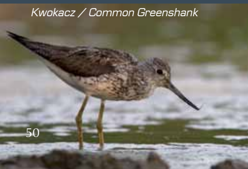
Kwokacz / Common Greenshank

Projekt i realizacja folderu: Agencja Focus, Puławy agencjafocus@o2.pl, afocuspulawy@gmail.com Konsultacje: Andrzej Wenerski Tekst: Grzegorz Sierocki Opracowanie graficzne: Aneta Krzywicka Nakład: 5000 szt. Na okładce: Meandry rzeki Wieprz / On the cover: Meanders of the Wieprz river