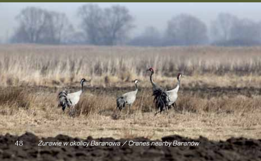
48 Żurawie w okolicy Baranowa / Cranes nearby Baranów

Wieprz jest także głównym elementem krajobrazu najbardziej na północny-wschód wysuniętej gminy powiatu – Baranowa. Trzecia część gminy położona jest na terenie Obszaru Chronionego Krajobrazu Pradolina Wieprza. Tereny nadwieprzańskie na terenie gminy to arcyważny szlak migracyjny ptaków. Od wczesnej wiosny na zalewowych łąkach i polach obserwować można wielotysięczne stada gęsi – gęgaw, białoczelnych i zbożowych oraz kaczek – głównie krzyżówek, rożeńców i świstunów, a także łabędzi – niemych, krzykliwych i czarnodziobych. Tereny te ze względu na ilość ptaków nazywane są czasem „małą Biebrzą”. W miarę rozwoju wiosny pojawiają się brodziec, w tym charakterystyczne bataliony, dostojne rycyki, krwawodzioby. Już od pierwszych wiosennych dni przyjeżdżają tu ornitolodzy w poszukiwaniu ptasich osobliwości. Po okresie wędrówek na łąkach nadal tętni życie za sprawą perkozów, derkaczy, remizów, pustulek, łabędzi niemych, błotniaków, a także: wydr i bobrów oraz żółwi błotnych. Dolina Wieprza to także miejsce żerowania bielika i żurawi. Podmokłe łąki dają również schronienie niezliczonej ilości owadów z barwnymi motylami na czele.