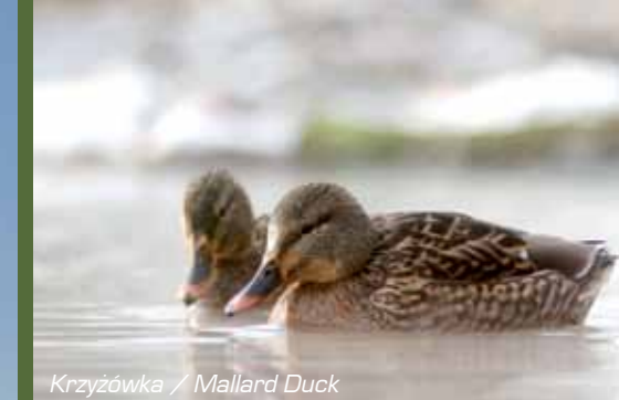
Krzyżówka / Mallard Duck