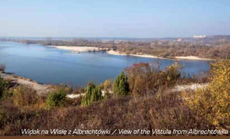
Widok na Wisłę z Albrechtówki / View of the Vistula from Albrechtówka