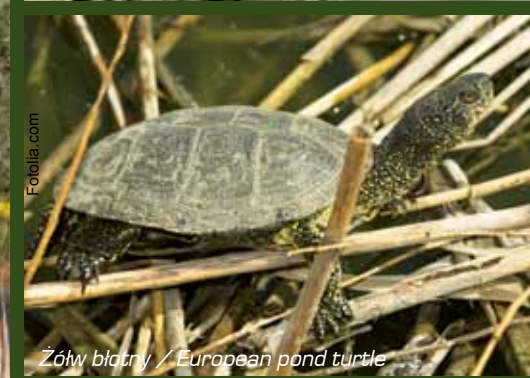
Żółw błotny / European pond turtle