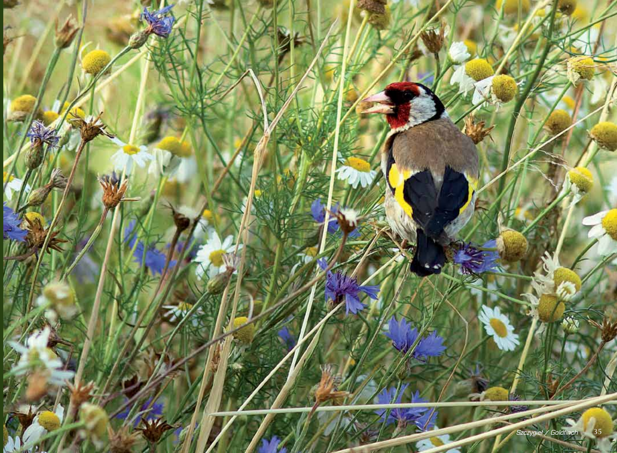
Szczygieł / Goldfinch