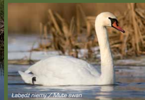
Łabędź niemy / Mute swan