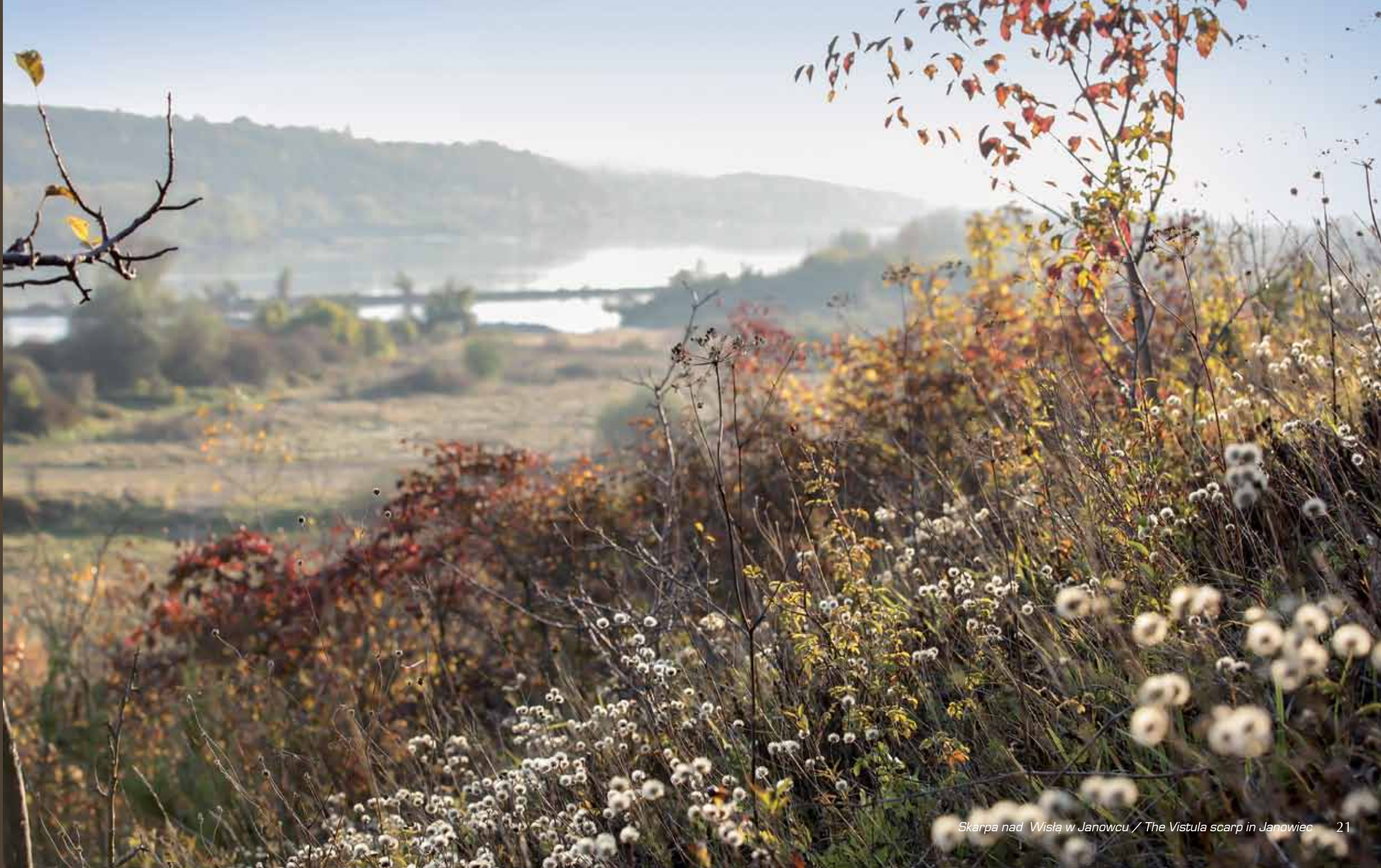
Skarpa nad Wisłą w Janowcu / The Vistula scarp in Janowiec