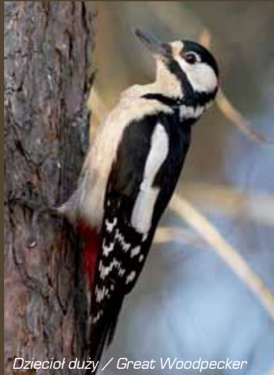
Dzięcioł duży / Great Woodpecker