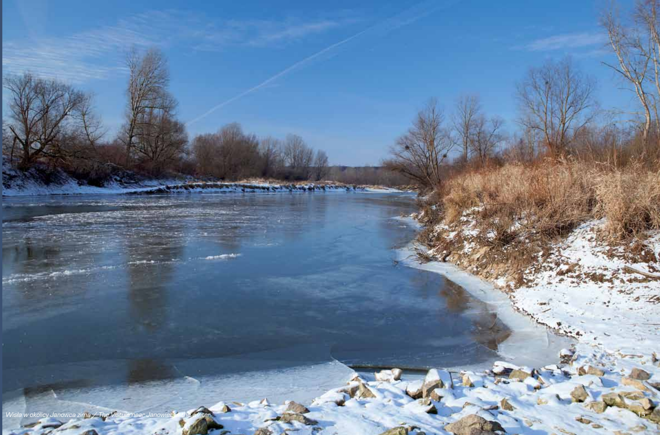
Wisła w okolicy Janowca zimą / The Vistula near Janowiec in the winter