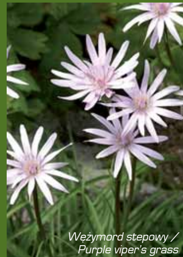
Wężymord stepowy / Purple viper's grass