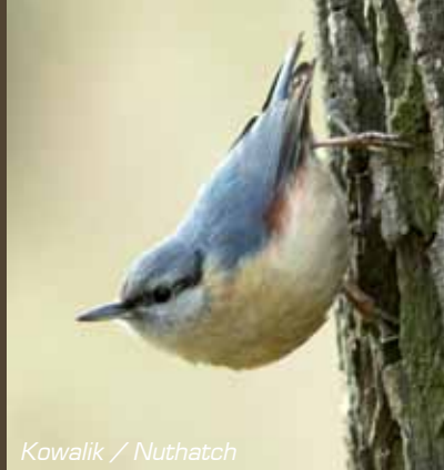
Kowalik / Nuthatch