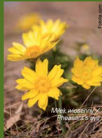
Miłek wiosenny / Pheasant's eye

The Vistula river surrounding is environmentally differentiated. Depending on the site the riverbanks are overgrown with grass, thicket, shrubs or trees. If the valley slopes are facing south we deal with xero-thermic grass of steppe vegetation. One of the floral rarities is swordleaf Inula. In the spring we find protected plant species such as snowdrop anemone, pheasant's eye, upright clematis, cowslip or European dwarf cherry. Among grass we encounter the strictly protected needle grass and purple viper's grass, whose specific trait is its intense vanilla scent.