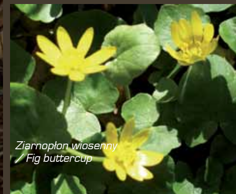
Ziarnopłon wiosenny / Fig buttercup