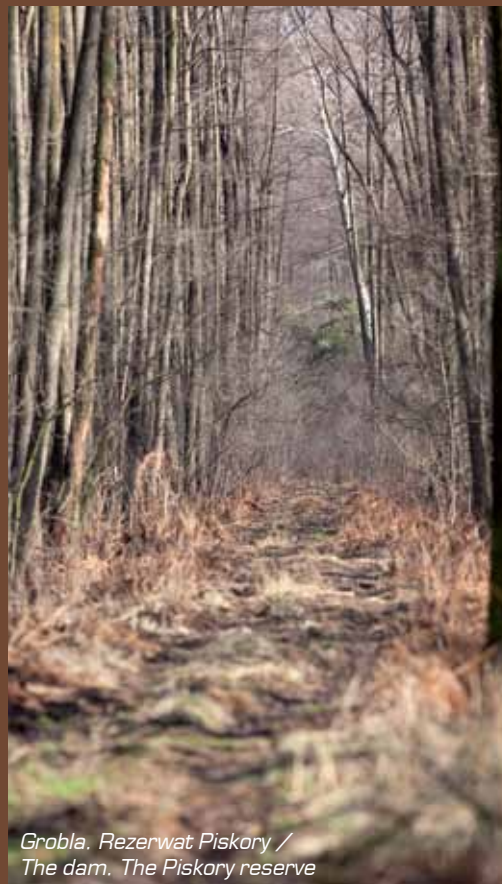
Grobla. Rezerwat Piskory / The dam. The Piskory reserve

In the neighbourhood of the Piskory Lake, situated in the ice-marginal valley of the Wieprz river, there are three interesting lakes – remains of the former Vistula river flow. These are: the Matygi, the Nury and the Borowiec lakes. Fascinating plant species are characteristic for these reservoirs. Especially in the Nury lake one may find a curious fern – floating fern. Moreover there is yellow water lily, common frogbit, water aloe, as well as lesser and star duckweed. The tit finds a nesting place in the lakeside zone of reed and scrub, building its characteristic hangings nests. On the other hand in the Matygi lake one may find the European pond turtle.