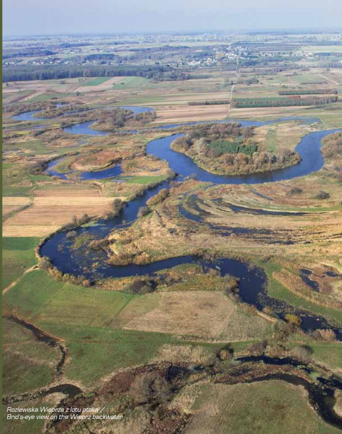
Rozlewiska Wieprza z lotu ptaka / Bird's-eye view on the Wieprz backwater