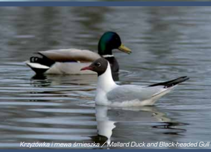
Krzyżówka i mewa śmieszka / Mallard Duck and Black-headed Gull