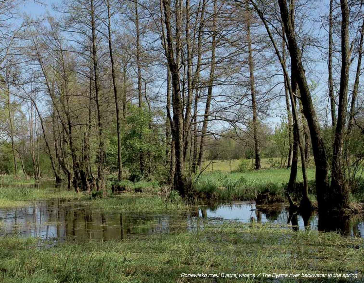
Rozlewisko rzeki Bystrej wiosną / The Bystra river backwater in the spring