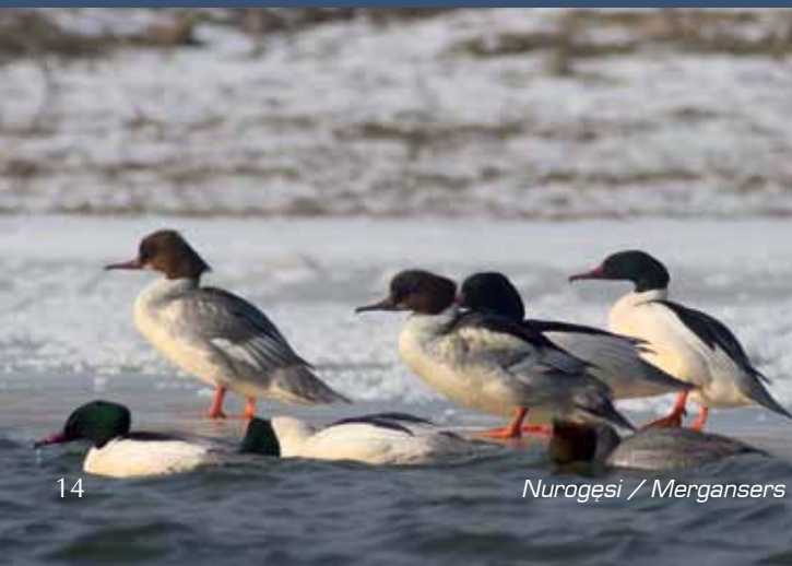
Nurogęsi / Mergansers