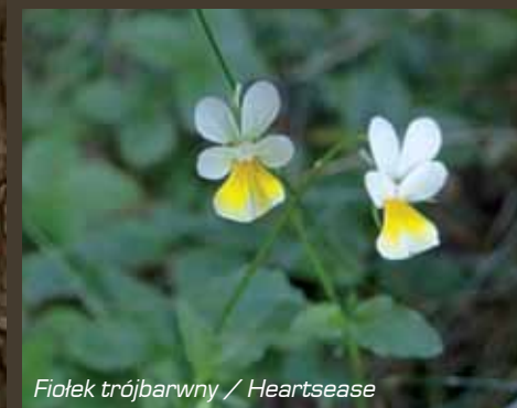
Fiolka trójbarwna / Heartsease