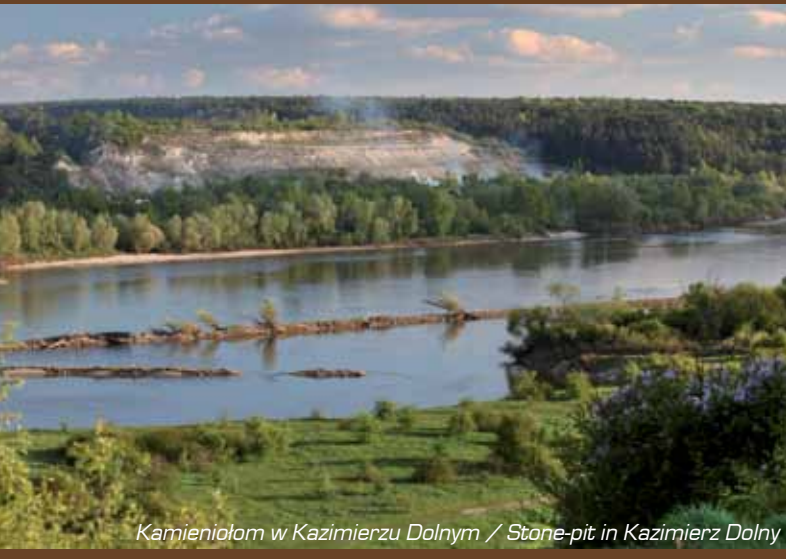
Kamieniołom w Kazimierzu Dolnym / Stone-pit in Kazimierz Dolny