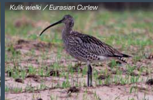
Kulik wielki / Eurasian Curlew