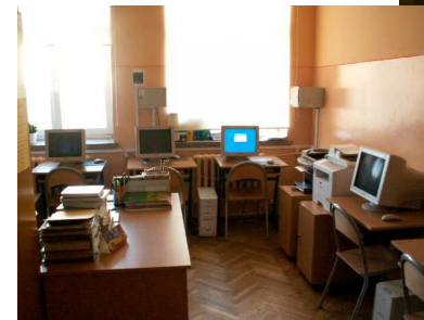
Foto: Centrum multimedialne w bibliotece szkolnej

W celu zabezpieczenia majątku znajdującego się w budynkach szkolnych wykonana została instalacja alarmowa. Ponadto wykonano szereg remontów i ulepszeń w tych placówkach i tak: