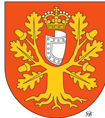
◀Foto: Herb gminy