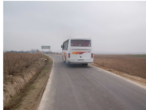
Foto: Nowa droga w Woli Trzydnickiej