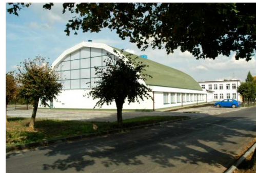
Foto: Hala sportowa w Trzydniku Dużym

Uzyskany efekt to budynek hali (patrz zdjęcie)