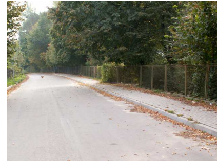
Foto: Modernizowana droga w Rzeczycy Ziemiańskiej k/szkoły