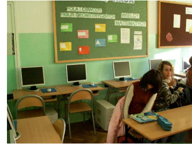
Foto: Nowa pracownia informatyczna