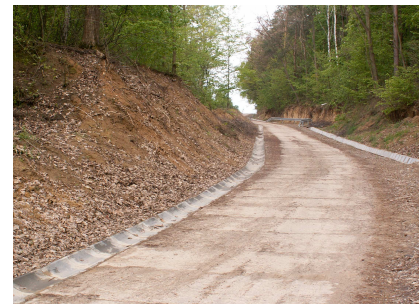
Foto: Odbudowana droga w Łychowie Gościeradowskim k/szkoły.