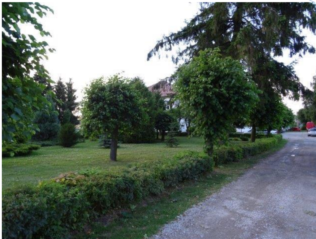
Fot.2 Szkoła Podstawowa w Łuszczowie Drugim - otoczenie.