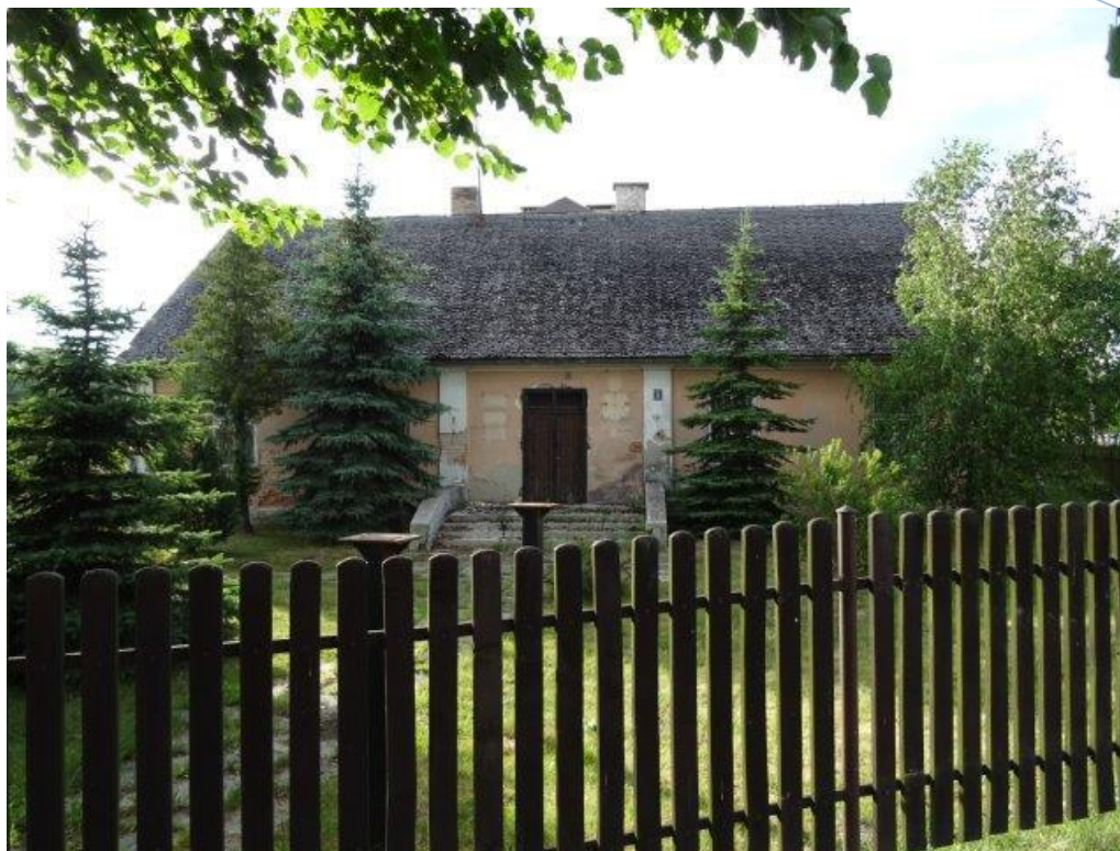
Fot.8 Jakubowice Murowane – stary budynek UG.