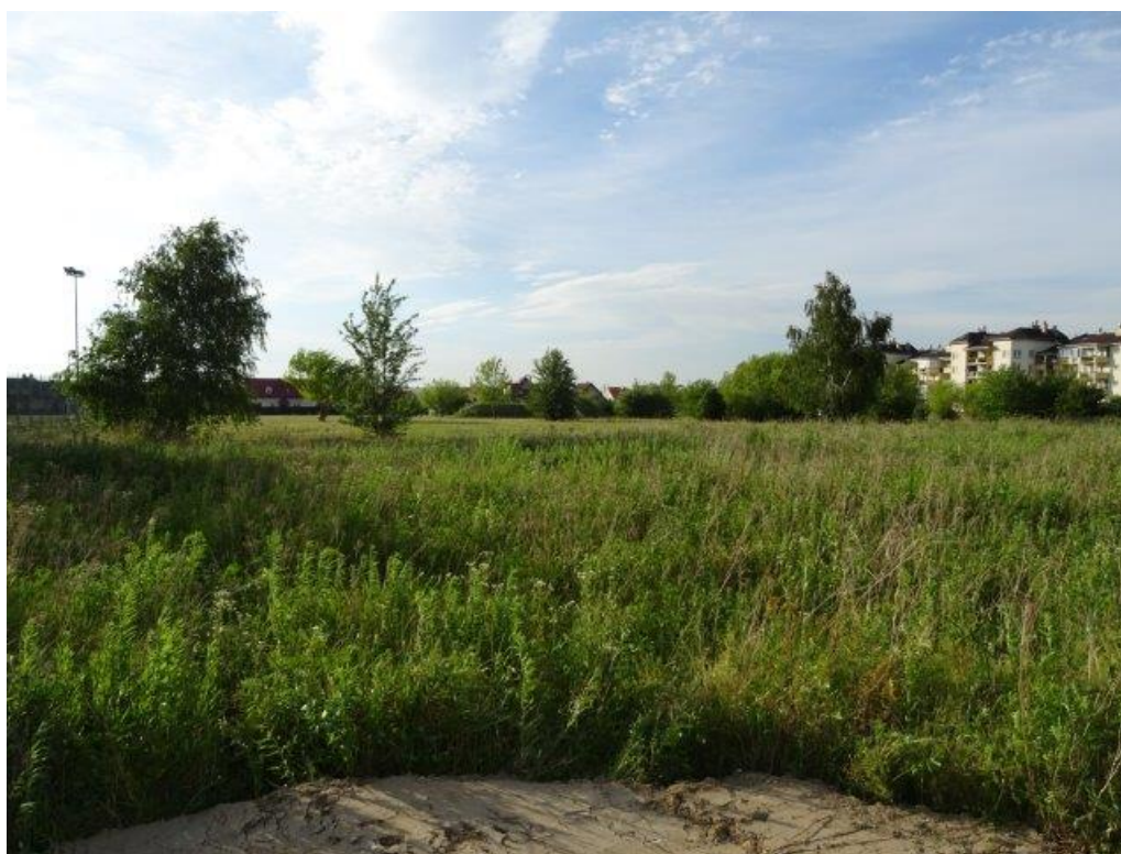
Fot.5 Os. Borek "Orlik" – otoczenie.