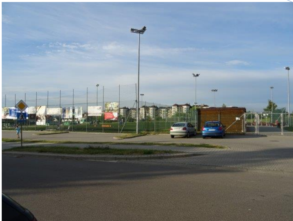
Fot.4 Os. Borek "Orlik".