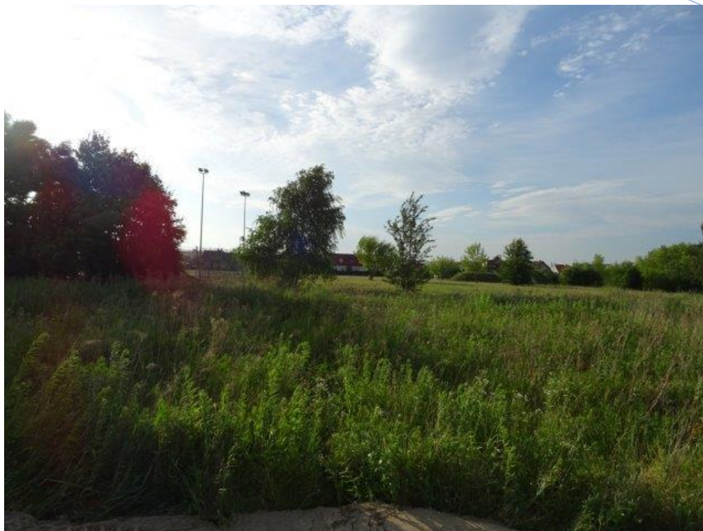
Fot.6 Os. Borek "Orlik" – otoczenie.