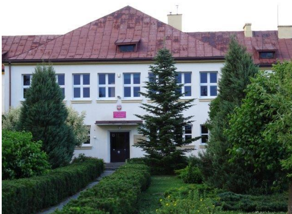
Fot.1 Szkoła Podstawowa w Łuszczowie Drugim.

29 czerwca przeprowadzono wizję lokalną obiektów i przestrzeni w poszczególnych lokalizacjach.