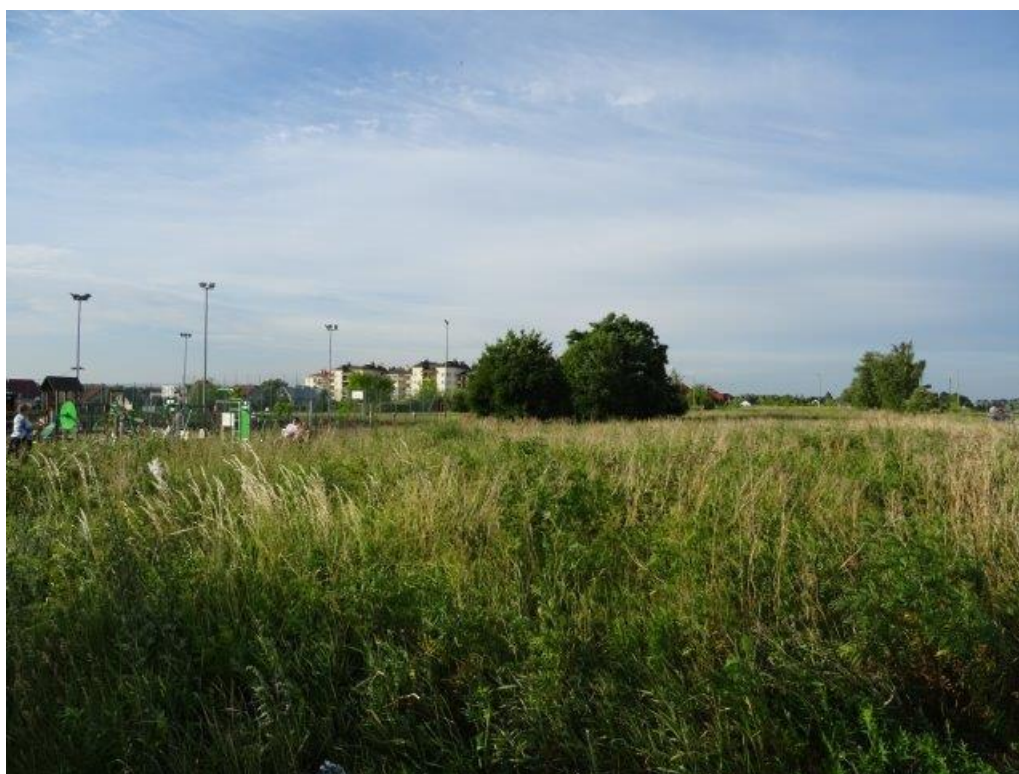
Fot.7 Os. Borek "Orlik" – otoczenie.