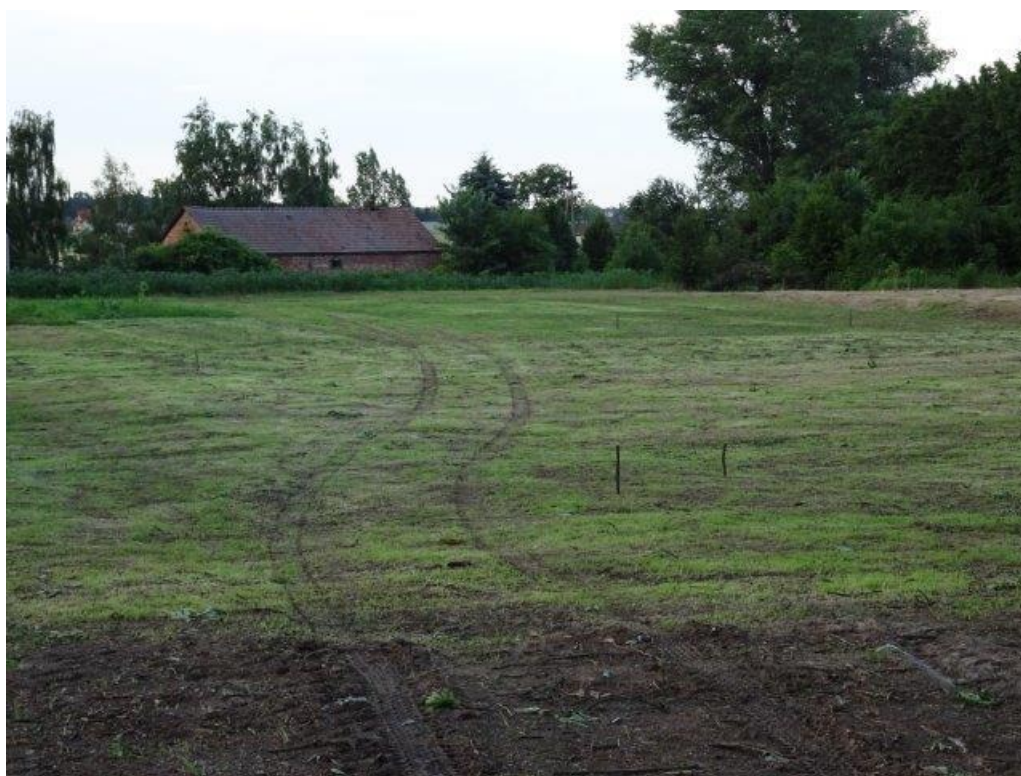
Fot.3 Szkoła Podstawowa w Łuszczowie Drugim - otoczenie.