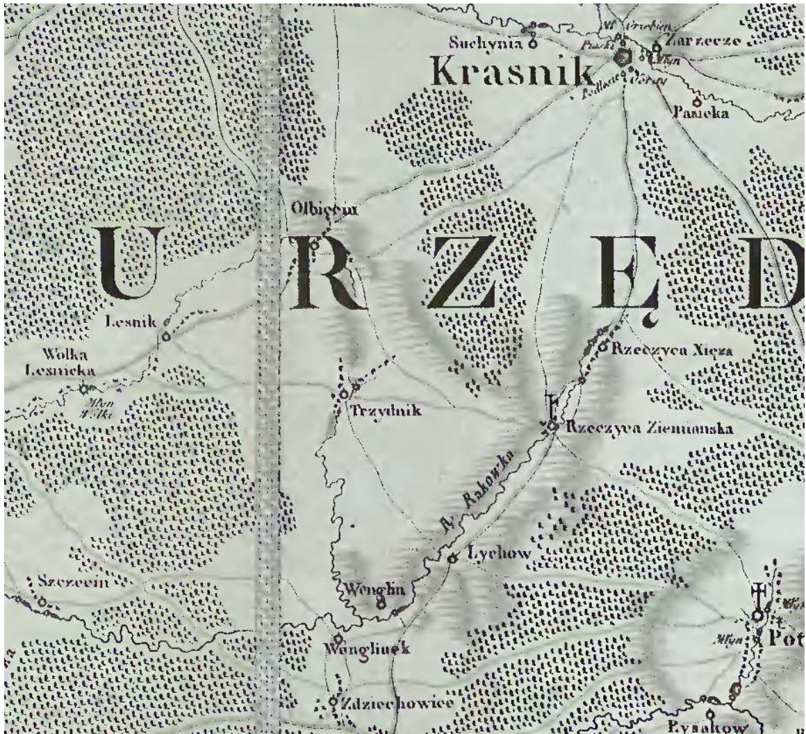
Fragment mapy Karola de Pertheesa (Mappa szczególna województwa lubelskiego, Warszawa 1786).

Jak wspomniano wyżej w XIV i XV wieku ustalił się zarys sieci osadniczej w rejonie Trzydnika. W następnych wiekach niewiele się zmieniło. Rzeszyca już w średniowieczu rozpadła się na dwie miejscowości, ten podział się utrwalił. Jediną nową miejscowością widoczną na powyższej mapie jest Węglin powstały dopiero w XVIII wieku 24 .