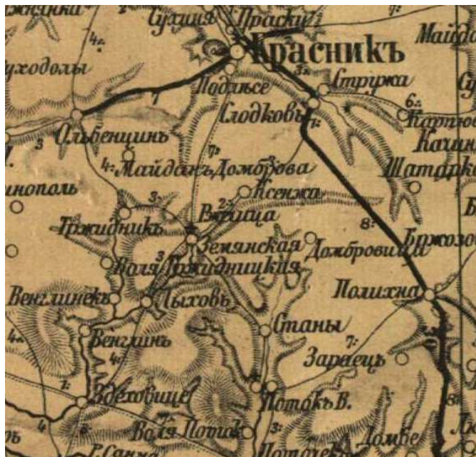
Fragment rosyjskiej mapy z przełomu XIX i XX wieku

Pasieka, Rzeczyca [Księża], Rzeczyca Ziemiańska, Trzydnik Wielki i Mały, Węglin, Węglinek, Wola Trzydnicka oraz Wólka Trzydnicka, Wólka Olbięcka 56 . Jak widać obszar tej dawnej gminy niemal dokładnie pokrywa się z granicami współczesnej gminy. Wspólnota samorządowa (administracyjna) powstała w tamtym okresie przetrwała aż do 1954 roku. Niestety akta gminy Trzydnik z okresu zaborów nie zachowały się do naszych czasów.