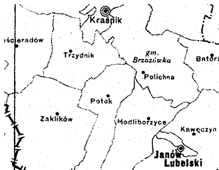
Fragment mapy administracyjnej z 1938 roku

W latach 1933-1934 ujednolicono ustrój samorządu lokalnego w całym kraju. Według nowej ustawy gminnej o częściowej zmianie ustroju samorządu terytorialnego 76 z 23 marca 1933 roku funkcje uchwałodawcze przejęła całkowicie rada gminna, zlikwidowano zebranie gminne. Wyboru radnych dokonywało kolegium złożone z delegatów rad gromadzkich, sołtysów i podsołtysów wszystkich gromad. Istniał cenzus wieku przy prawie wyborczym czynnym – 25 lat (wcześniej 21) i w prawie wyborczym biernym wynoszący 30 lat. W gminach do 5 000 mieszkańców radnych było 12. Kadencja radnych wynosiła 5 lat. W gromadach organem uchwałodawczym było zebranie gromadzkie. Zbierało się pod przewodnictwem sołtysa lub jego zastępcy (podsołtysa). Podejmowało uchwały dotyczące danej gromady (np. kwestie majątkowe), wybierało sołtysa i jego zastępcę na 3-letnie kadencje. Wybrani musieli mieć ukończone 30 lat. Zebranie gromadzkie wybierało radnych gromadzkich w liczbie od 12 do 30. Organem wykonawczym gromady był sołtys oraz jego zastępca. Wybory zatwierdzał starosta powiatowy. Do sołtysa należało kierowanie sprawami gromady, zarządzanie majątkiem, reprezentowanie gromady na zewnątrz. Przewodniczył on także zebraniom. Należały do niego również sprawy bezpieczeństwa, porządku publicznego, przestrzegania przepisów, doręczania pism sądowych, wykonywania obowiązków związanych z poborem wojskowym.