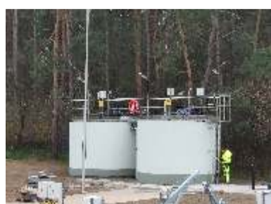
INWESTYCJE 2020 - str. 5