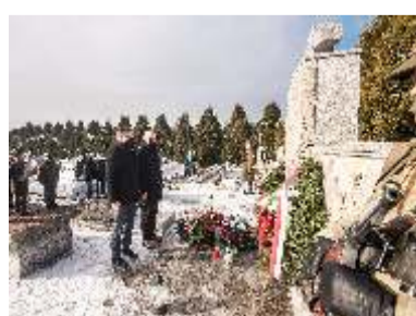
77 ROCZNICA PACYFIKACJI BOROWA I OKOLIC - str. 7