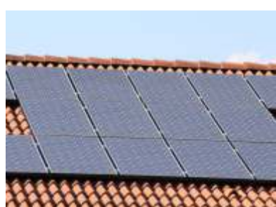
OZE W GMINIE ANNOPOL - str. 2