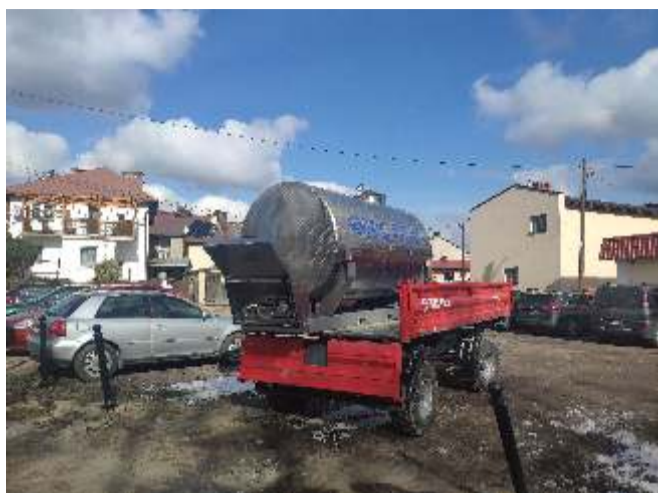
Zakup cysterny do transportu wody pitnej - koszt 40 467,00 zł