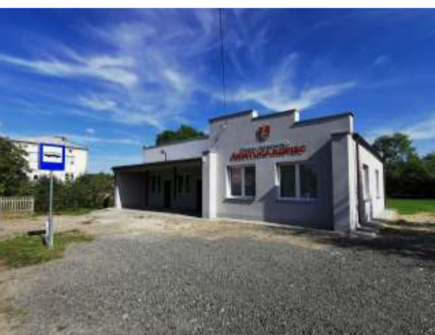
Modernizacja świetlicy w Kopcu koszt ok. 50 000,00 zł