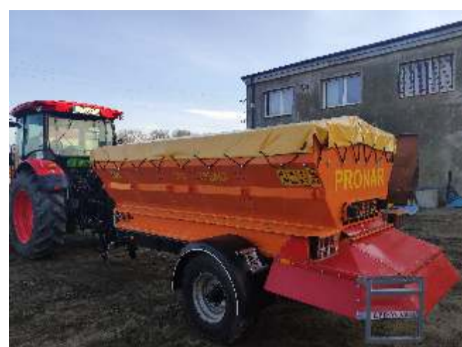
Zakup posypywarki do zimowego posypywania dróg piaskiem i solą - koszt 45 510,00 zł