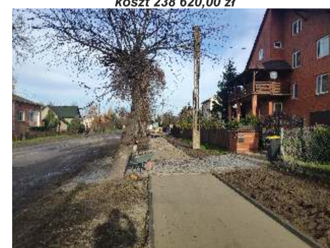
Budowa chodnika przy drodze wojewódzkiej w Świeciechowie Dużym koszt 238 620,00 zł