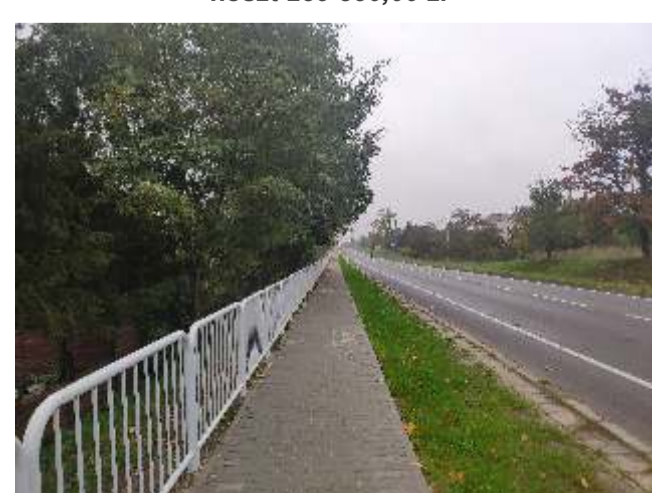
Remont chodnika na ul. Puławskiej w Annopolu koszt 239 850,00 zł