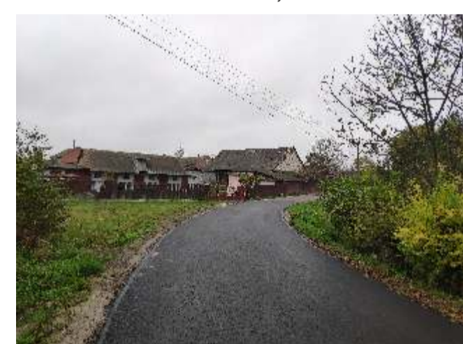
Modernizacja drogi gminnej w Opoce Dużej koszt 34 995,35 zł