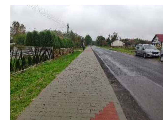
Budowa chodnika w Opoce Dużej koszt 150 807,31 zł