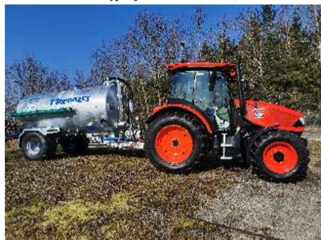
Zakup nowego ciągnika rolniczego oraz beczki asenizacyjnej - koszt 202 581,00 zł