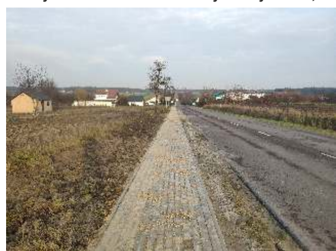
Budowa chodnika przy drodze powiatowej w Nowym Rachowie wkład własny Gminy 25 387,90 zł