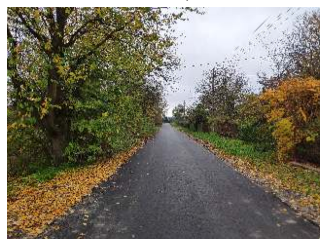
Modernizacja drogi gminnej w Suchoj Wólce koszt 21 235,95 zł