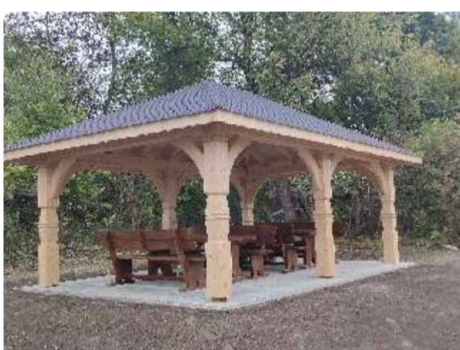
Budowa altany w Jakubowicach koszt 20 072,50 zł