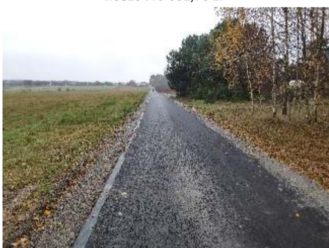
Modernizacja drogi gminnej Huta - Dąbrowa - koszt 110 682,78 zł