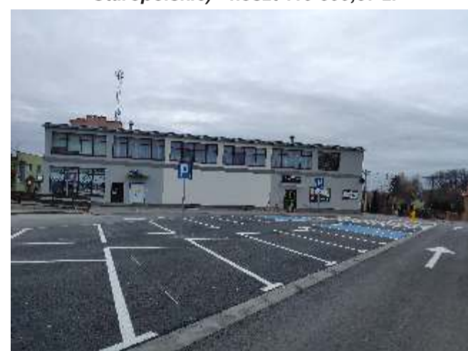
Wykonanie nakładki asfaltowej (Delikatesy Staropolskie) - koszt 119 899,37 zł