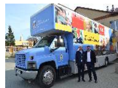
BADANIA USG DLA DZIECI W ANNOPOLU - str. 8