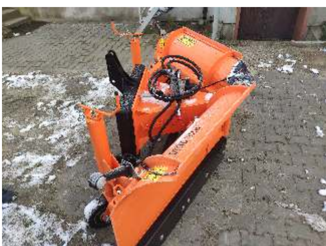
Plug odśnieżny - koszt 15 129,00 zł