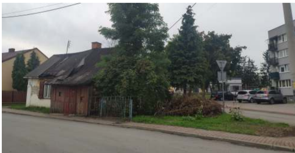
Wygląd działki przed zakupem

jej zakupu. Zakup działki pozwoli na usunięcie zdewastowanych budynków, uporządkowanie terenu i poprawę estetyki osiedla.