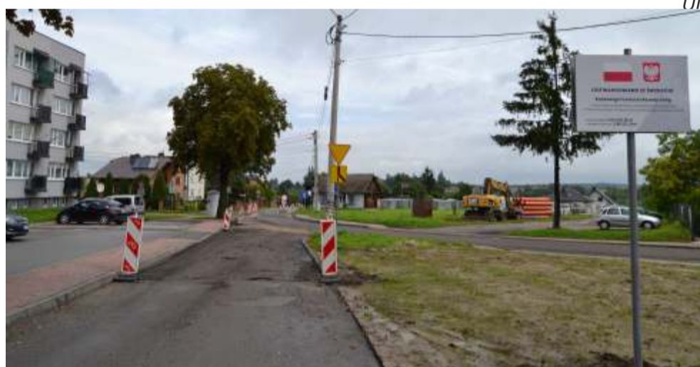
Wygląd działki po zakupie przez Gminę