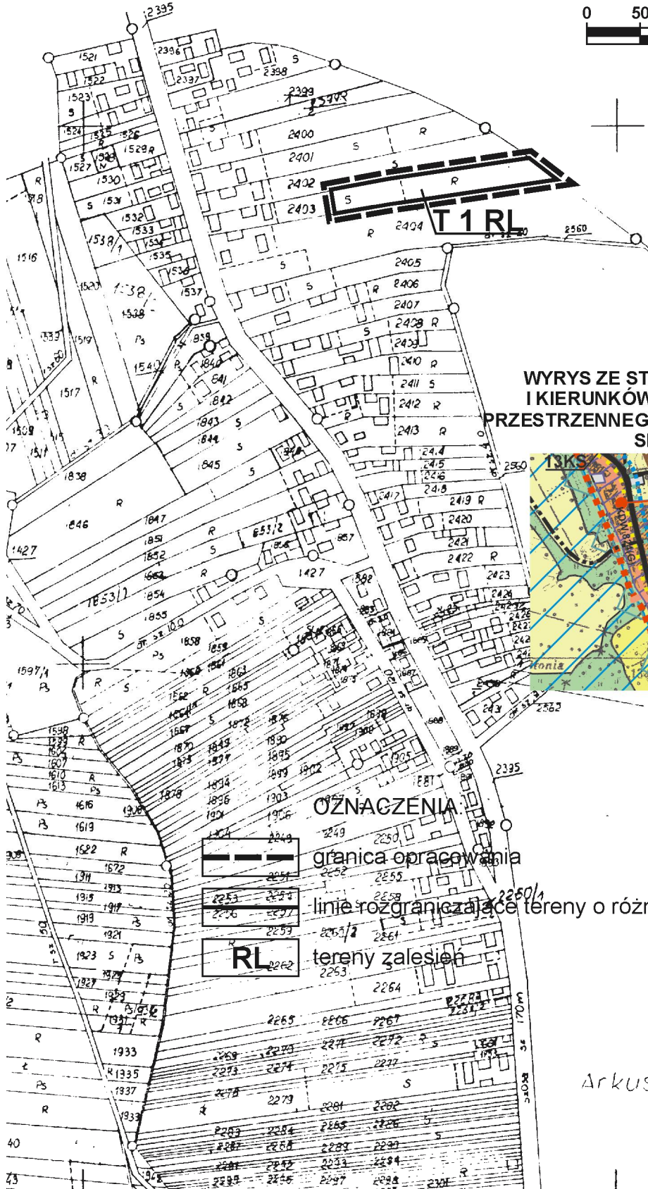
WYRYS ZE STUDIUM UWARUNKOWAŃ I KIERUNKÓW ZAGOSPODAROWANIA PRZESTRZENNEGO MIASTA I GMINY ANNOPOL Skala 1:25 000