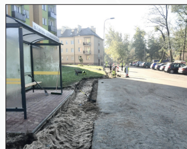
Modernizacja chodnika w os. Lotnisko ul. Ścibiora