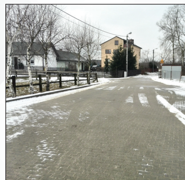
Ul. Wiejska po modernizacji