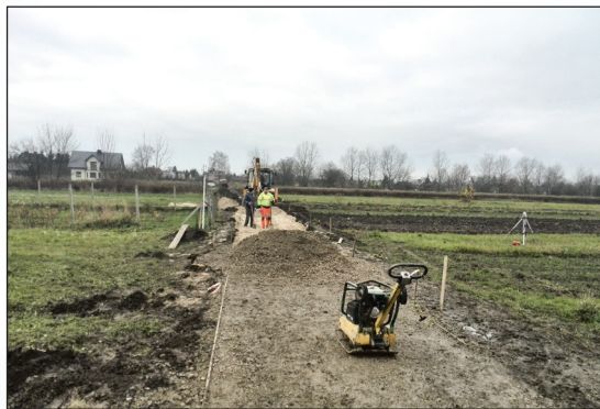
Utwardzenie nawierzchni ul. Asnyka od ul. Ogrodowej w kierunku ul. Jagiellońskiej - os. Mierzwiańska