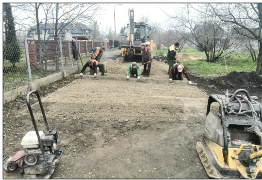
Poprawa nawierzchni ul. Okrzei i ul. Słonecznej - os. Michalinów