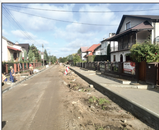
Przebudowa dróg w osiedlu Jagiellońskim