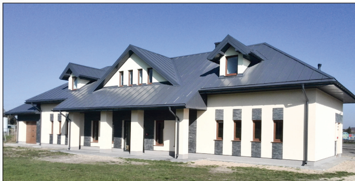
Budynek sanitarno-szatniowy przy stadionie miejskim - etap końcowy

Miasto Dęblin przystąpiło też w 2017 roku do realizacji zadania „Przebudowa dróg w Osiedlu Jagiellońskie”. Pierwszy etap polega na przebudowie i budowie sieci ulic Modrzewskiego, Długosza i Jagiełły, a także na wykonaniu chodników w tych ulicach, zjazdów do posesji, wykonaniu placów nawrotowych, oznakowania ulicznego, budowę kanalizacji deszczowej wraz z pompownią wód deszczo-