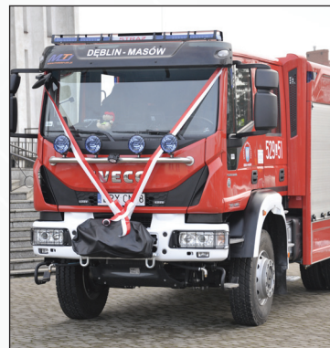
Nowy samochód ratowniczo gaśniczy OSP Masów