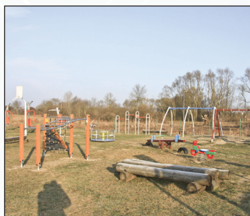
Montaż siłowni plenerowej i wyposażenie placu zabaw w os. Żdźary