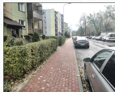
Modernizacja chodnika w os. Lotnisko ul. Ścibiora - prace ukończone