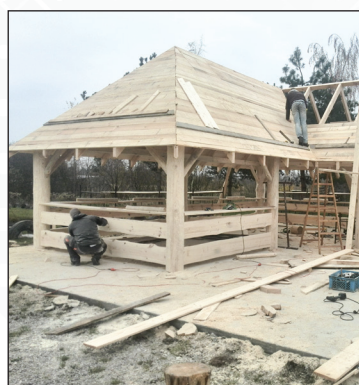
Zakup i montaż wiaty w os. Jagiellońskim

Trzeba dodać, że dzięki współpracy Miasta z innymi jednostkami organizacyjnymi np. z Ośrodkiem