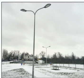
Instalacja dodatkowych lamp oświetlenia ulicznego na os. Wiślana w rejonie placu zabaw