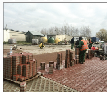
Wykonanie zatok placów postojowych w os. Wiślana