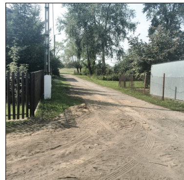
Ul. Wiejska przed modernizacją

W ubiegłym roku zakończone zostało też zadanie pn. „Wykonanie zatok i placów postojowych na Osiedlu Wiślana” w rejonie zespołu boisk sportowych, zespołu garaży i bloku przy ul. Stężycka 52 za kwotę 181 000 zł.