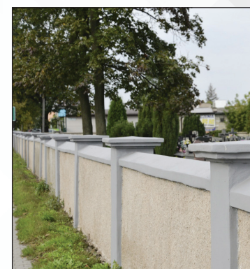
Cmentarz komunalny - remont ogrodzenia - po