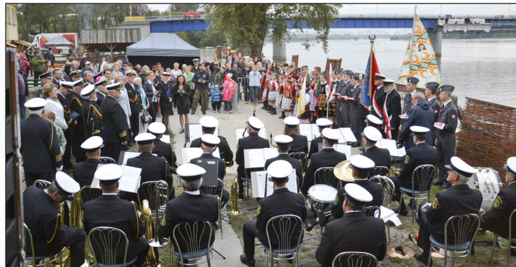
Europejskie Dni Dziedzictwa

Mam nadzieję, że przez te 3 lata podjęłam wszechstronne kierunki działania dla rozwoju naszego miasta i wykorzystałam dużo możliwości ubiegania się o środki zewnętrzne, a także dałam szansę innym podmiotom, aby z udziałem mienia gminy realizowały cele społecznie pożyteczne na użytek naszych mieszkańców. Łącznie pozyskaliśmy przez te trzy lata kwotę około 40 milionów zł.