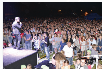
Dni Dęblina 2017