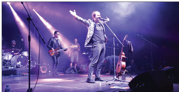
Dni Dęblina 2017