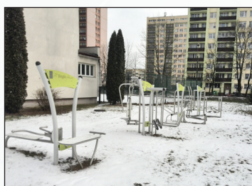
Montaż siłowni plenerowej w os. Lotnisko