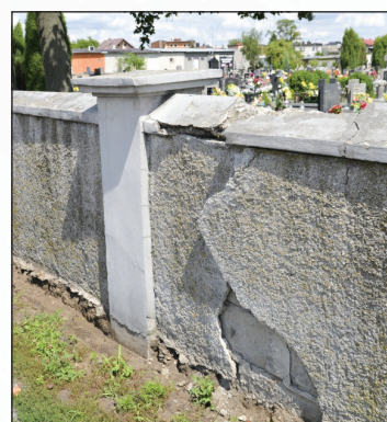
Cmentarz komunalny - remont ogrodzenia - przed