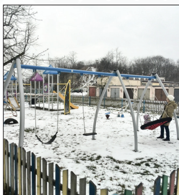
Montaż placu zabaw w os. 15 P.P. „Wilków”

W 2017 roku wykonaliśmy też utwardzenia nawierzchni ul. Asnyka od ul. Ogrodowej w kierunku ul. Jagiellońskiej w Osiedlu Mierzwiańska, a także poprawę nawierzchni ul. Okrzei i ul. Słonecznej w Osiedlu Michalinów. Ponieważ na ul. Okrzei i ul. Słonecznej miasto planuje w ciągu 2 lat rozpoczęcie robót związanych z budową kanalizacji sanitarnej i wodociągowej, co doprowadzi do zrujnowania wykonanego utwardzenia ulic, zaproponowałam, aby w 2017 roku pieniądze z tego zadania przeznaczyć na dalsze projektowanie i budowę kanalizacji sanitarnej w Osiedlu Michalinów, zaś drogi poprawiać lub budować w następnej kolejności. Pomimo, iż pomysł mój uzyskał akceptację mieszkańców tego osiedla, radni z Klubu Razem dla Dęblina wraz z radną z tego okręgu nie zgodzili się na to rozwiązanie.