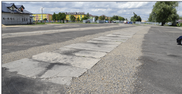
Targowisko miejskie przy ul. 15 Pułku Piechoty „Wilków”

Pomocy Społecznej w Dęblinie oraz Fundacją „Hospicjum-Razem możemy więcej” w przyszłości powstaną miejsca pobytu dla osób starszych. W ramach projektu „Aktywna Jesień” skierowanego do seniorów 60+ zagrożonych ubóstwem lub wykluczeniem społecznym z terenu naszego miasta, OPS w Dęblinie zamierza stworzyć Dom Diennej Pomocy dla Osób Starszych, jak też Mobilny Punkt Opieki. Dzięki tym działaniom seniorzy z terenu miasta Dęblin zostaną objęci specjalistycznym wsparciem i fachową opieką. W DDP dla Osób Starszych, którego siedzibę miasto wskazało w lokalu przy ul. Bankowej (po byłej bibliotece publicznej), przewidziane jest stworzenie miejsca zarówno do odpoczynku jak i rehabilitacji seniorów. W ofercie znajdują się też różne formy spędzania czasu wolnego, wycieczki, zajęcia edukacyjne oraz treningi kompetencji życiowych. Realizacja projektu potrwa do grudnia 2020 r. Mam nadzieję, że pierwsi seniorzy rozpoczną zajęcia w DDP już w maju 2018 r. Przez 3 lata działania projekt obejmie swoim zasięgiem 95 osób. Cały koszt projektu to 1 626 306,38 zł. Dofinansowanie z RPO WL wynosi 1 544 991,06 zł.