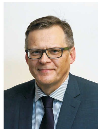
PREZES KASY ROLNICZEGO UBEZPIECZENIA SPOŁECZNEGO