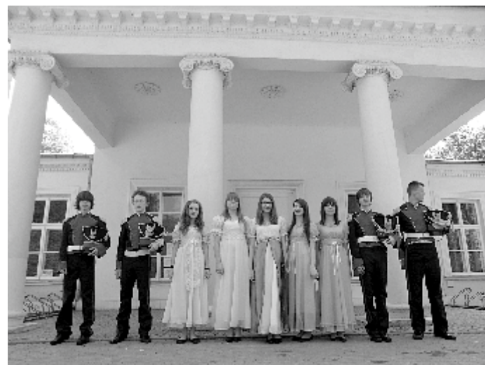
3 Maja - młodzież w strojach z epoki z PG w Garbowie

ucz. kl. IIIa Publicznego Gimnazjum im. Jana Pawła II w Garbowie