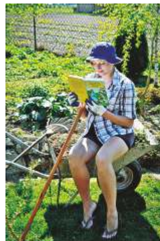
fot. Natalia Kamińska