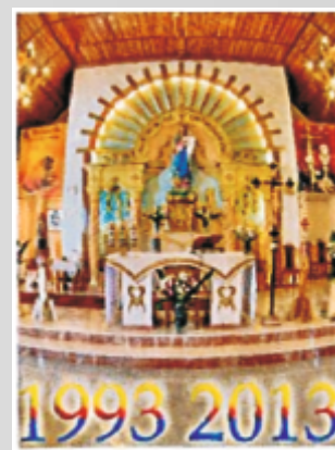
Znaczkı pocztowe wydane z okazji jubileuszu parafii