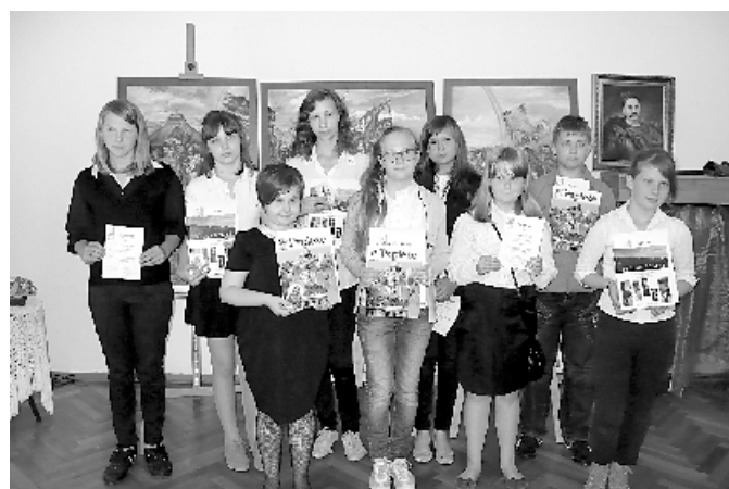
Nagrodzeni uczniowie szkół podstawowych