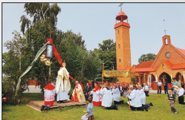
fot. A. Stępiak-Luczywek