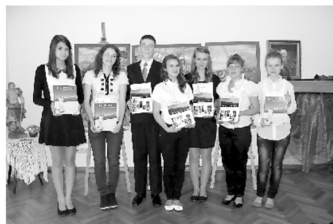
Najlepsi recytatorzy z gimnazjów