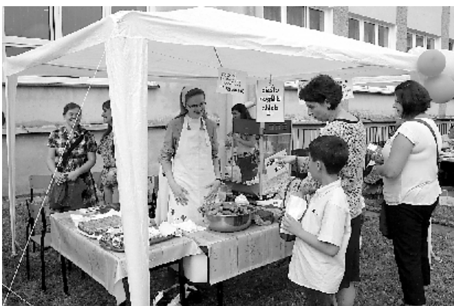
Stoisko sióstr Salezjanek