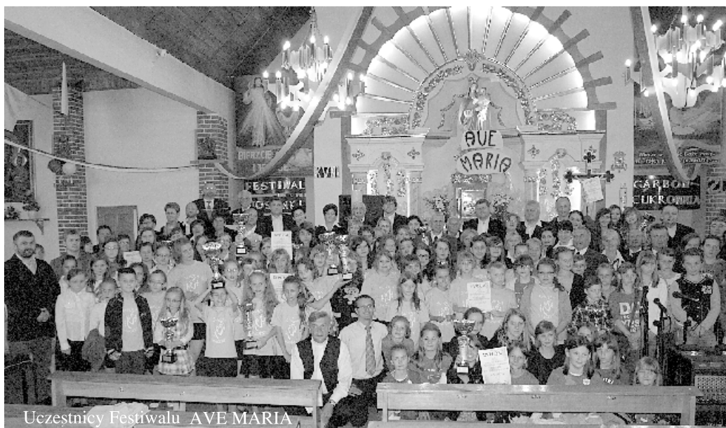
Uczestnicy Festiwalu AVE MARIA