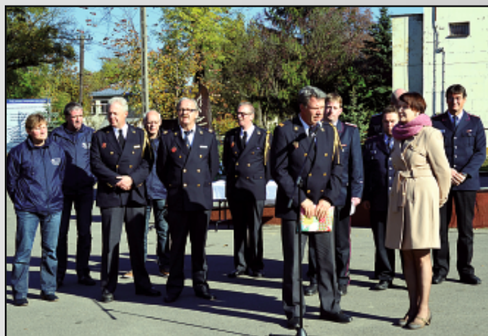
Delegacja strażaków z Niemiec i Holandii