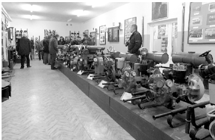
W Muzeum Pożarnictwa w Kraśniku