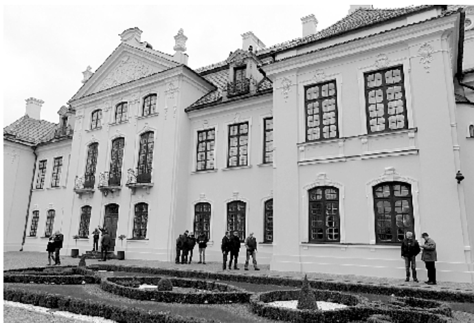
Przed Pałacem w Kozłowie