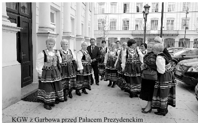
KGW z Garbowa przed Pałacem Prezydenckim

„Pani Anna Komorowska podczas uroczystości podziękowała rolnikom, firmom produkującym żywność i organizacjom rolniczym za współorganizację tegorocznych Dożynek Prezydenckich w Spale. Pierwsza Dama wspominała też swoją wizytę w Spale w przeddzień dożynek, podczas której odbyła się debata publiczna pt. „Kobieta wiejska we współczesnym świecie”, zwiedzanie Miasteczka Regionów, gdzie prezentowali się m.in. twórcy ludowi, czy rozstrzygnięcie konkursu na najładniejszy wieniec dożynkowy o nagrodę prezydenta RP. Dodała, że imprezy te po raz kolejny pokazały, jak dynamicznie zmienia się polska wieś. W spotkaniu w Pałacu Prezydenckim wzięło udział kilkadziesiąt osób, m.in.: starostowie dożynek, przedstawiciele ministerstwa rolnictwa, Agencji Rynku Rolnego, różnych związków branżowych, izb rolniczych, zakładów produkujących żywność, harcerze. Uczestnicy śródownego spotkania otrzymali dyplomy od prezydenta RP.” (PAP)