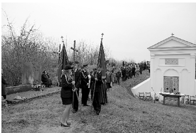
Procesja po Starym Cmentarzu w Zaduszki