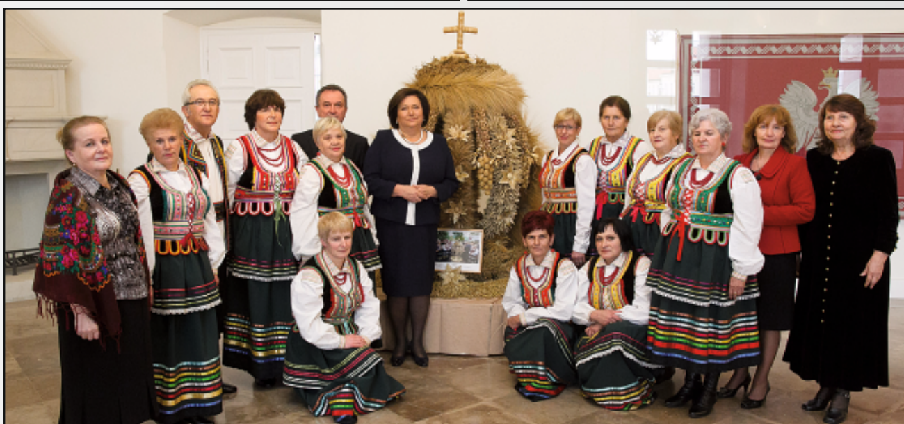
Delegacja z Garbowa z Panią Prezydentową Anną Komorowską