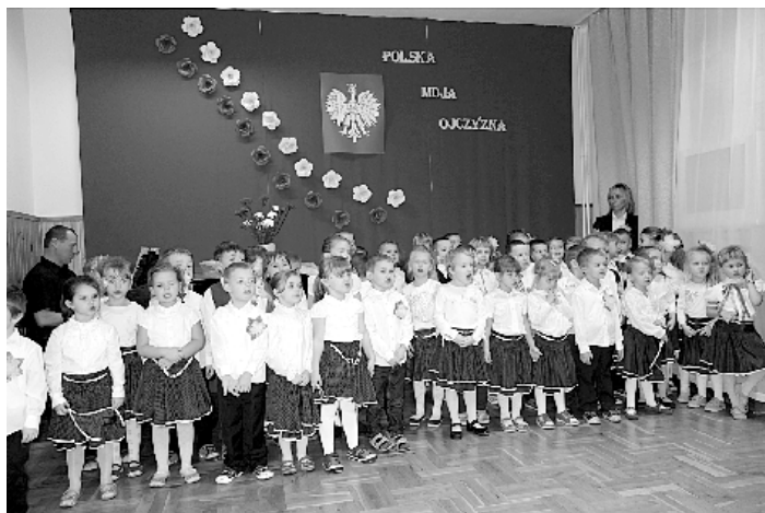
11 listopada – uroczystość w Przedszkolu s. Salezjanek w Garbowie