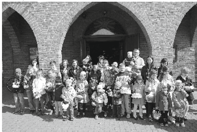
Dzieci ze święconką przed kościołem w Garbowie-Cukrowni

W tym dniu, w kościołach naszych parafii, co godzinę, księża święcili pokarmy, przyniesione przez wiernych w koszykach.