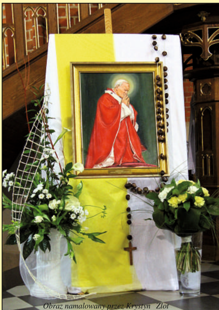
Obraz namalowany przez Krystyn Złot