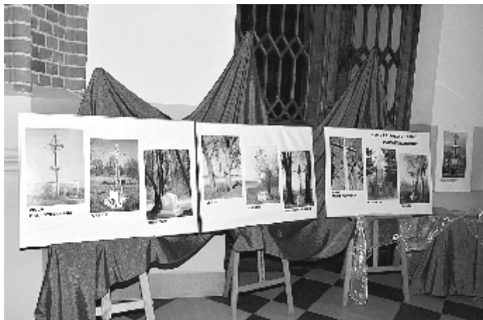
„Krzyże i kapliczki w gminie Garbów” – wystawa w kościele parafialnym.