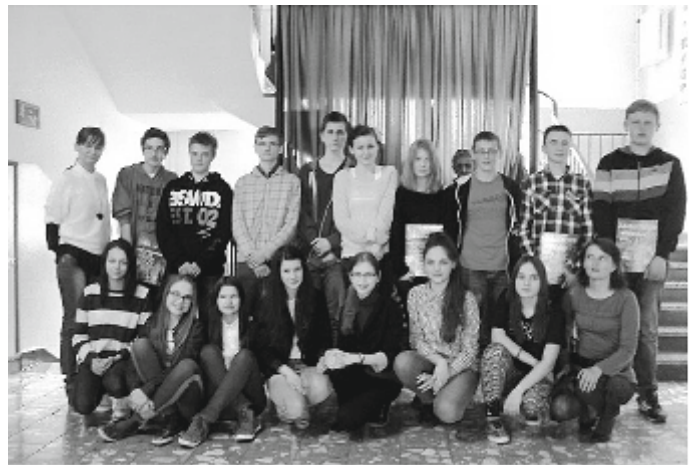
Uczestnicy konkursu wraz z opiekunami

4 kwietnia br. odbyła się III edycja Gminnego Konkursu Fizycznego dla klas II na terenie gminy Garbów. Celem konkursu jest rozwijanie umiejętności z fizyki oraz rozumienie zjawisk zachodzących w naszym życiu codziennym.