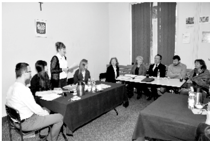
Ostatnia sesja I kadencji Młodzieżowej Rady Gminy Garbów