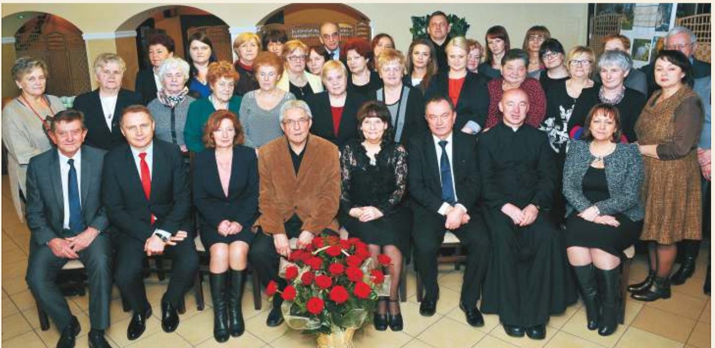
Uczestnicy spotkania jubileuszowego