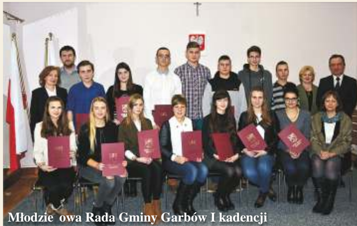
Młodzieżowa Rada Gminy Garbów I kadencji