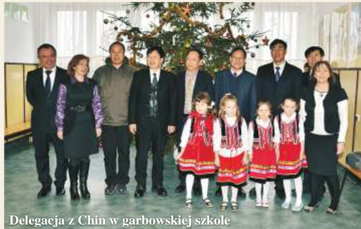
Delegacja z Chin w garbowskiej szkole