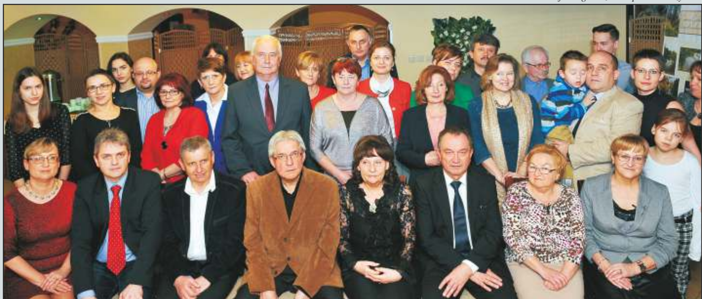
Członkowie i Sympatycy TPZG