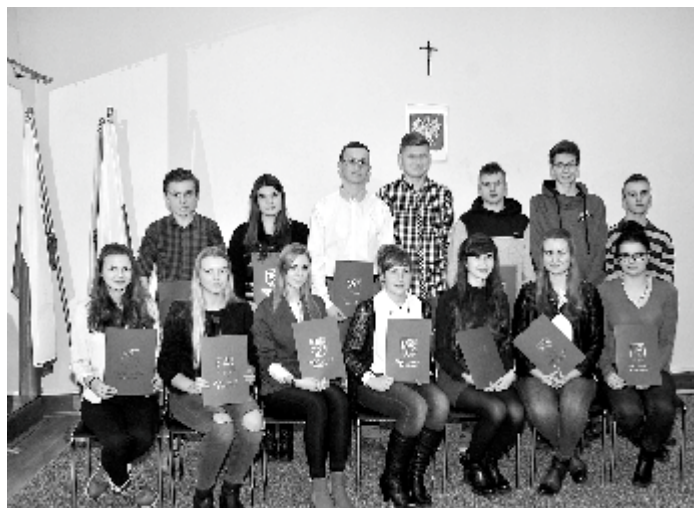
Pamiątkowa fotografia MRG