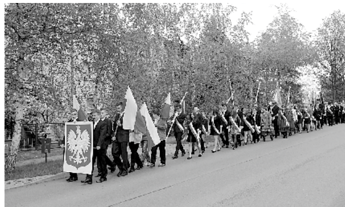
Obchody rocznicy uchwalenia Konstytucji 3 Maja