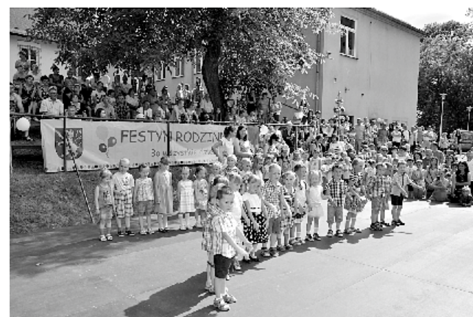
Festyn Rodzinny „Słoneczny Garbów”