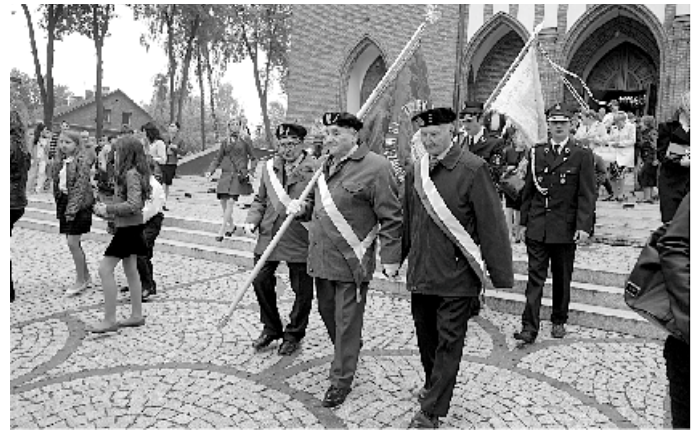
Kombatanci zrzeszeni w Kole ZKRPiBWP

Niestety 2016 rok był ostatnim rokiem działalności Koła Wędkarskiego, które od wielu lat z powodzeniem funkcjonowało, organizując zawody wędkarskie i propagując zdrowy styl życia.