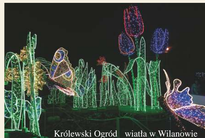
Królewski Ogród wiatła w Wilanowie