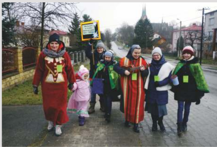
Kol dnicy Misyjni w Garbowie