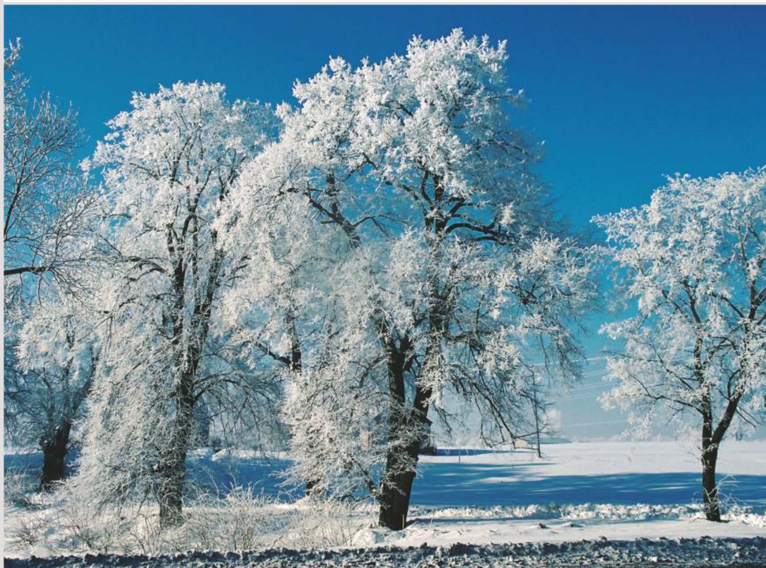
fol. S.M. St pniak