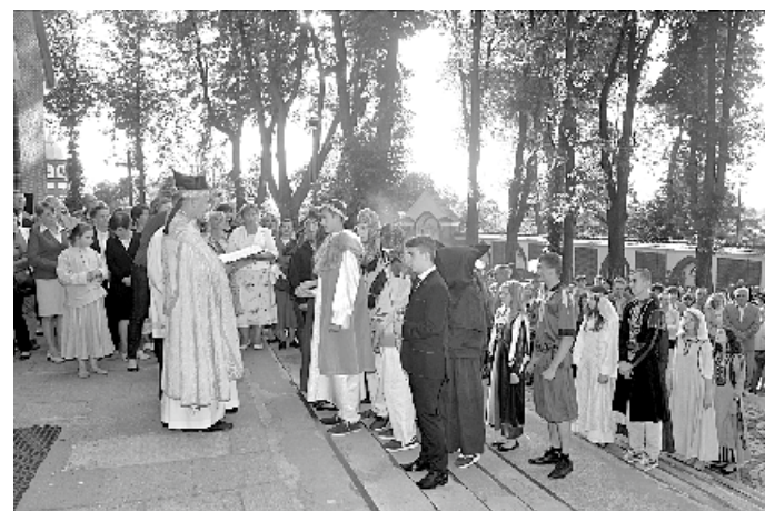
Jubileuszu 1050-lecia Chrztu Polski