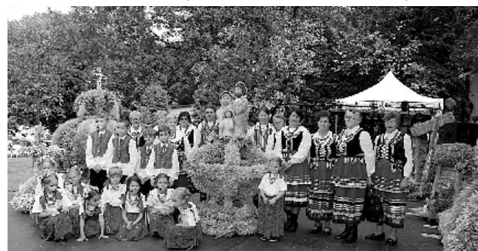
Dożynki Gminno-Parafialne, KGW Bogucin i Dziecięcy Zespół Tańca Ludowego „Bogutki”