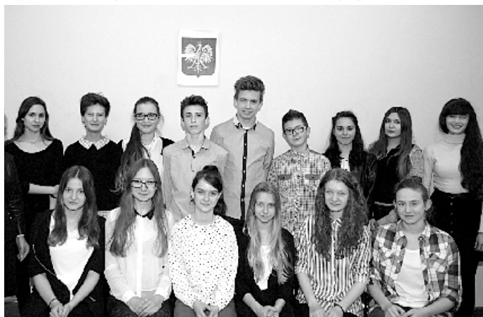
Młodzieżowa Rada Gminy

Święto Szkoły i Dzień Patrona w ZS w Przybysławicach.