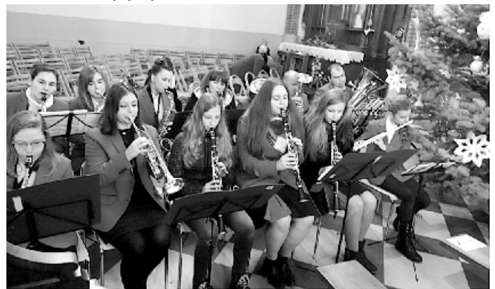
Garbowska Orkiestra Dęta