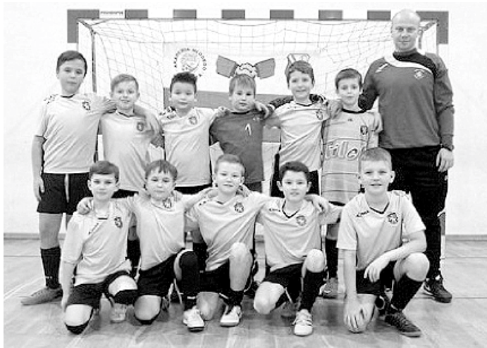
Zespół orlików Zawiszy na turnieju w Wołominie

Aby dotrzeć na turniej, nasi młodzi gracze musieli wyruszyć o 5:30 spod budynku klubowego i pokonać 150 km trasy do podwarszawskiego Wołomina. Po uroczystej inauguracji turnieju, zawodnicy rozpoczęli fazę grupową. Wygraliśmy 3:1 z AMP GOOL II Wołomin, zremisowaliśmy 0:0 z Young Champions Płock i pokonaliśmy 1:0 Legię Soccer Schools.