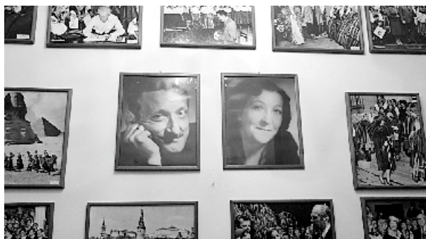
Tadeusz Sygietyński i Mira Zimińska-Sygietyńska – dyr. „Mazowsza”

Trzy dni (od 25 do 27 listopada) trwały Centralne Targi Rolnicze 2016 w Nadarzynie pod Warszawą (organizator Ptak Warsaw Expo). W pierwszy dzień rolniczej imprezy 50-osobowa grupa rolników z gminy Garbów, gminy Niemce i pracowników ZDR w Elizówce pojechała na targi do Nadarzyna. Po ceremonii otwarcia targów, z koncertem specjalnym wystąpił Zespół „Mazowsze”. Na wystawach można było zobaczyć maszyny rolnicze, sprzęt do hodowli, środki do produkcji rolnej, targi dobrej żywności, produkty regionalne. W obiekcie wystawienniczym znajdowała się również ekspozycja zwierząt gospodarskich i ptactwa ozdobnego. Występowały liczne koła gospodyń i zespoły ludowe (m.in. znany nam Zespół Łopienka z Cisnej), które dbały o dobry nastrój zwiedzających.