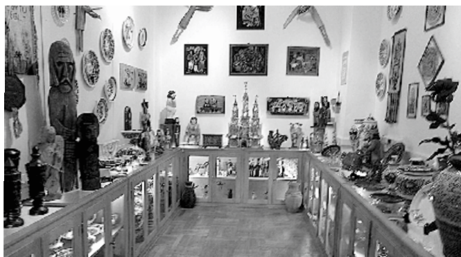
Nagrody i pamiątki przywiezione z występów

Po obejrzeniu wystawy udano się do Otrębusów, aby zwiedzić dwór w Karolinie – siedzibę Państwowego Zespołu Pieśni i Tańca „Mazowsze” im. Tadeusza Sygietyńskiego.