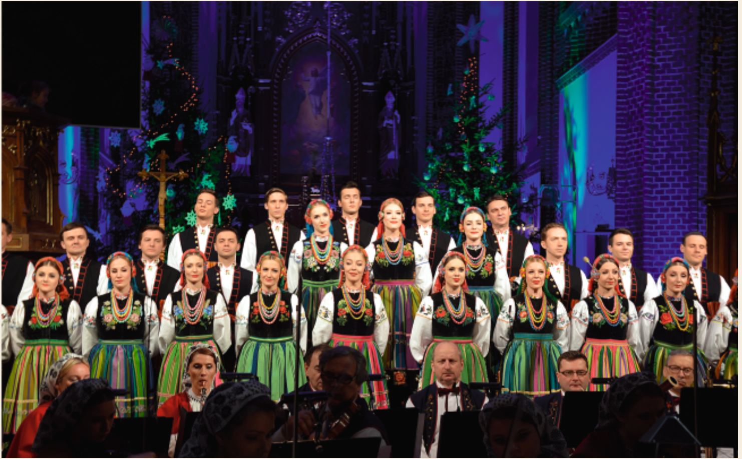
Cudowny wieczór z kolędami i Zespołem „Mazowsze”