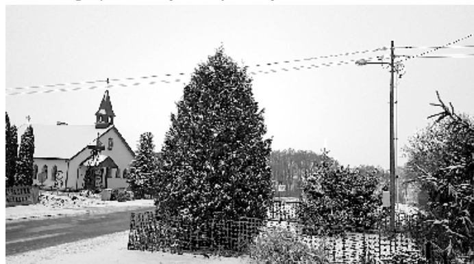
Oświetlenie na drodze powiatowej obok kaplicy w Gutanowie