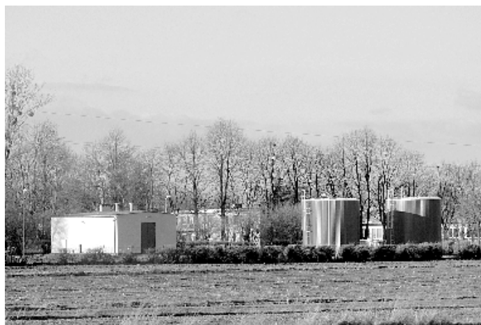
Przebudowa stacji uzdatniania wody w Borkowie