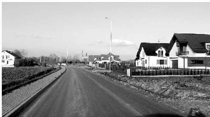
Oświetlenie drogowe przy drodze powiatowej Garbów-Ługów, ul. Słoneczna