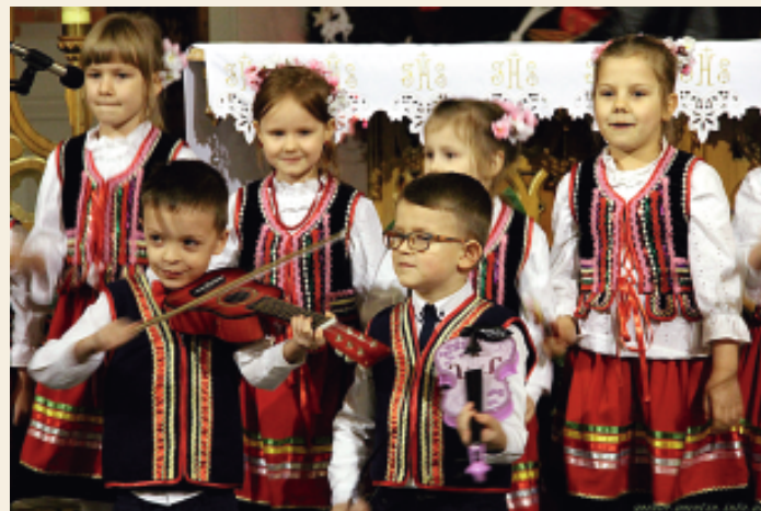
fol. K. Oleszek