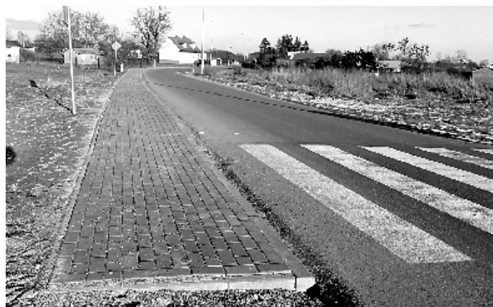
Chodnik przy drodze gminnej w Zagrodach