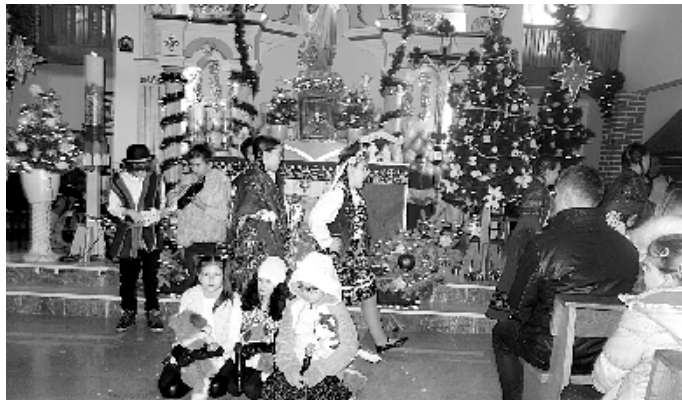
Jasełka pt. „Nie było miejsca...” w wykonaniu uczniów ze SP w Przybysławicach, w kościele w Garbowie-Cukrowni

Legenda głosi, że tradycję wystawiania jasełek zapoczątkował sam św. Franciszek z Asyżu. W Polsce jasełka wystawia się od kilkuset lat. W szkołach na terenie gminy uczniowie pod kierunkiem nauczycieli przygotowali jasełka dla społeczności szkolnej i lokalnej.