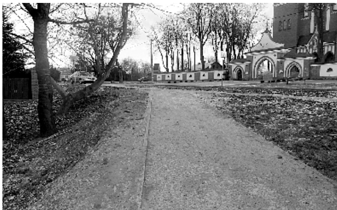
Chodnik w Garbowie, naprzeciw kościoła