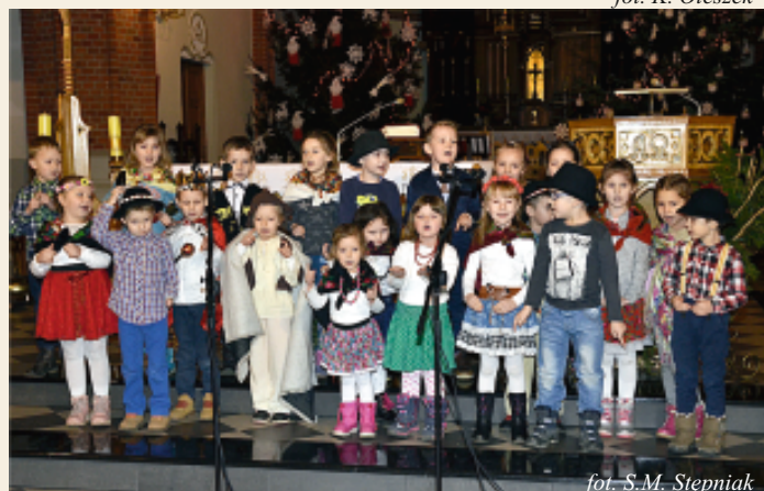
fol. S.M. Stepniak