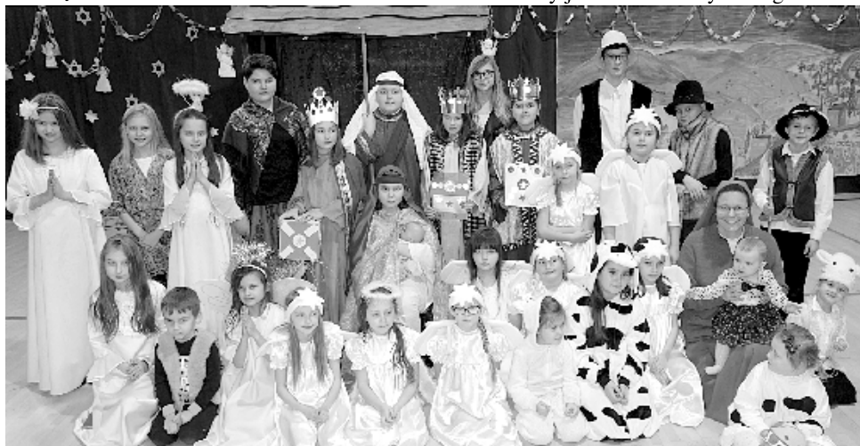
Pamiętkowa fotografia uczestników jasełek w SP w Garbowie