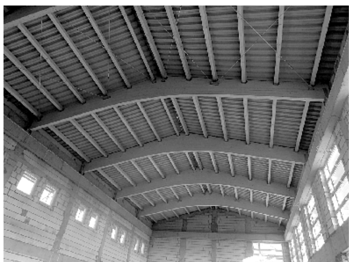
Budowa sali gimnastycznej w Bogucinie