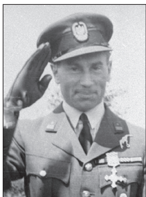
mjr pil. Wojciech Kołaczkowski (1908–2001) dowódca 303 Dywizjonu Myśliwskiego, I i II Skrzydła Myśliwskiego