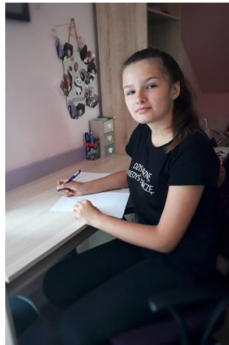
Daria pisze wiersz