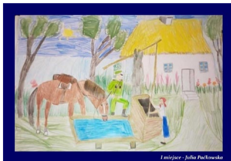
1 miejsce - Julia Paćkowska

Uczestnicy warsztatów „Aktywni i kreatywni” otrzymali za swoje prace wyróżnienie na XVI