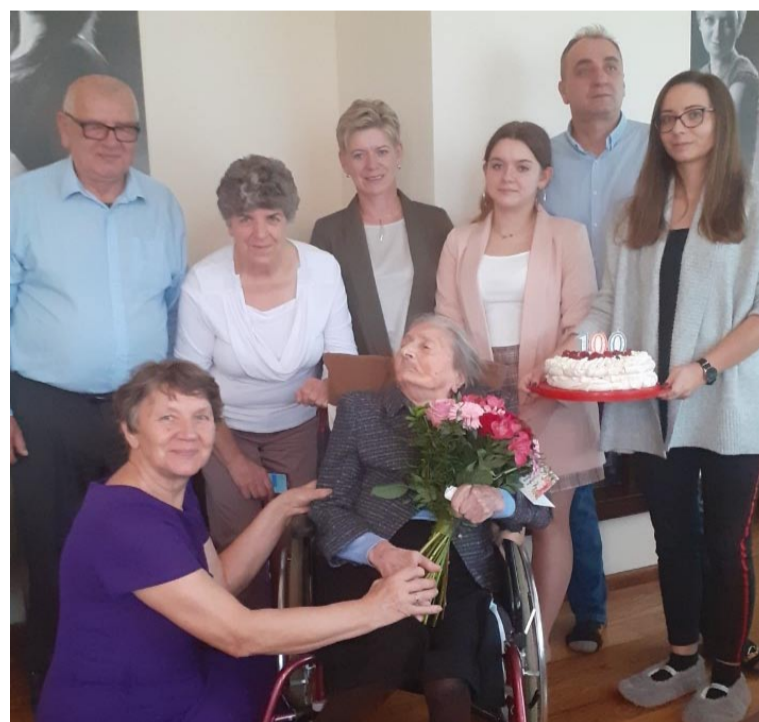
Dostojna Jubilatka w otoczeniu najbliższych