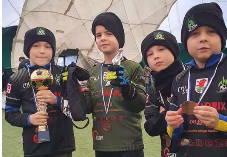
Puchar, medale – i jest uśmiech na twarzy

– Dzieciaki nie miały nigdy okazji trenować i grać pod tzw. balonem. Było to dla nich niesamowite i zapewne niezapomniane doświadczenie, tym bardziej, że do domu wrócili-