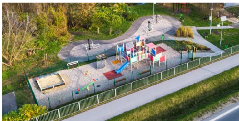
Plac zabaw w Mętowie

– mówi Jacek Anasiewicz, wójt gminy Głusk. – Stwarzamy warunki do nowych inwestycji, głównie inwestycji budownictwa jednorodzinne, mieszkaniowego, ale też innych drobniejszych usług. Tereny są uzbrojone w infrastrukturę, którą ciągle rozwijamy i rozbudowujemy. Zachęcamy do zamieszkania w naszej gminie.