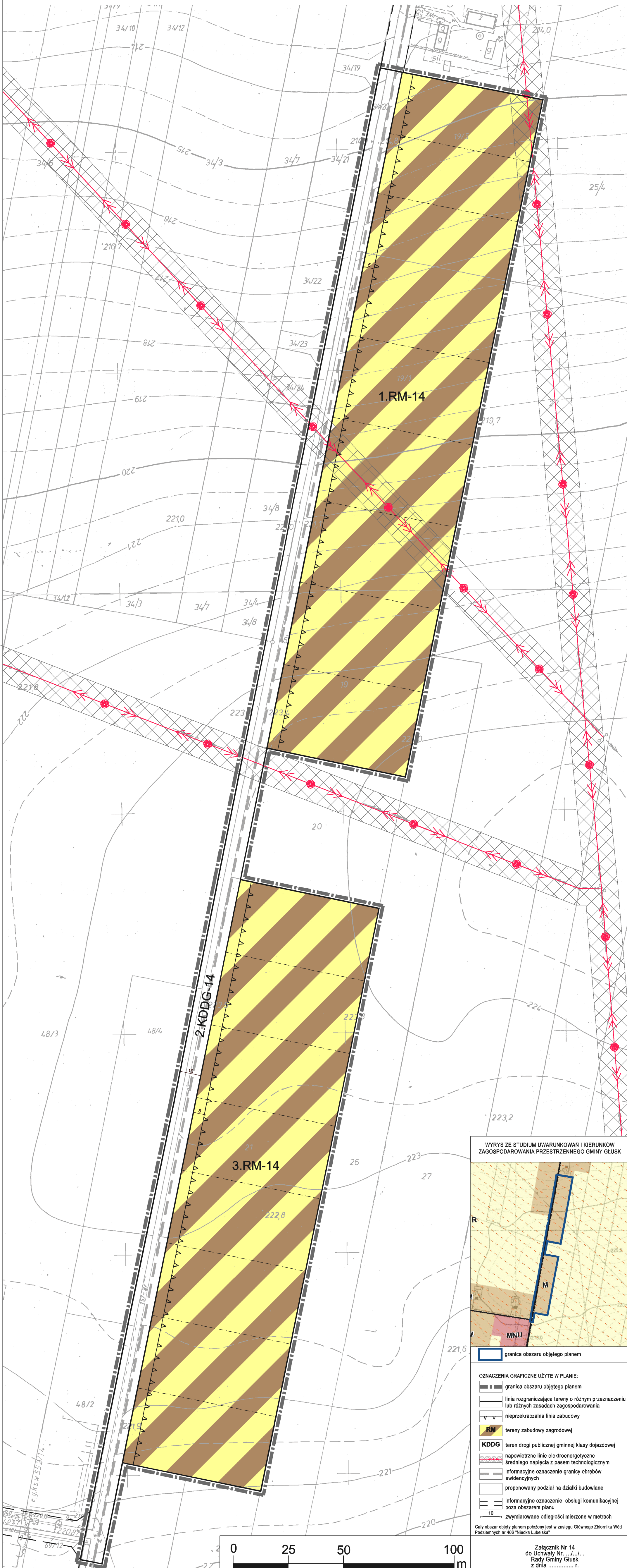
WYRYS ZE STUDIUM UWARUNKOŃ I KIERUNKÓW ZAGOSPODAROWANIA PRZESTRZENNEGO GMINY GŁUSK