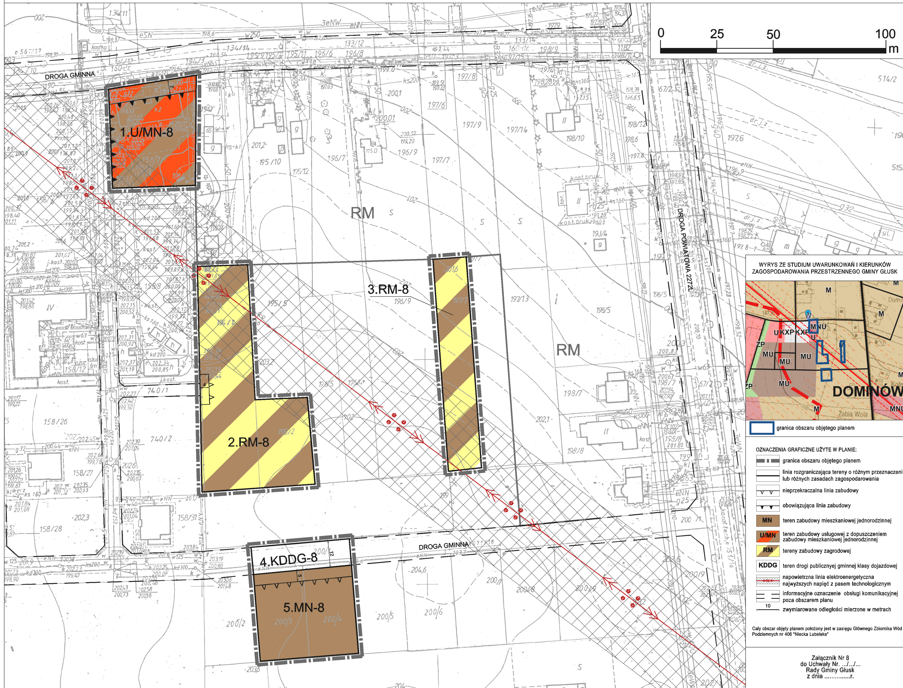
WYRYS ZE STUDIUM UWARUNKOWAŃ I KIERUNKÓW ZAGOSPODAROWANIA PRZESTRZENNEGO GMINY GŁUSK