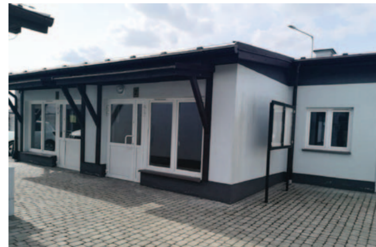
W tym budynku będzie się mieścić filia wydziału komunikacji, transportu i drogownictwa

Przyjęliśmy na siebie te obowiązki, by ułatwić życie naszym mieszkańcom. Obecnie ci, którzy starają się o dowód rejestracyjny czy prawo jazdy albo chcą załatwić inne sprawy z zakresu komunikacji, muszą jeździć na ul. Spokojną w Lublinie. To miejsce w centrum miasta, gdzie trudno zaparkować, a i liczba