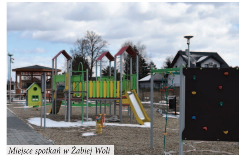
Miejsce spotkań w Zabiej Woli

Trwa rewitalizacja na terenie gminy w ramach projektu współfinansowanego ze środków Europejskiego Funduszu Rozwoju Regionalnego i budżetu państwa w ramach Regionalnego Programu Operacyjnego Województwa Lubelskiego na lata 2014-2020. Całkowity koszt realizacji projektu wyniesie ponad 12,3 mln zł, z czego dofinansowanie wynosi prawie 7,5 mln zł.