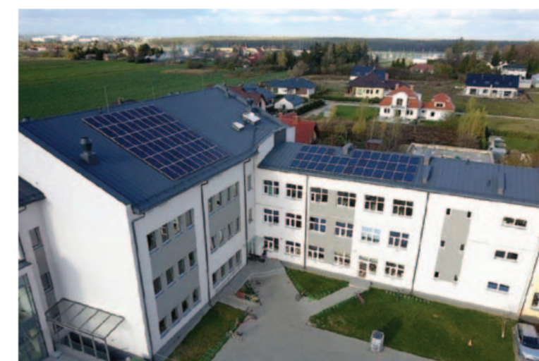
W budynku szkoły w Kalinówce udało się zorganizować siedem oddziałów przedszkolnych

W nieco gorszej sytuacji są rodzice trzylatków. Dla czterdziestu trzech maluchów na razie nie ma miejsc, ale władze gminy starają się znaleźć im opiekę w innych placówkach. Nikt nie spodziewał się aż takiego zainteresowania rodziców dzieci zamieszkujących w tej miejscowości. Chętnych, którzy chcieliby umieścić swoje pociechy w przedszkolu było aż 218. Tyle wpłynęło wniosków. Miejsc było o wiele mniej, bo 175. W pierwszej kolejności zapewniono je dzieciom, których rodzice zadeklarowali kontynuację