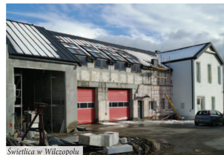
Świetlica w Wilczopolu

To nie koniec inwestycji. Pod koniec czerwca mieszkańcy gminy będą mogli również korzystać z nowego kompleksu rekreacyjno-sportowego, który powstaje w piwnicach budynku biurowo-usługowego w Dominowie. 21.03.2019r. Prezes Zarządu GZK Głusk Sp. z o.o. podpisał umowę o dofinansowanie projektu w ramach działania 13.4 RPO WL na realizację inwestycji pn. „Rewitalizacja piwnic budynku w Dominowie ul. Rynek 1 na Centrum rekreacji Dominów”. W podziemiach znajduje się miejsce na siłownię, salę do ćwiczeń fitness, do masażu rehabilitacyjnego i relaksacyjnego; będzie także poczekalnia oraz niezbędne zaplecze sanitarne (toalety, prysznic, szatnia) Koszt tej inwestycji to ok. 750 tys. zł, a dofinansowanie wynosi 353 tys. zł.