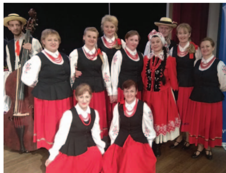
Artystyczna Gmina Głusk otrzyma dotację w wysokości 5 tys. zł.

Gmina Głusk rozstrzygnęła konkurs na tegoroczne zadania publiczne z zakresu oświaty, sportu i kultury. Sześć organizacji pozarządowych otrzyma na ten cel ponad 160 tys. zł.