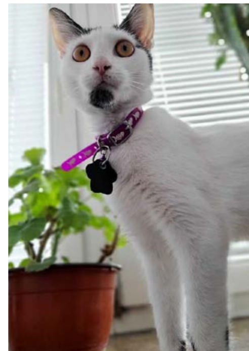
III miejsce - Julia Mendel 134 głosy