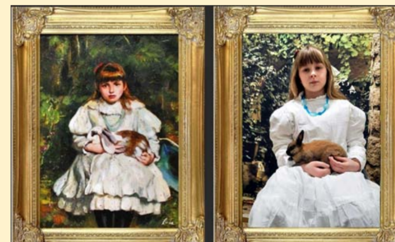
Frank Holl - Portret małej dziewczynki trzymającej królika II miejsce Daria Chmiel