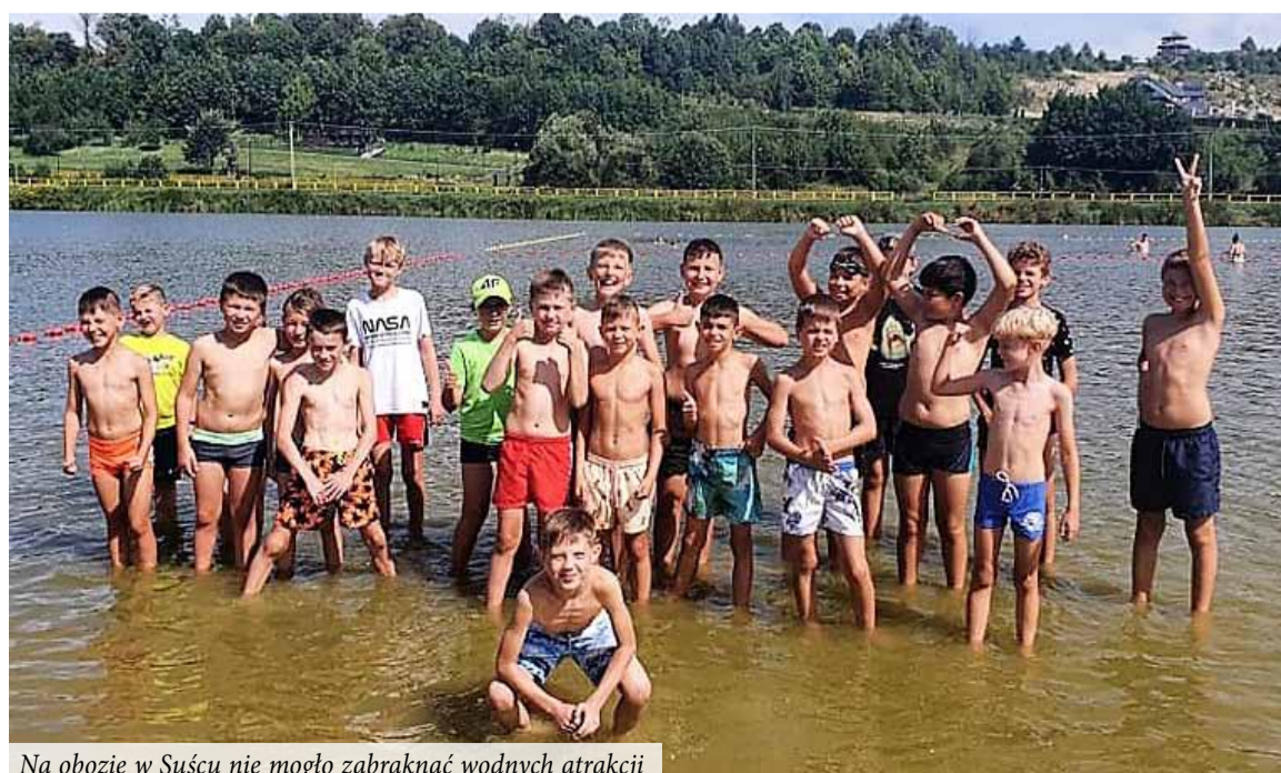
Na obozie w Suścu nie mogło zabraknąć wodnych atrakcji