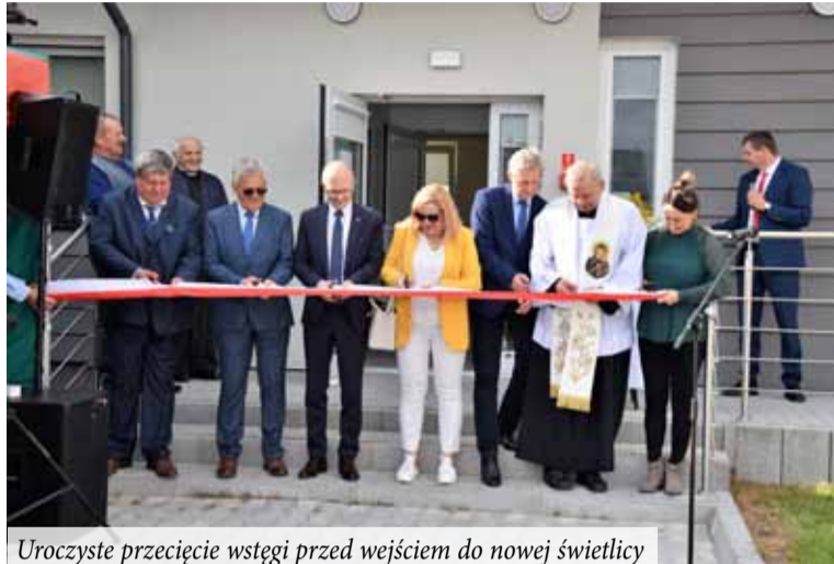
Uroczyste przecięcie wstęgi przed wejściem do nowej świetlicy

Uroczyste otwarcie świetlicy było połączone z festynem zorganizowa-