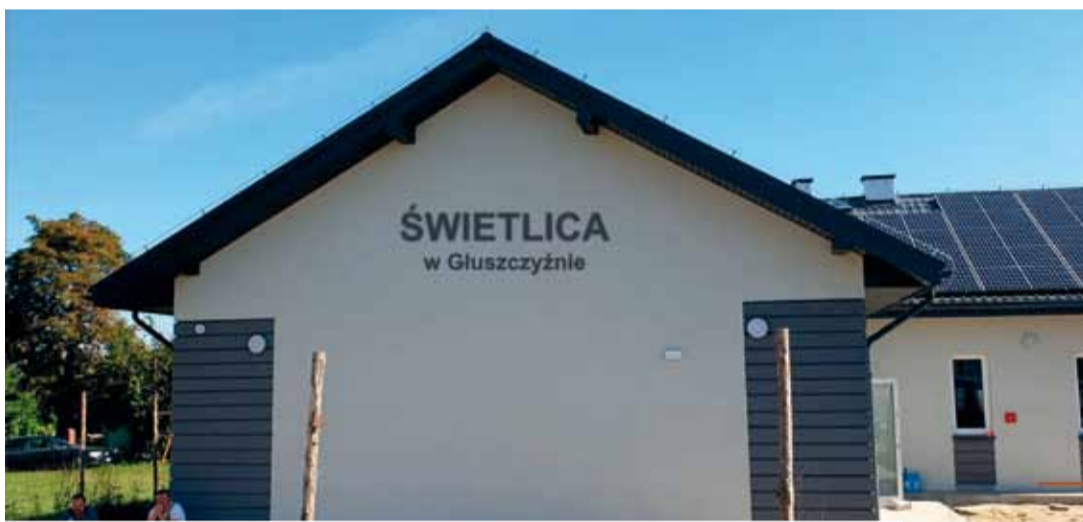
Świetlica w Głuszczyźnie - podobnie jak w Kazimierzówce - powstała od podstaw

Obie świetlice zapraszają już od kilku tygodni wszystkich mieszkańców na liczne warsztaty, zajęcia i ciekawe spotkania. Ich organizatorzy zachęcają wszystkich do uczestnictwa w tworzeniu oferty kul-