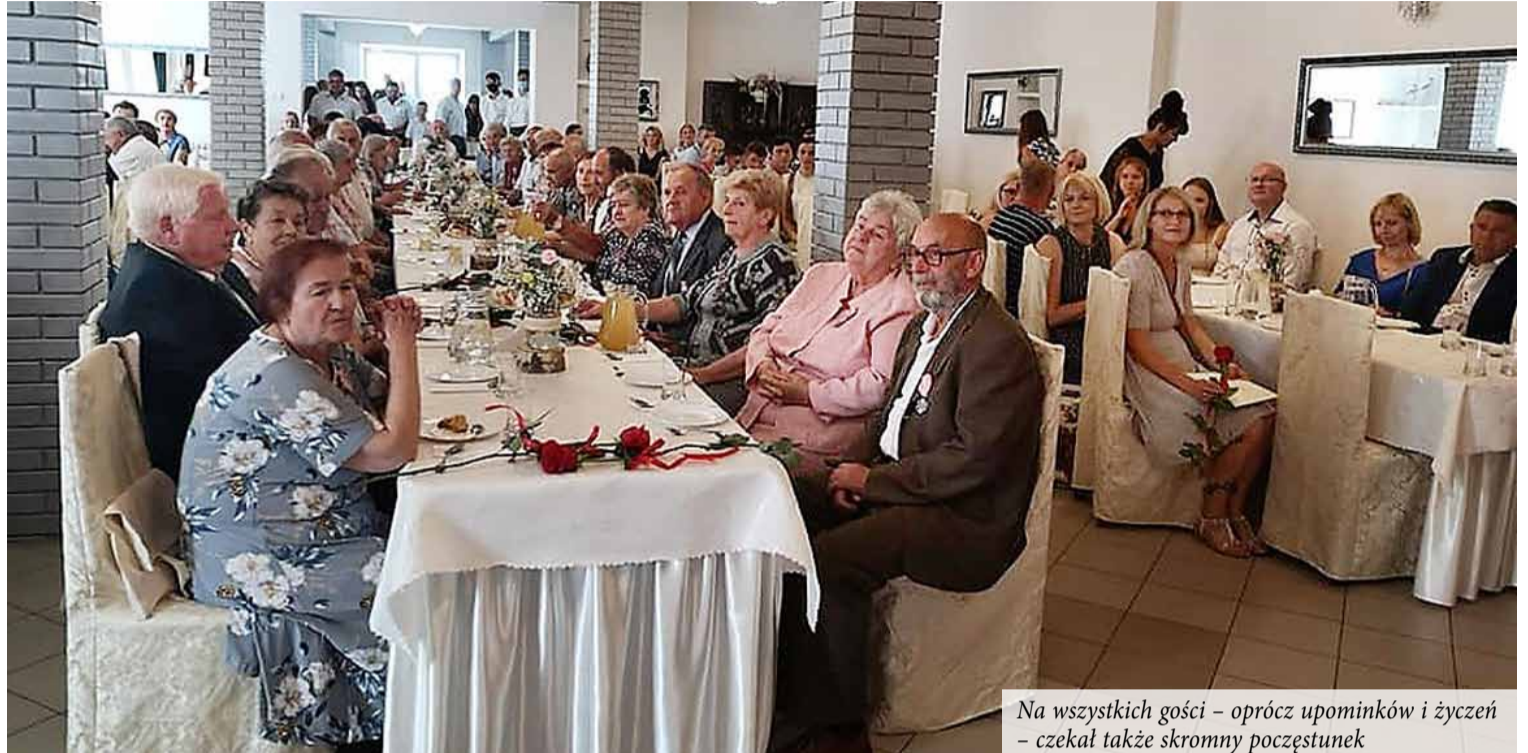
Na wszystkich gości – oprócz upominków i życzeń – czekał także skromny poczęstunek