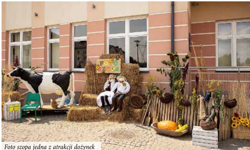
Foto szopa jedna z atrakcji dożynek