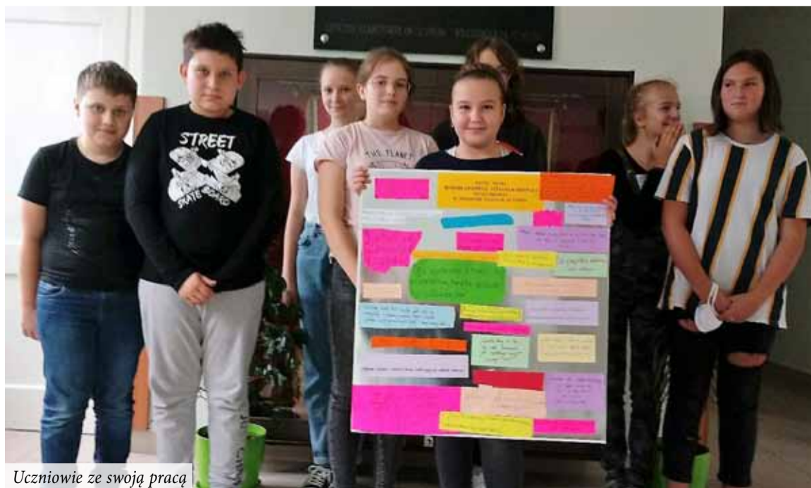
Uczniowie ze swoją pracą