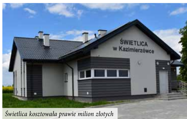
Świetlica kosztowała prawie milion złotych

turalnej, która będzie inspiracją dla wszystkich mieszkańców. - Świetlice z całą pewnością staną się miejscem spotkań i integracji mieszkańców, w którym będą mogli realizować swoje pasje i pomysły - mówi Jacek Anasiewicz, wójt gminy Głusk.