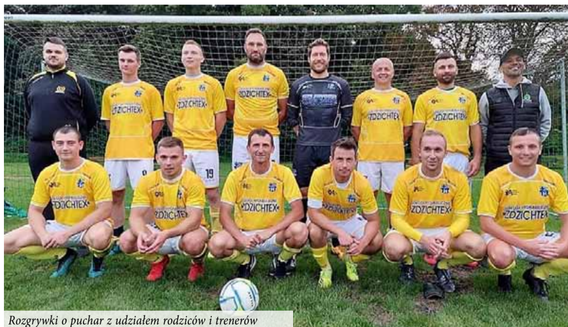
Rozgrywki o puchar z udziałem rodziców i trenerów