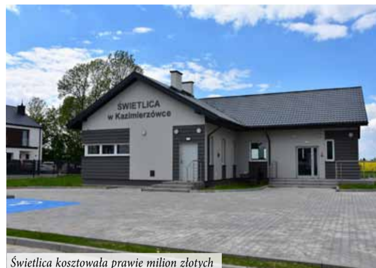
Świetlica kosztowała prawie milion złotych

W ramach tego samego projektu, od podstaw powstała również świetlica w Głuszczyźnie, która będzie oficjalnie otwarta w najbliższym czasie, ale obydwie świetlice już teraz są czynne przez cztery godziny dziennie - pięć dni w tygodniu. W ramach tego czasu odbywają się w nich różne zajęcia i spotkania, na które organizatorzy serdecznie zapraszają i czekają także na inicjatywy i pomysły samych mieszkańców.