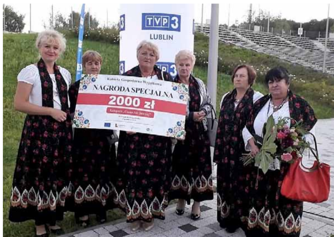
Gospodynie z KGW w Żabiej Woli z nagrodą pieniężną za wygrany półfinał wojewódzki ogólnopolskiego konkursu „Kobieta Gospodarna”. Gratulujemy!

podium np. KGW z Żabiej Woli (na zdjęciu poniżej), które za przygotowanie tortu z chleba razowego wygrało w półfinale wojewódzkim ogólnopolskiego konkursu „Kobieta Gospodarna” w kategorii „Ciasto jak dawniej”. Warto też wspomnieć o KGW z Mętowa, które zdobyło pierwszą nagrodę za pracę artystyczną – serwetę richelieu. Również panie z KGW w Ćmiłowie odniosły sukces podczas finału wojewódzkiego organizowanego w ramach festiwalu KGW „Polska od kuchni”: zajęły drugie miejsce za forszmak lubelski z kurdybankiem. Dwa spośród naszych kół KGW z Dominowa i z Ćmiłowa czekają na rozstrzygnięcie konkursu „Kubek, dzbanek czy makatka... rękodzieło to jest gratka” organizowany przez ARiMR. KGW Dominów przygotował pracę „Imbryk na tacy”, a KGW Ćmiłów pracę „Dzbanek”. Tu także liczymy na sukces naszych pań.