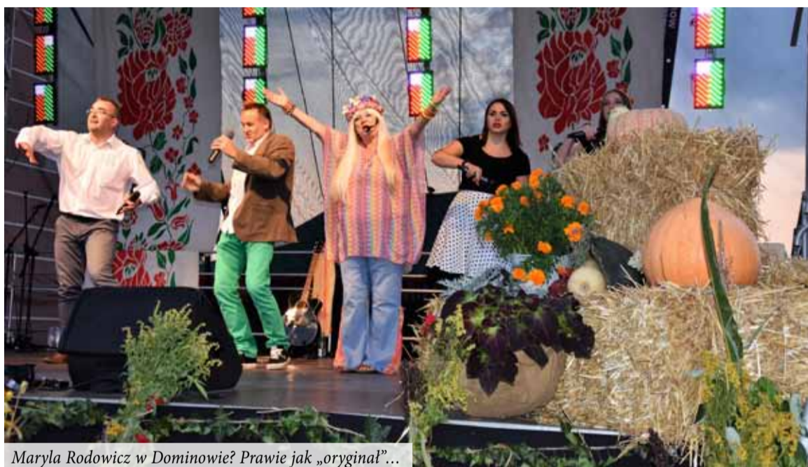
Maryla Rodowicz w Dominowie? Prawie jak „oryginał”...

Wieczorem publiczność bawiła się w rytm przebojów z lat 70. i 80. z zespołem «Alibii». W programie zespołu znalazł się także występ sobowótora Maryli Rodowicz. Imprezie