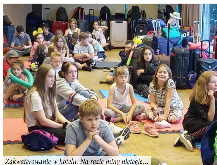
Zakwaterowanie w hotelu. Na razie miny nietęgie...