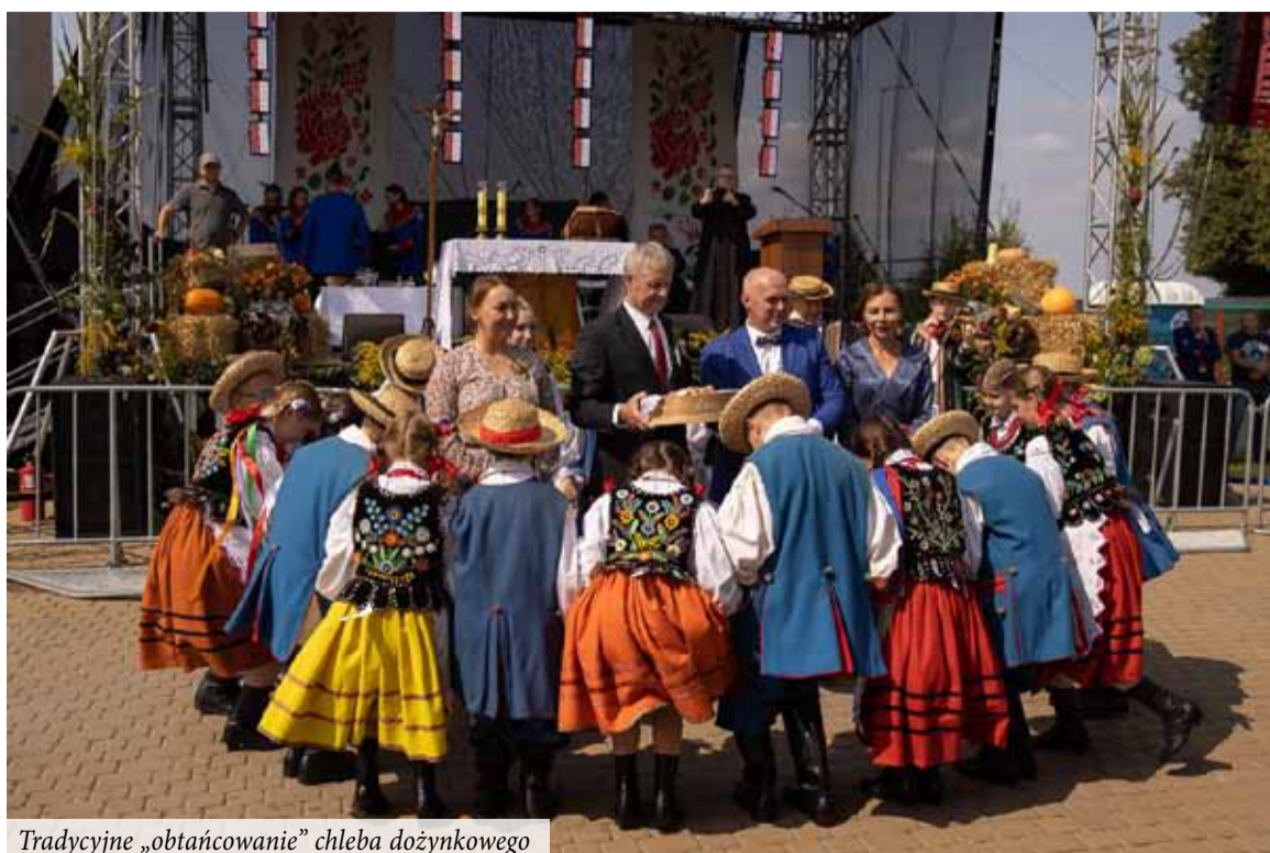
Tradycyjne „obtańcowanie” chleba dożynkowego