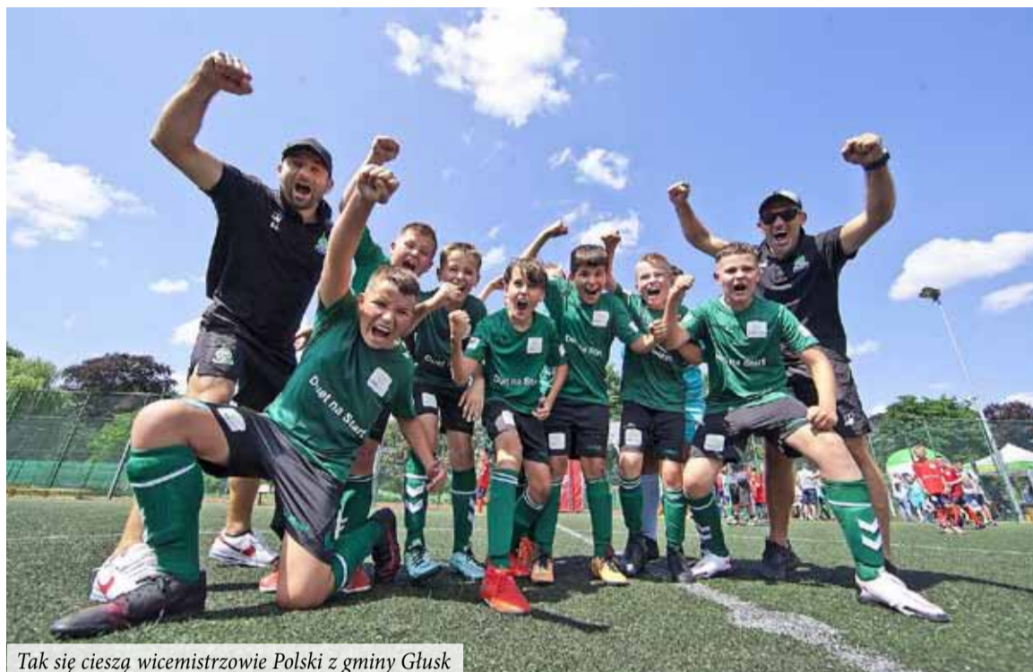
Tak się cieszą wicemistrzowie Polski z gminy Głusk

Pasmo sukcesów należy także do rodziców i trenerów, którzy po raz kolejny wzięli udział w rozgrywkach Pucharu Polski. Tym razem to zawodnicy Akademii Footballisty siedli na trybunach i kibicowali rodzicom i trenerom, którzy dzielnie walczyli na murawie. Drużynie „seniorów” udało się wygrać aż dwa mecze, w trzecim ulegli 0:4 czwartoligowej Lubliniance.