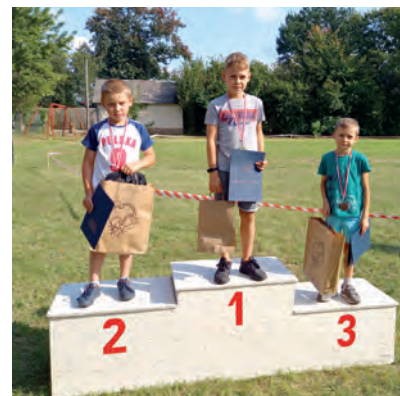
Kategoria 2012 i młodsi chłopcy