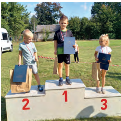
Kategoria 2015 i młodsi