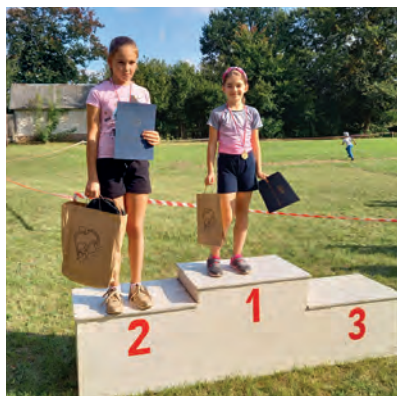
Kategoria 2012 i młodsi dziewczyny