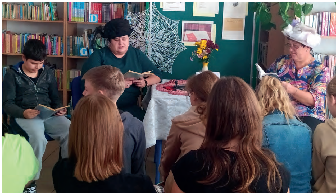
FOT. ZEBRONY SZKOŁY BIBLIOTEKI

„Moralność pani Dulskiej” autorstwa Gabrieli Zapolskiej była lekturą dziesiątej edycji Narodowego Czytania pod patronatem honorowym pary prezydenckiej.