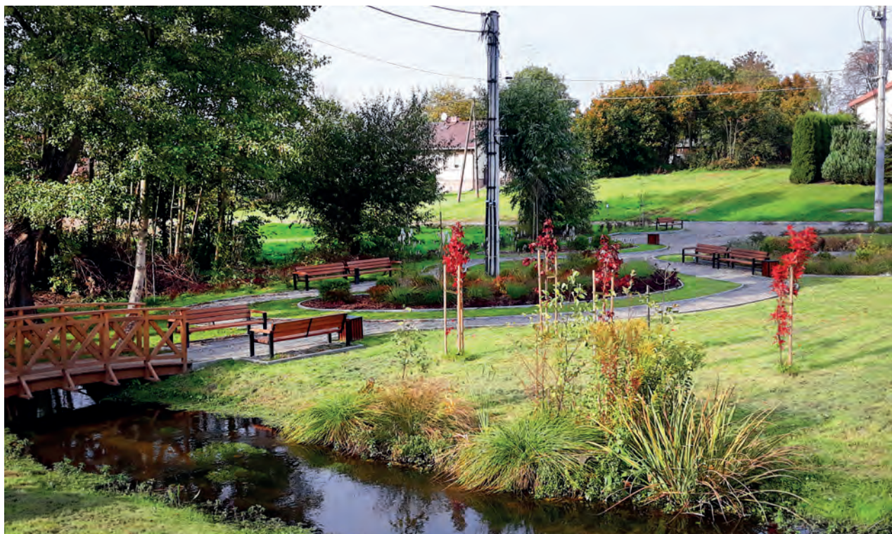
FOT. ZBIÓRNY URZĘD GMINY