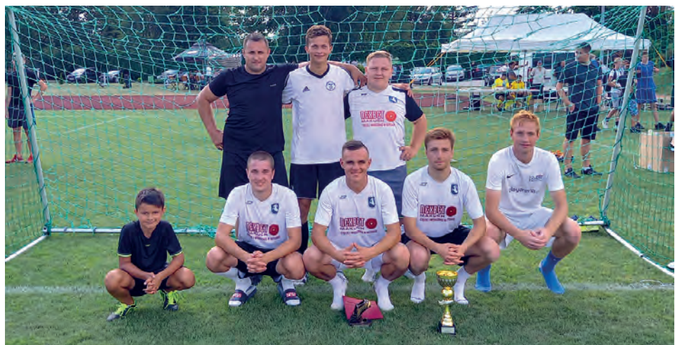
I miejsce SZOŁ TIM

W turnieju przyznano statuetki dla najlepszego strzel-