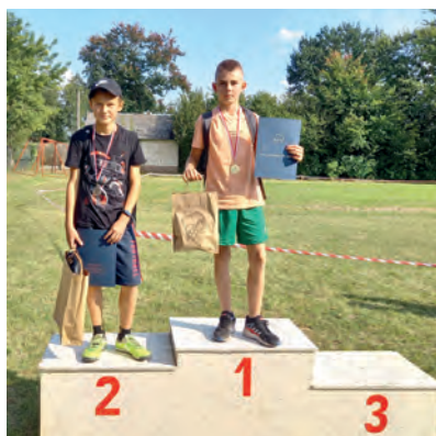
Kategoria 2009 i młodsi chłopcy