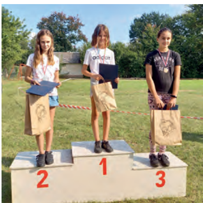
Kategoria 2009 i młodsi