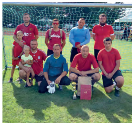
II miejsce BORZECZÓW