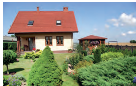
III miejsce Danuta Szymczyk