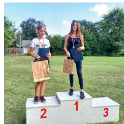
Kategoria 2007 i młodsi dziewczyny