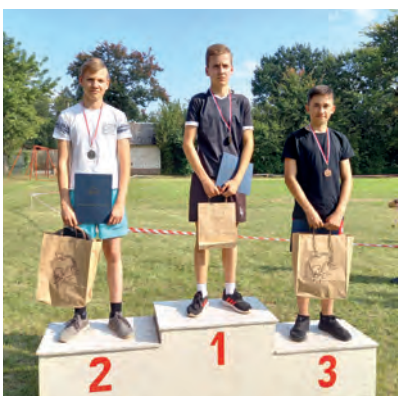
Kategoria 2007 i młodsi chłopcy