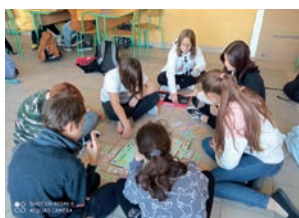
Dzień gier planszowych

riańską, Barbakan, nie zapomnieli o ul. Franciszkańskiej 3 i sławnym oknie papieskim. Przed odjazdem do hotelu zrobili pamiątkowe zdjęcia z wawelskim smokiem. Drugi dzień wycieczki uczniowie rozpoczęli od zwiedzania Kopalni Soli w Wieliczce. Przeszli szlakiem turystycznym przebiegającym przez Szyb Daniłowicza. Największy zachwyty wzbudziła Kaplica św. Kingi i komora Weimar, gdzie znajdował się duch Skarbek.