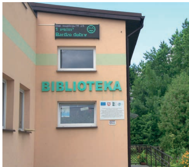
Na budynku biblioteki specjalny wyświetlacz informuje mieszkańców o aktualnej jakości powietrza

Jak dotychczas za pośrednictwem Urzędu Gminy i przy merytorycznej pomocy pracownika w punkcie konsultacyjnym programu „Czyste Powietrze”, do Wojewódzkiego Funduszu Ochrony Środowiska i Gospodarki Wodnej w Lublinie złożony został jeden wniosek o dofinansowanie inwestycji oraz jeden wniosek o płatność zrealizowanej inwestycji.