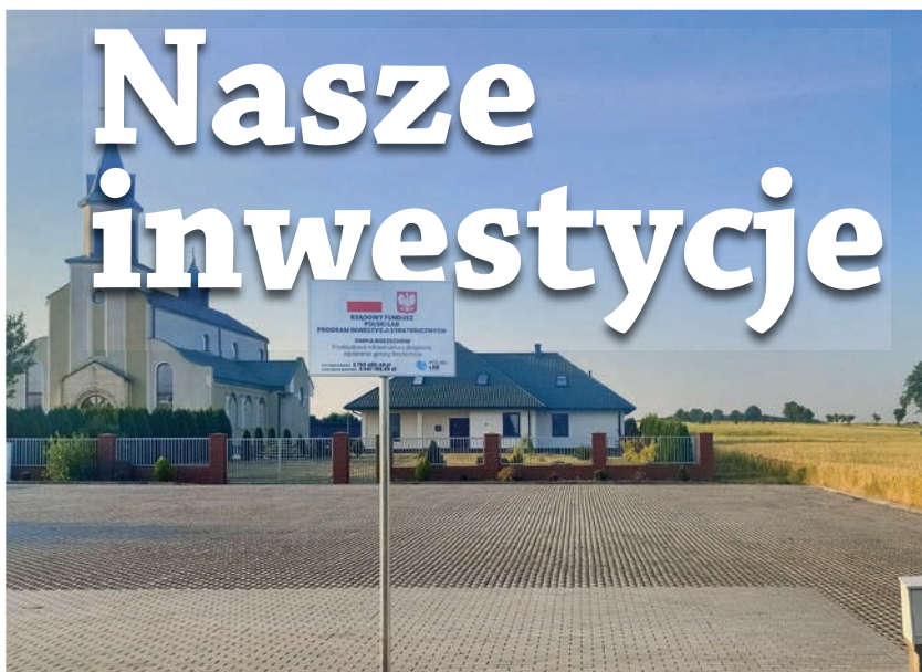
Jedną z wykonanych inwestycji jest parking

W ramach Rządowego Funduszu Polski Ład Program Inwestycji Strategicznych realizowana jest inwestycja: Przebudowa infrastruktury drogowej na terenie Gminy Borzechów .