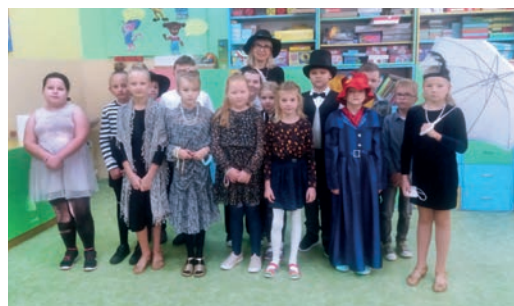
Damy i džentelmeni

Niestety rok szkolny rozpoczęliśmy bez udziału rodziców. Udało się natomiast, w miarę zgodnie z tradycją i ceremoniałem szkolnym przyjąć uczniów klasy I w poczet szkoły. Wszyscy pierwszoklasiści śpiewając zdali egzamin i zostali uroczystie pasowani na ucznia przez panią dyrektorkę.