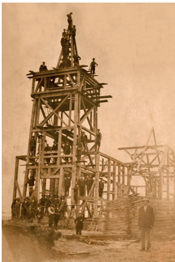
Stary kościół w trakcie budowy w latach 20.