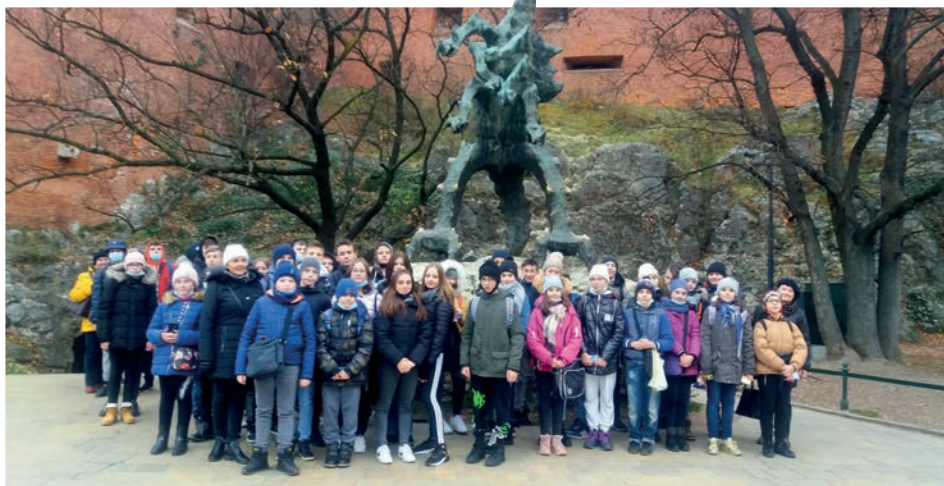
Pod Smokiem Wawelskim

Pomimo trudności spowodowanych pandemią rok szkolny 2021/2022 był obfity w wydarzenia. Udało się nam zrealizować wiele projektów i przedsięwzięć. W trosce o wspólne bezpieczeństwo, stosując się do zasad związanych z Covid-19 niektóre nasze działania i kontakty z rodzicami były ograniczone.