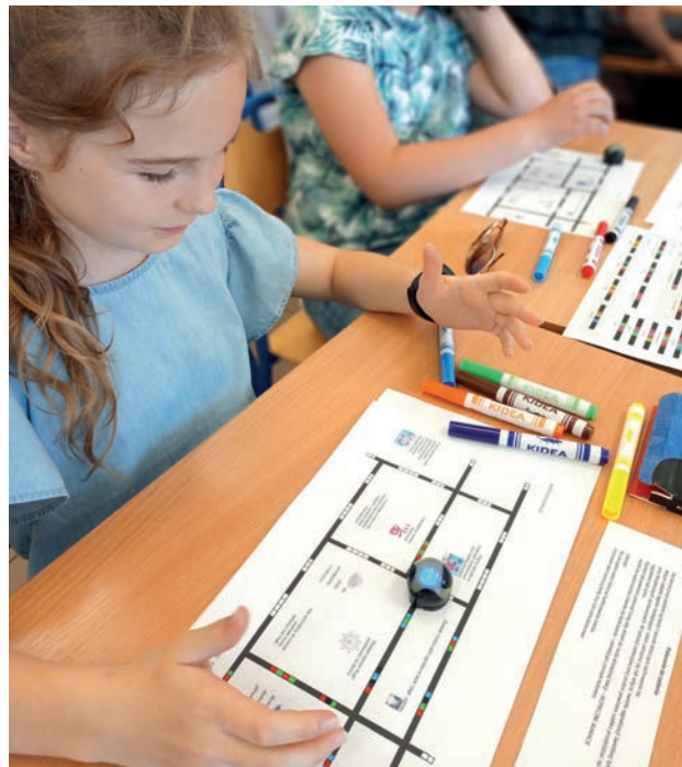
Kodowanie z ozobotem

Po długich miesiącach nauki zdalnej nikogo chyba nie trzeba przekonywać, że nauka stacjonarna w szkole, w towarzystwie z rówieśnikami jest o wiele bardziej efektywna i ciekawa. Nauczyciele nie szczędzili trudu, aby rzetelnie prowadzone przez nich zajęcia były interesujące, kreatywne i w maksymalny sposób pozwały na zdobywanie wiedzy oraz poznawanie świata przez uczniów. Oto przykłady kilku „niecodziennych” zajęć, które odbyły się w ciągu roku w Szkole Podstawowej w Borzechowie: