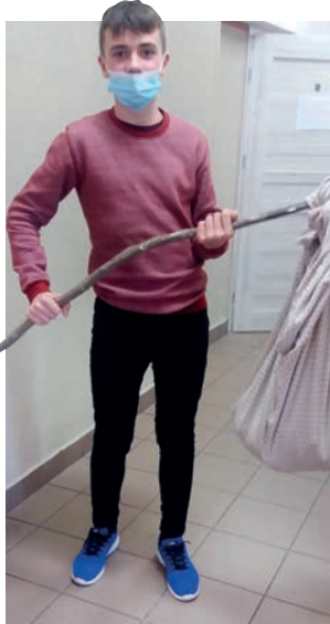
Dzień bez plecaka