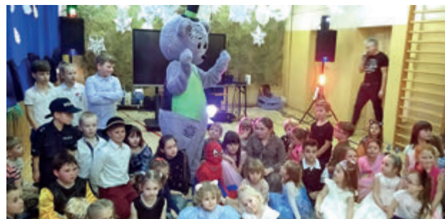
FOT. ARCHIWUM SZKOŁY (4)