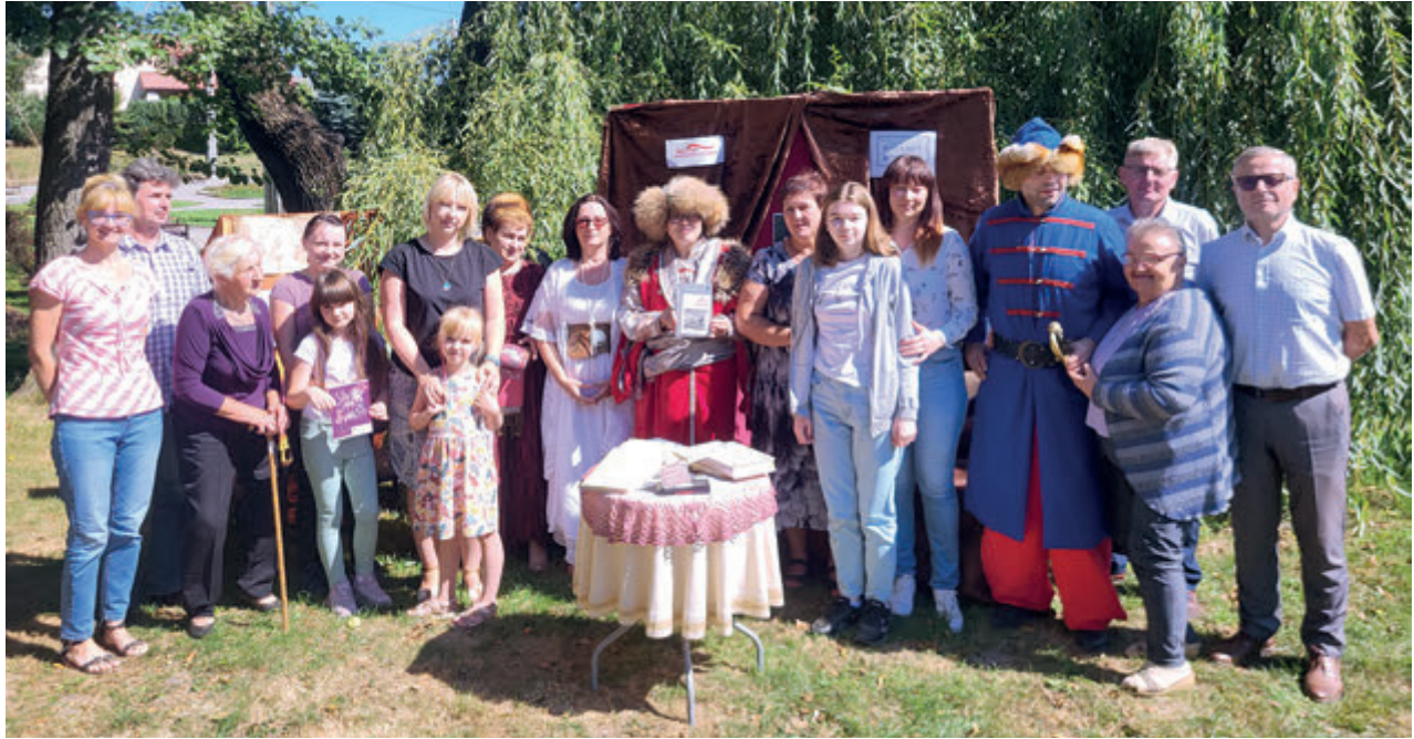
FOT. ARCHIWUM BIBLIOTEKI (2)