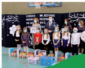
Wizyta Pana Ministra w ZSP w Pliszczynie str. 22