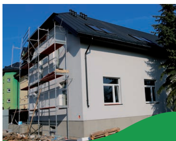
Stan realizacji inwestycji str. 4