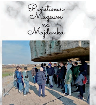
Państwowe Muzeum na Majdanku