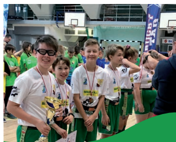
FARMERZY podwójnymi Mistrzami Województwa w Rugby Tag str. 15