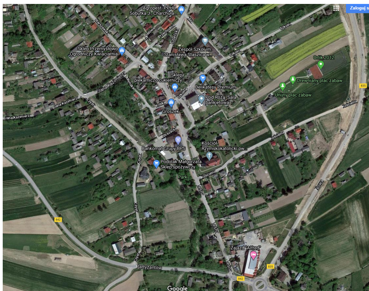
Mapa 2. Układ sieci osadniczej w gminie Wysokie.