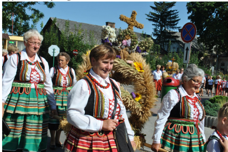
Zdjęcie 12. Dożynki gminne.

Sierpień. Odbyły się Dożynki Gminno-Parafialne, które były czasem podziękowania za trud pracy rolników. Ze względu na trwającą pandemię święto plonów miało skromniejszą oprawę niż w latach poprzednich. Odbyła się tylko msza święta w kościele p.w. Świętego Michała Archanioła w Wysokiem oraz korowód dożynkowy.