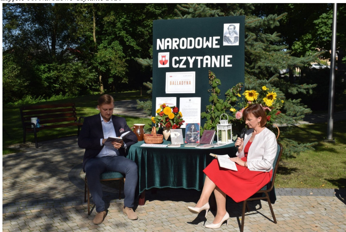
Zdjęcie 11. Narodowe Czytanie 2020

Wrzesień. Odbyła się IX odsłona Narodowego Czytania, zorganizowana tym razem w parku, wspólnie z Zespołem Szkół im. St. Staszica w Wysokiem. W czytaniu uczestniczyli: władze gminy, młodzież II klasy LO z ZS wraz z wychowawczynią i bibliotekarze.