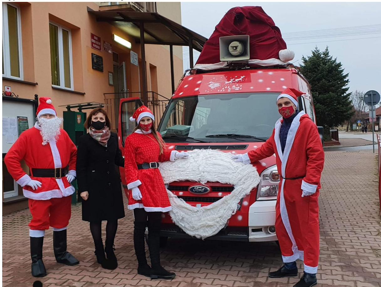
Zdjęcie 13. Mobilne Gminne Mikołajki

Rok 2020 był bardzo trudnym okresem w działalności kulturalno-oświatowej. Wszelkie obostrzenia związane z wybuchem pandemii COVID-19 ograniczyły działalność kulturową GBP i GOK do minimum. Ze względu na sytuację epidemiologiczną w kraju wiele zaplanowanych wcześniej imprez i wydarzeń na rok 2020 zostało odwołanych i niezrealizowanych.