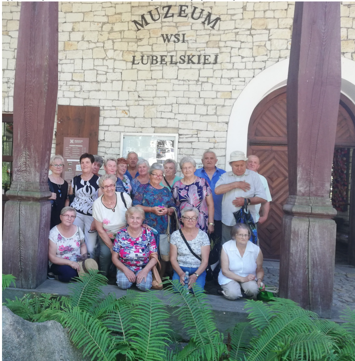
Zdjęcie 14. Wycieczka do Muzeum Wsi Lubelskiej w ramach projektu „Aktywni 60+”

Niestety, w związku z nasilającą się liczbą zachorowań w kraju spowodowaną pandemią Covid-19, w październiku zajęcia ponownie zostały wstrzymane do odwołania.