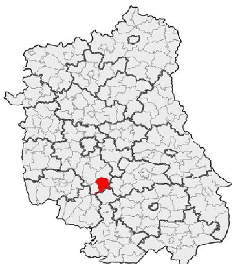
Mapa 1. Położenie geograficzne Gminy.

Gmina Wysokie jest gminą wiejską położoną w centralnej części województwa lubelskiego, na południe od stolicy województwa – Miasta Lublin. Jest jedną z 16 gmin należących do powiatu lubelskiego. Gmina położona jest w jego południowo-wschodniej części i graniczy z Gminą Bychawa z powiatu lubelskiego (gmina miejsko-wiejska) oraz gminami wiejskimi: Gminą Krzczonów, Gminą Zakrzew (z powiatu lubelskiego), Gminą Turobin (powiat biłgorajski) i Gminą Żółkiewka (powiat krasnostawski). Całkowita powierzchnia gminy wynosi 113,9 km 2 . Gmina Wysokie oddalona jest od centrum stolicy województwa i siedziby powiatu lubelskiego – Miasta Lublin – o ok. 43 km