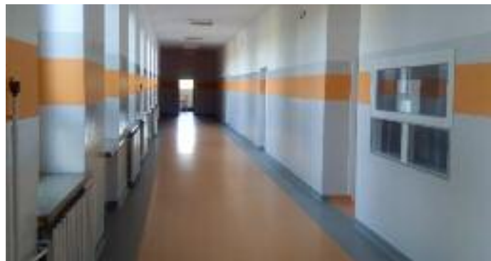
Remont korytarza w Zespole szkół w Jabłonie