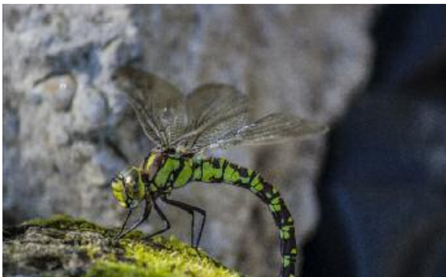
I miejsce kat. Gimnazjum i szkoła średnia - Natalia Tarka „W swoim żywiole”