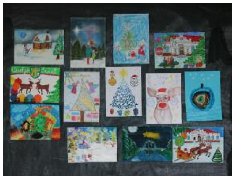
Na zdjęciach: z lewej strony nagrodzona kartka świąteczna autorstwa Agaty Jones, u góry wyróżnione kartki świąteczne