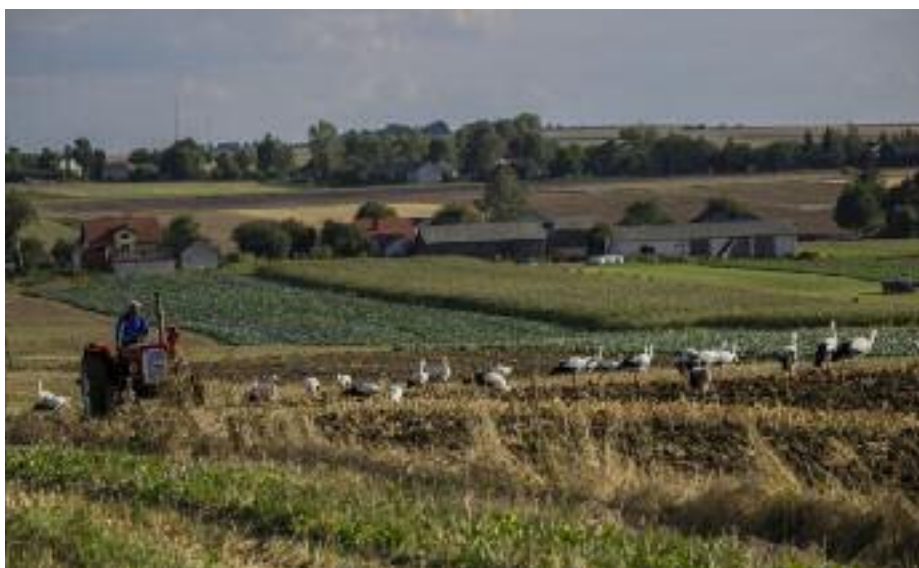
I miejsce kat. Szkoła podstawowa - Amelia Tarka „Przed odlotem”