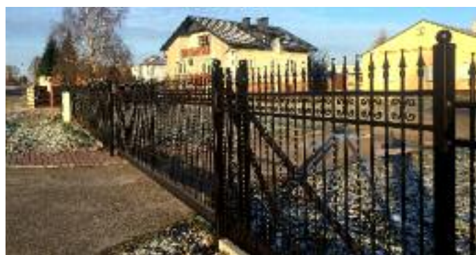
Remont ogrodzenia przy OSP w Jabłonie