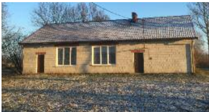
Wymiana pokrycia dachu świetlicy w Skrzynicach-Kolonii