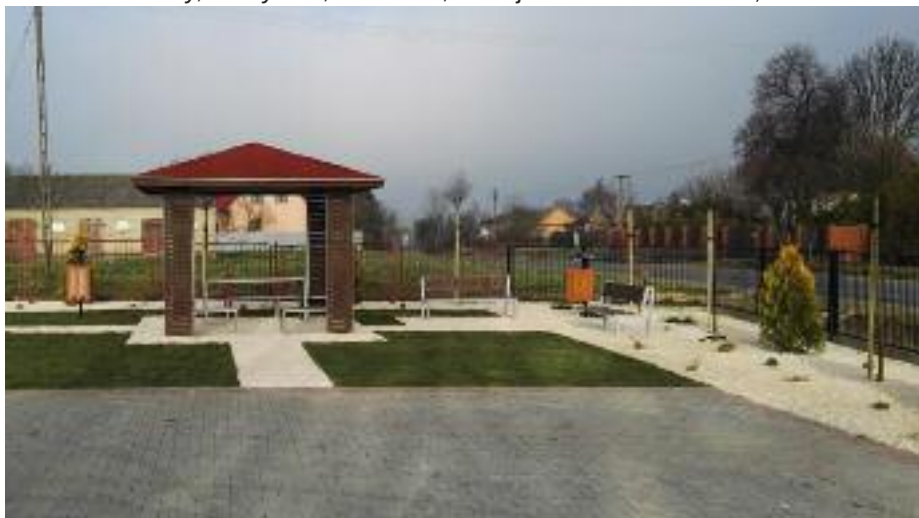
Zagospodarowanie terenu wokół remizy OSP w Chmielu