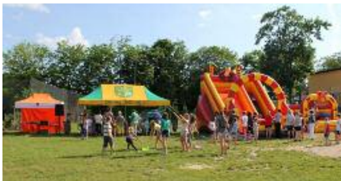
Dzień Dziecka w Czerniejowie