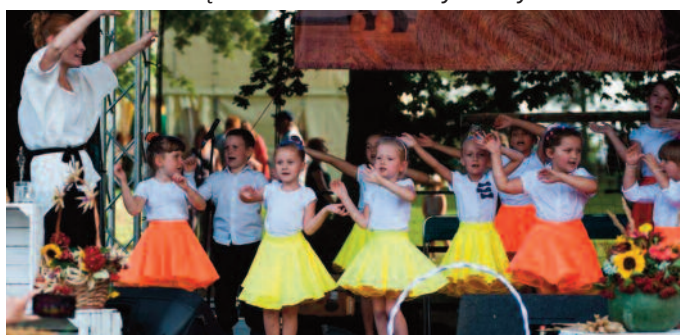
Dziecięca Grupa Taneczna