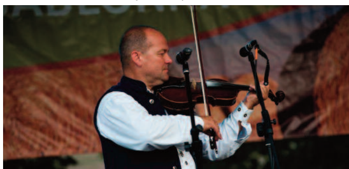
Koncert zespołu Zachata