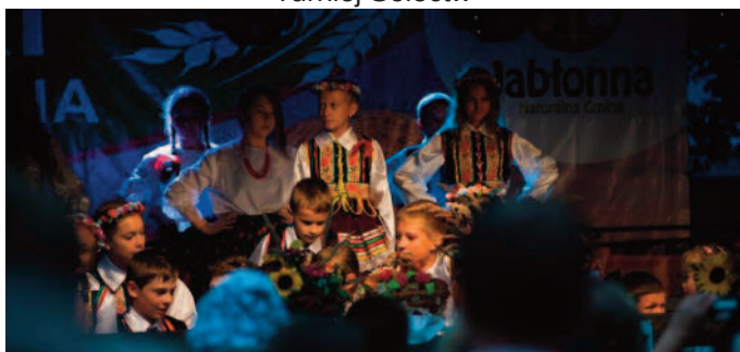
Występ zespołu Jabłoneczki