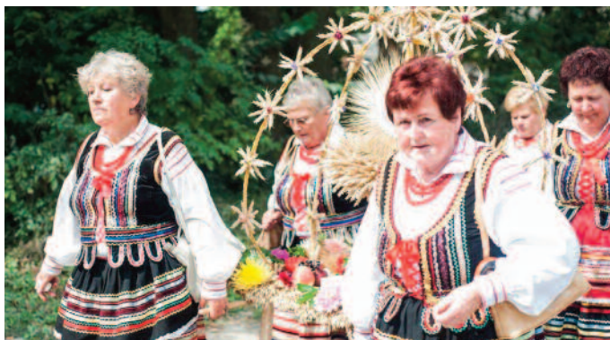
Delegacje KGW z wieńcami dożynkowymi