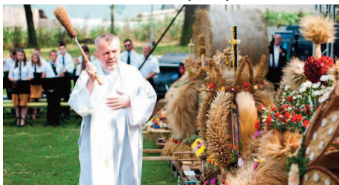
Poświęcenie wieńców dożynkowych