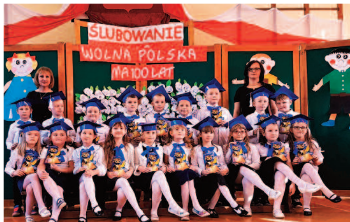
Klasa Ib Zespołu Szkół w Jabłonie