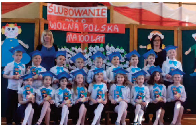
Klasa Ia Zespołu Szkół w Jabłonie