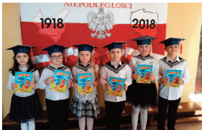
Klasa I Szkoły Podstawowej w Tuszowie