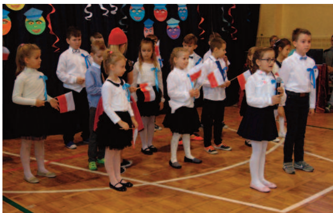
Klasa I Szkoły Podstawowej w Czerniejowie