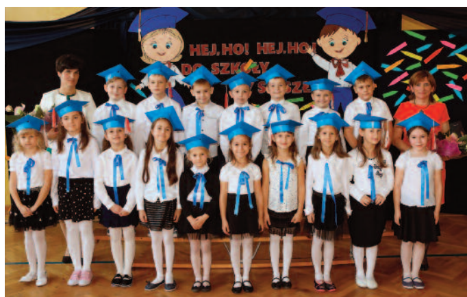
Klasa I Zespołu Szkół w Piotrkowie