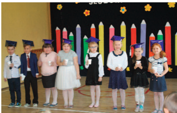
Klasa I Szkoły Podstawowej w Skrzynicach

Doniosłym momentem uroczystości było ślubowanie pierwszoklasistów, które wzbudziło wiele emocji. Aktu pasowania w poszczególnych szkołach dokonywały panie dyrektorzy kolorowym ołówkiem. Tym samym pierwszaki zostały włączone do społeczności uczniowskiej szkoły w Skrzynicach, Tuszowie, Piotrkowie, Czerniejowie i Jabłonie. Dowodem były akty pasowania na ucznia wręczone dzieciom przez panie dyrektorzy i wychowawczynie.