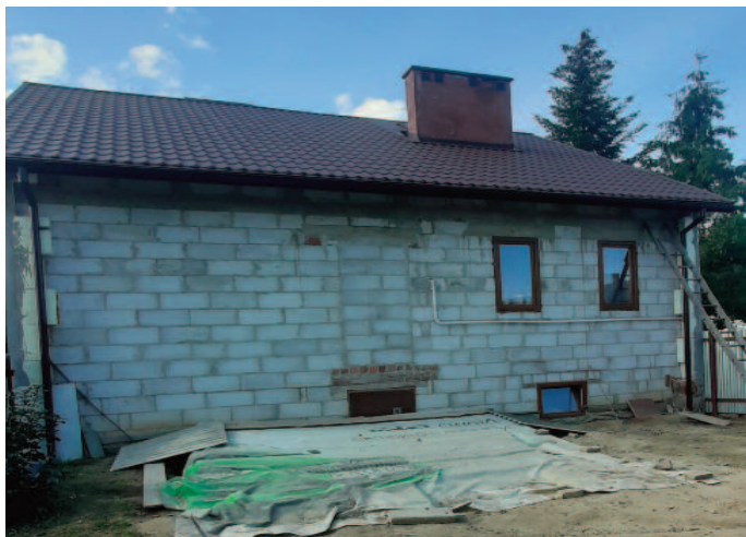
Budynek przed termomodernizacją