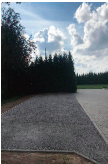
Budowa parkingu przy Centrum Kultury Gminy Jabłonna (sołectwa: Piotrków Pierwszy, Piotrków Drugi)