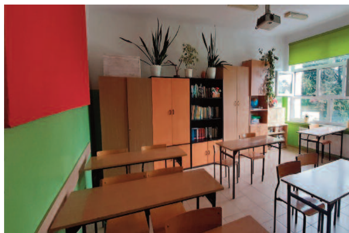
Malowanie sal lekcyjnych w Szkole Podstawowej w Tuszowie