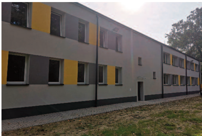
Termomodernizacja Szkoły Podstawowej w Tuszowie