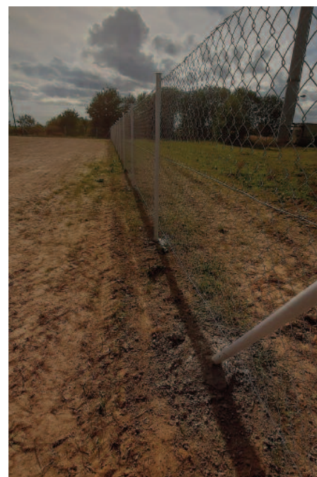
Budowa ogrodzenia boiska sportowego wraz z montażem piłkochwytywów (sołectwa: Chmiel Pierwszy, Chmiel Drugi, Chmiel-Kolonia)