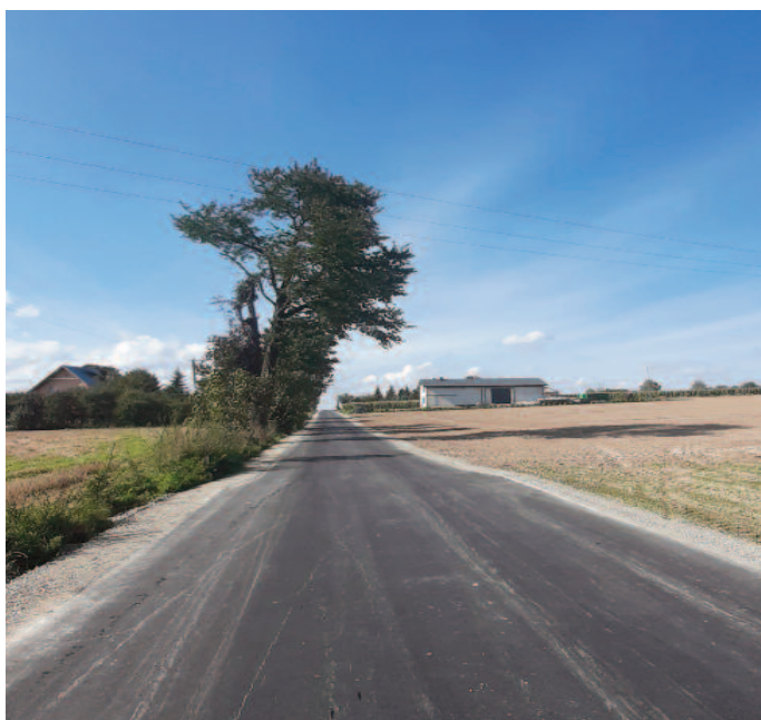
Droga gminna tzw. „Zapłocie”