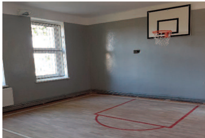
Malowanie sal lekcyjnych w Szkole Podstawowej w Skrzynicach