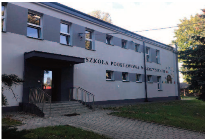
Termomodernizacja Szkoły Podstawowej w Skrzynicach