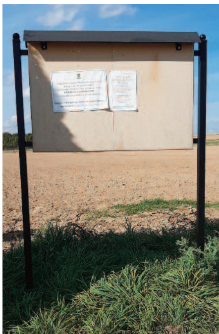
Zakup tablic ogłoszeniowych (sołectwa: Jabłonna Pierwsza, Jabłonna Druga, Tuszów)