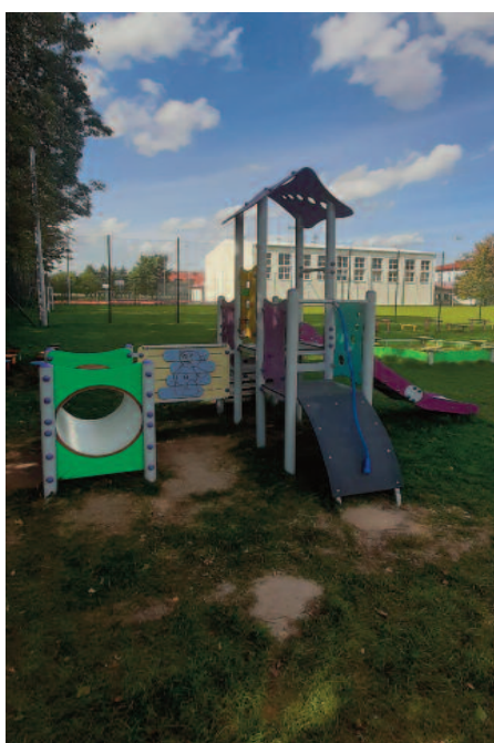
Rozbudowa placu zabaw przy ZS w Jabłonie (sołectwa: Jabłonna Pierwsza, Jabłonna Druga, Jabłonna-Majątek)