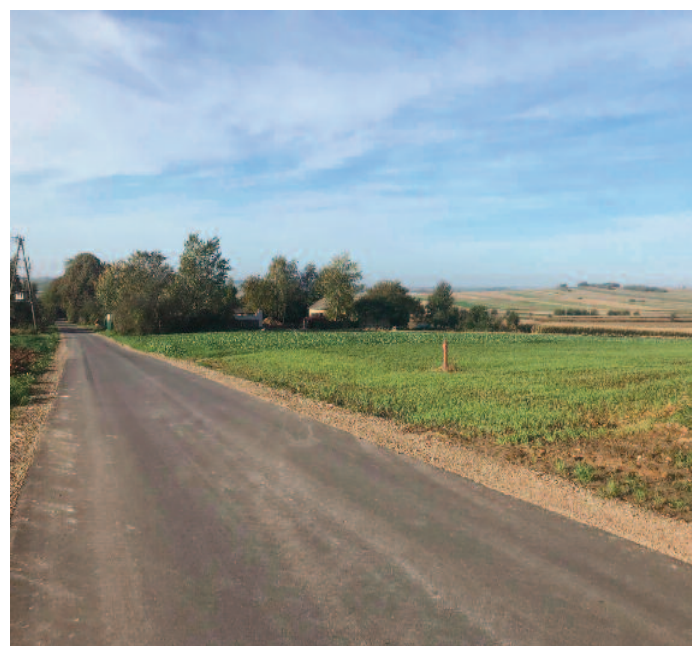
Droga gminna tzw. „Majdanek Chmielowski”