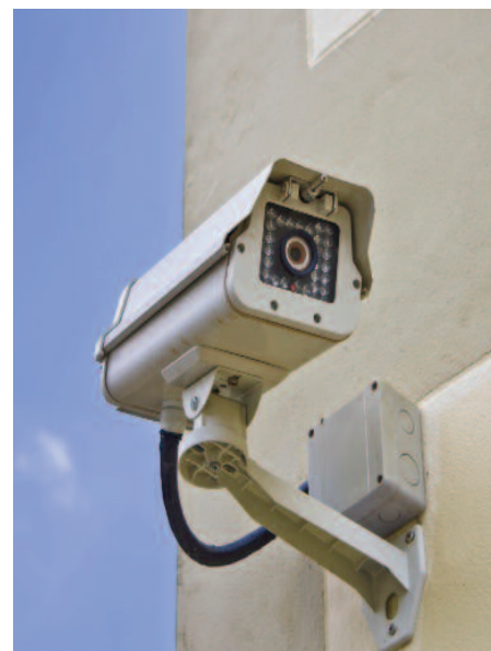
Montaż monitoringu na remizie OSP w Tuszowie, remizie OSP w Wierciszowie, OSP w Chmielu, świetlicy w Skrzynicach-Kolonii, SP w Czerniejowie (sołectwa: Tuszów, Wierciszów i Skrzynice-Kolonia, Czerniejów, Chmiel-Kolonia)