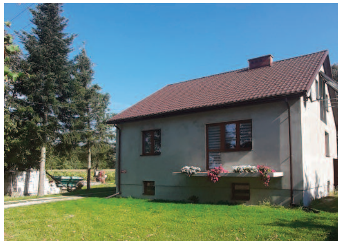
Budynek po przeprowadzonej termomodernizacji