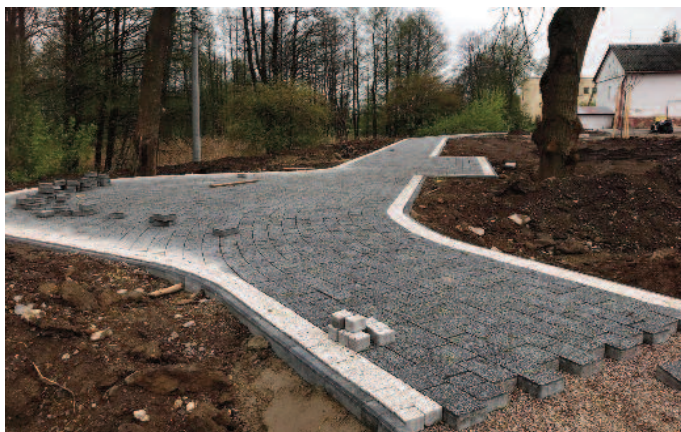
Przebudowa placu w centrum Jabłonna-Maja-tek