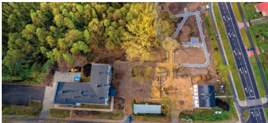
Przebudowa placu w centrum Jabłonna-Majątek

Obecnie trwają prace przy realizacji zadania pn.: „ Przebudowa i budowa drogi gminnej nr 107159L w miejscowości Jabłonna-Majątek, Jabłonna Pierwsza, Piotrków Drugi – gmina Jabłonna ”. W zakres inwestycji wchodzi wykonanie nawierzchni z betonu asfaltowego oraz kostki bazaltowej (w obszarze objętym ochroną konserwatorską) na długości 3 419, mb (szerokość jezdni od 3 do 4 m wraz z mijankami), pobocza z kru-