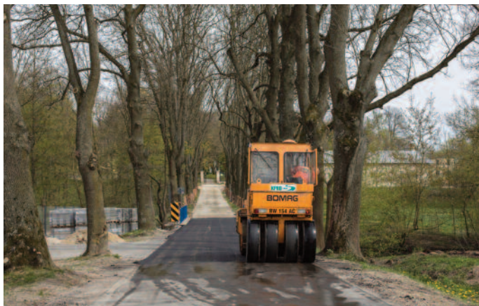
Przebudowa „Czarnej Alei”