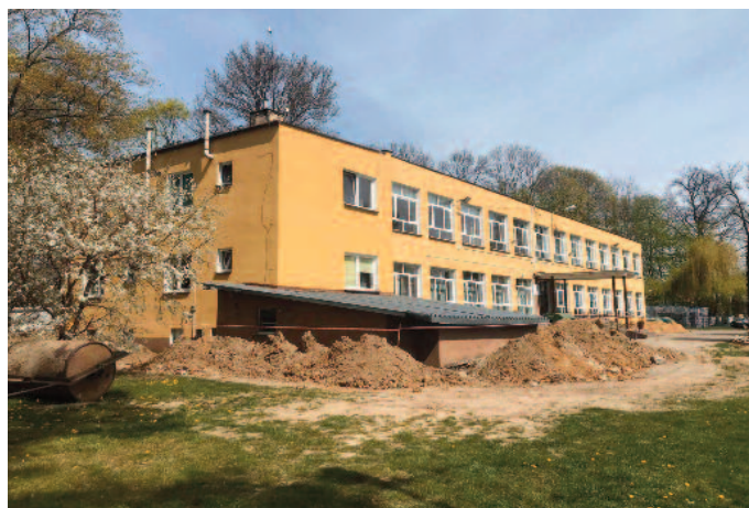
Termomodernizacja Szkoły Podstawowej w Tuszowie