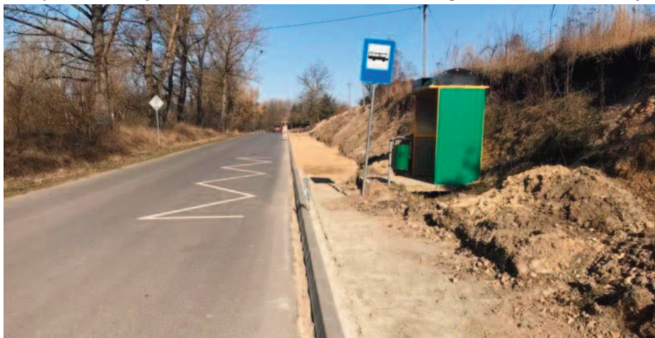
Budowa chodnika w Skrzynicach Pierwszych i Skrzynicach Drugich