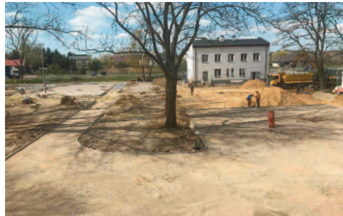
Przebudowa placu w centrum Jabłonna-Maja-tek