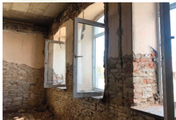
Przebudowa budynku biblioteki

W centrum Jabłonna-Maja-tek trwają nadal intensywne prace związane z jego rewitalizacją. Przypomnijmy, że na realizację inwestycji