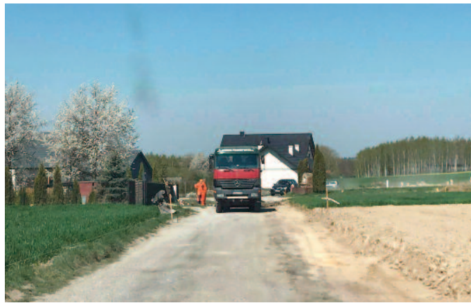
Przebudowa tzw. „Zapłocia”