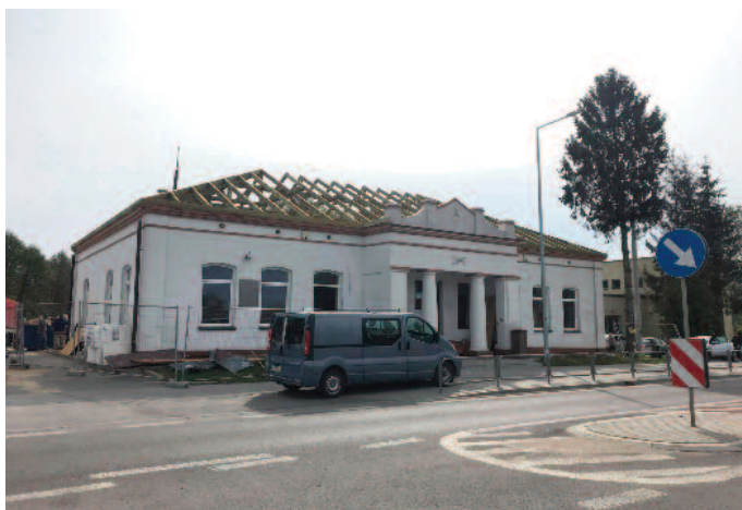
Przebudowa budynku biblioteki