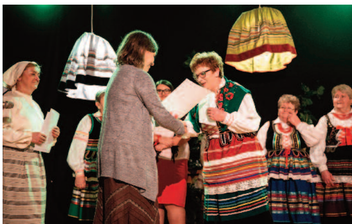
III miejsce - ZŚ KGW Tuszów