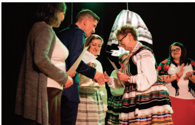
I miejsce - ZŚ KGW Piotrków Drugi