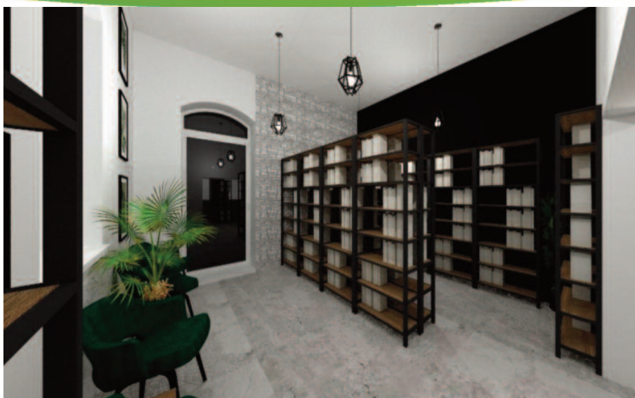
Wizualizacja sali bibliotecznej w nowym budynku Biblioteki

Po skończonej inwentaryzacji, przez kolejnych kilka dni pakowałyśmy i przewoziłyśmy książki do lokalu w którym z początkiem marca miały ruszyć wypożyczenia i nasze codzienne spotkania z czytelnikami. Niestety, z wiadomych przyczyn już od ponad 40 dni drzwi naszej Biblioteki są dla Was zamknięte. Ubolewamy nad tym. Chcemy Wam powiedzieć, że czas, który spędzamy bez Was drodzy czytelnicy przeznaczaliśmy na to, by uporządkować księgozbiór po inwentaryzacji i przygotować go do wprowadzenia do systemu bibliotecznego MAK+.