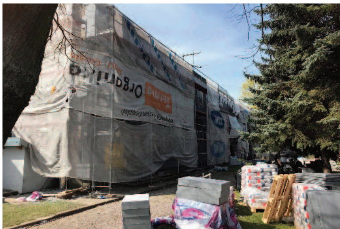
Termomodernizacja Szkoły Podstawowej w Skrzyńcach