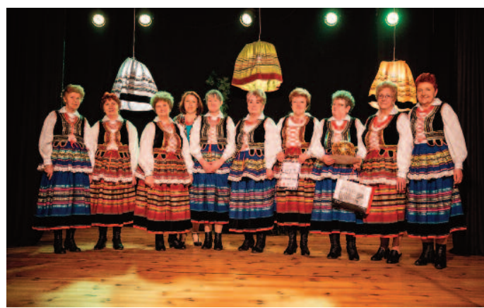
Nagroda publiczności - ZŚ KGW Jabłonna Druga