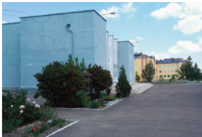
Teterivka - Centrum Kultury i szkoła podstawowa