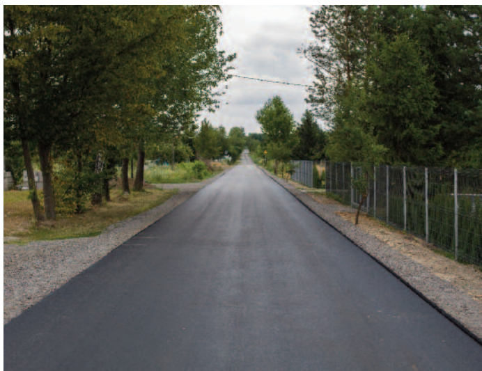
Budowa drogi w m. Jabłonna Pierwsza