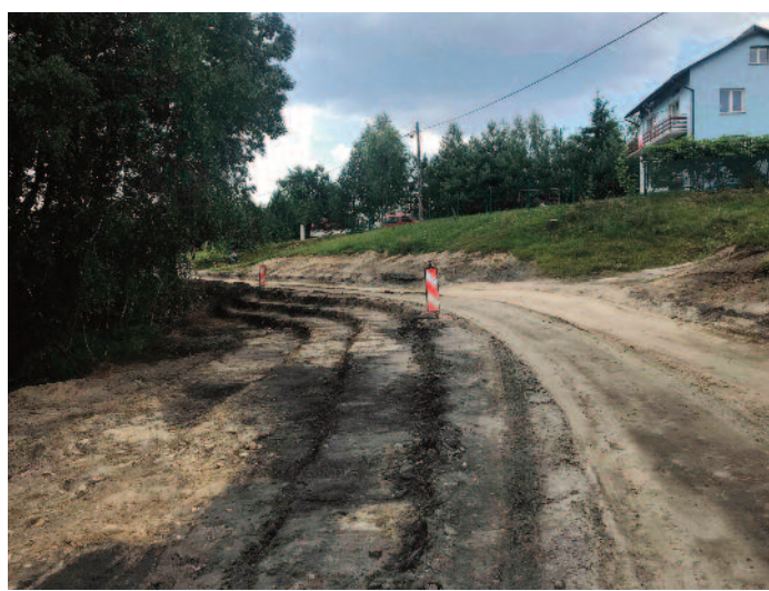
Budowa drogi Dominów-Skrzynice

budynków Zespołu Szkół w Jabłonnie oraz Centrum Kultury Gminy Jabłonna w Piotrkowie Drugim. Na prace przy Zespole Szkół w Jabłonnie otrzymaliśmy pożyczkę (w części umarzalną) z Wojewódzkiego Funduszu Ochrony Środowiska i Gospodarki Wodnej w Lublinie. Łączna wartość zadania to 826.234,64 zł.