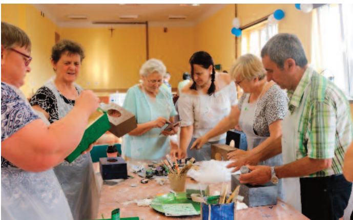
Warsztaty rękodzieła w ramach grantu z LGD