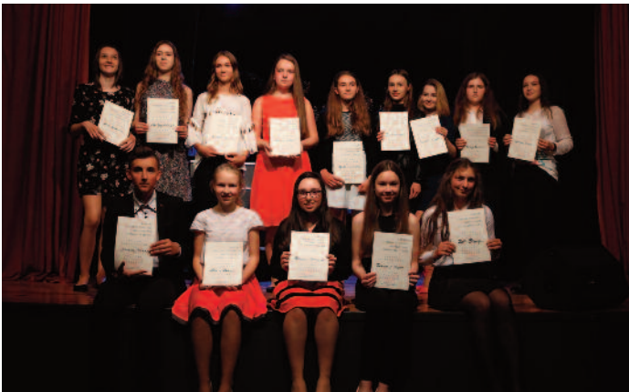
Śpiewający Słowik - uczestnicy kategorii I, II i III oraz IV