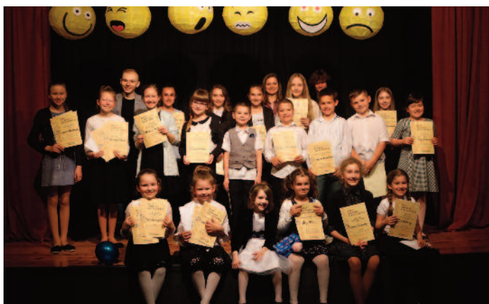
Mały Konkurs Recytatorski wiersze o uczuciach i z uczuciem, uczestnicy