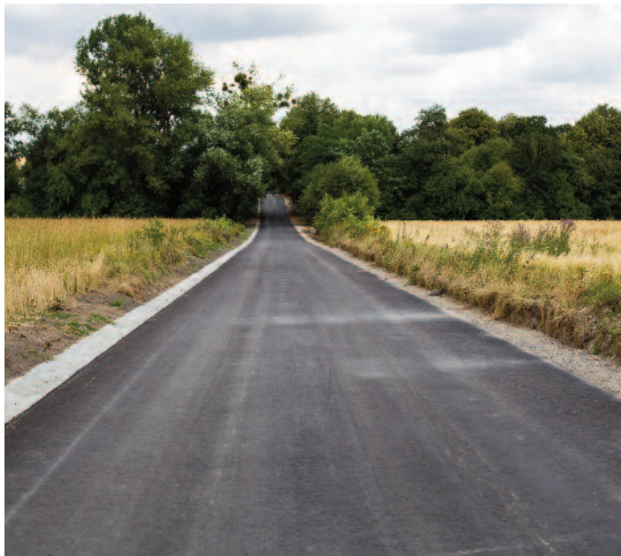
Budowa drogi w Piotrkowie-Kolonii

Jako Gmina jesteśmy na etapie rozstrzygania zapytań i przetargów na realizację kolejnych inwestycji, m.in. „Przebudowę kuchni i stołówki oraz korytarza wraz ze zmianą sposobu użytkowania pomieszczeń w części budynku w Zespole Szkół w