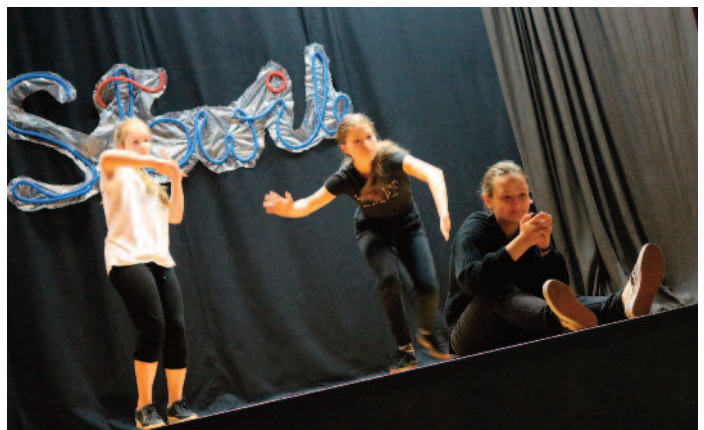
Teatralne zakończenie roku dla młodzieży