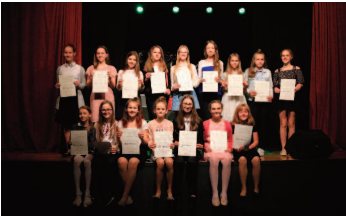
Śpiewający Słowik - uczestnicy kategorii I, II i III oraz IV