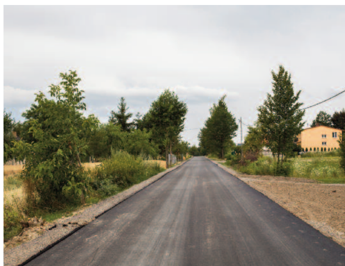
Budowa drogi w m. Jabłonna Pierwsza