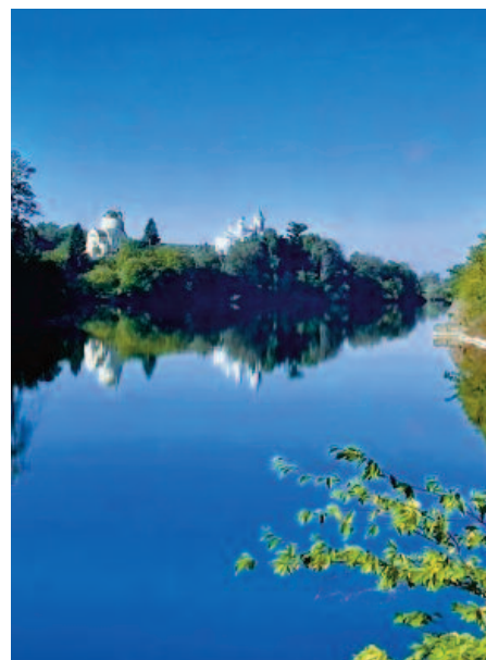
Rzeka Teteriw, w oddali monaster w Tryhirii