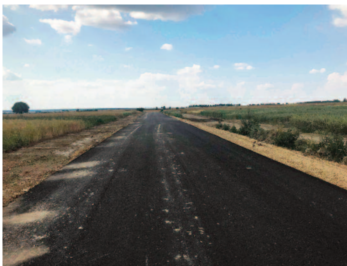
Budowa drogi Dominów-Skrzynice

W tym roku na terenie gminy realizujemy termomodernizację dwóch