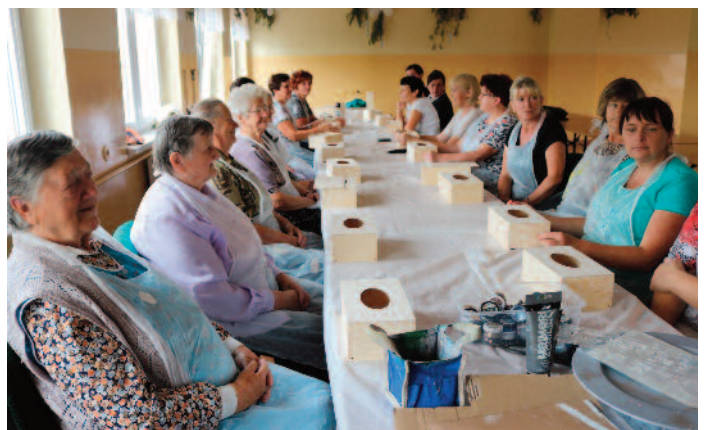
Warsztaty rękodzieła w ramach grantu z LGD