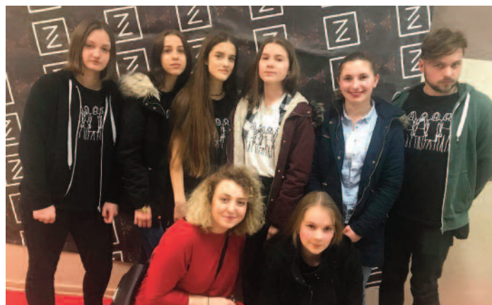
MGAP ze spektaklem na konkursie Zwierciadła