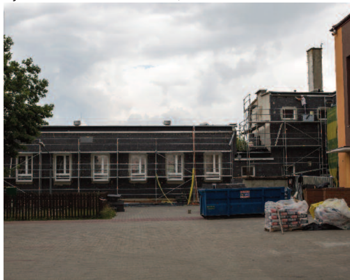
Termomodernizacja Zespołu Szkół w Jabłonnie