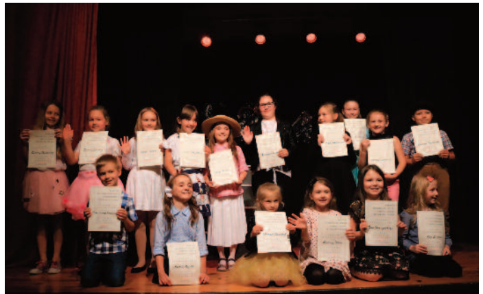
Śpiewający Słowik - uczestnicy kategorii I, II i III oraz IV