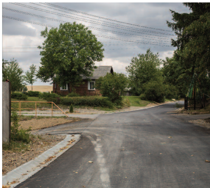
Budowa drogi w Piotrkowie-Kolonii

energii na terenie gminy Jabłonna - kolektory słoneczne i kotły na biomasę” firmą FlexiPower Group. Od 9 lipca br. rozpoczął się montaż instalacji solarnych i piecy na biomasę na terenie gminy, będzie on sukcesywnie realizowany w poszczególnych miejscowościach. W ramach projektu