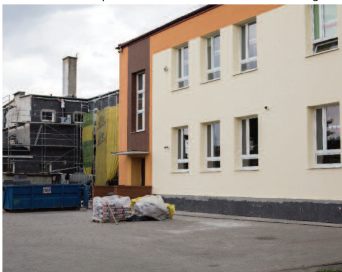
Termomodernizacja Zespołu Szkół w Jabłonnie

budynków Zespołu Szkół w Jabłonnie oraz Centrum Kultury Gminy Jabłonna w Piotrkowie Drugim. Na prace przy Zespole Szkół w Jabłonnie otrzymaliśmy pożyczkę (w części umarzalną) z Wojewódzkiego Funduszu Ochrony Środowiska i Gospodarki Wodnej w Lublinie. Łączna wartość zadania to 826.234,64 zł.