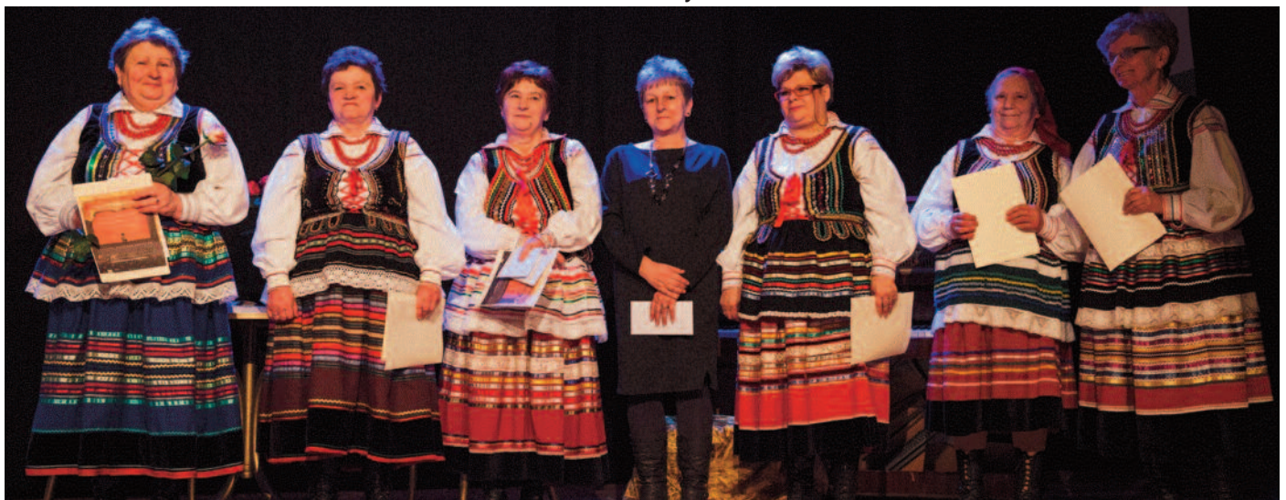
Przewodniczące KGW biorących udział w przeglądzie