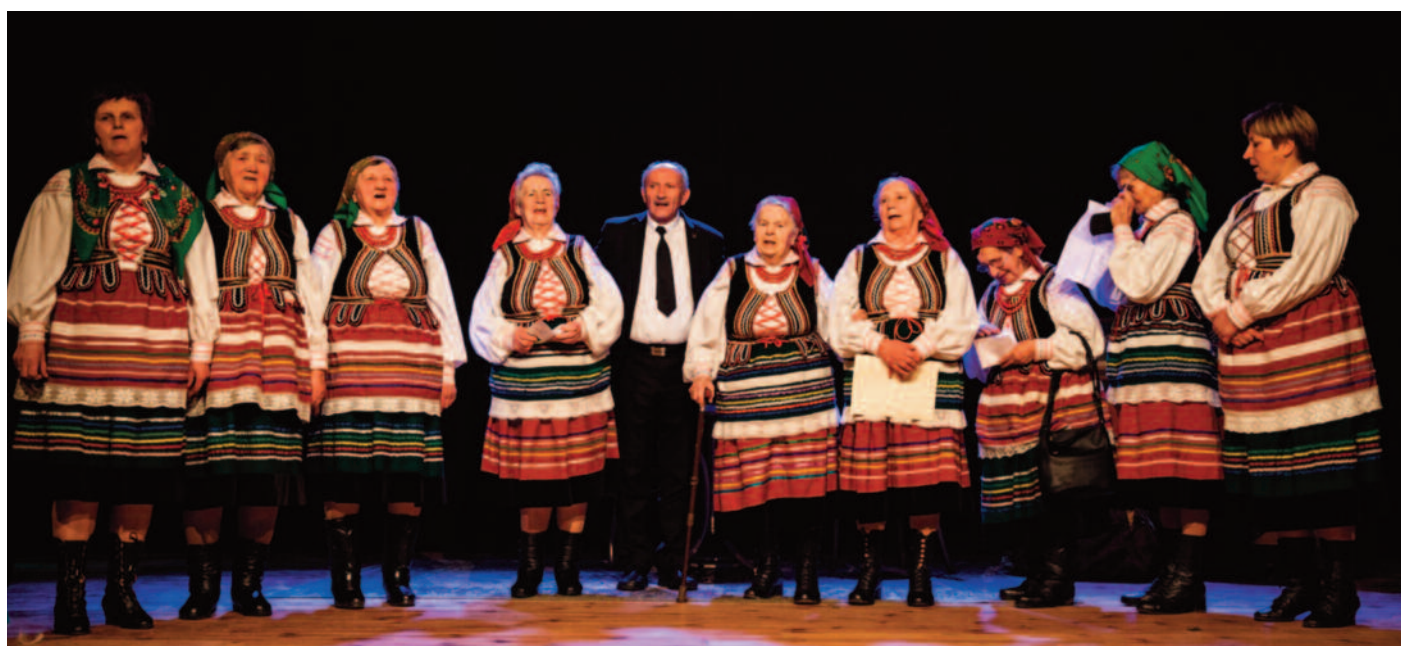
I miejsce w konkursie zdobył ZŚ KGW z Tuszowa