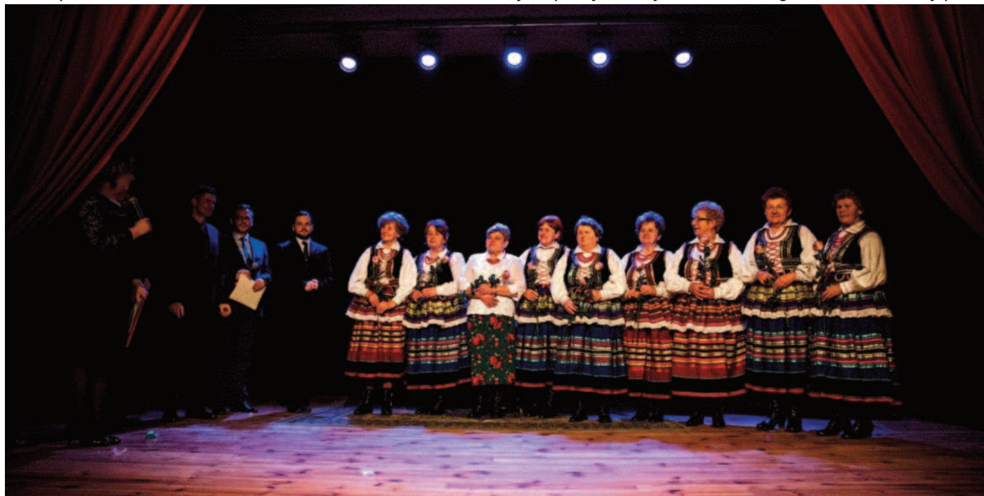
Ulubieniec publiczności ZŚ KGW z Jabłonna Drugiej

Motyw ten zobrazowany dzięki scenografii Przeglądu – tym razem spotkaliśmy się nie przy symbolach określających wieś, a w symbolice sali operowej, profesjonalnie wyciemnionej sceny z kurtynami i światłami scenicznymi (nowym nabytkiem Gminnego Centrum Kultury!).