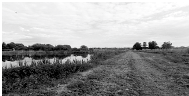
Grobla wśród stawów na Łanach, prowadząca do dawnego dworu obronnego