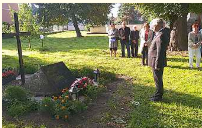
82. rocznica bombardowania Markuszowa