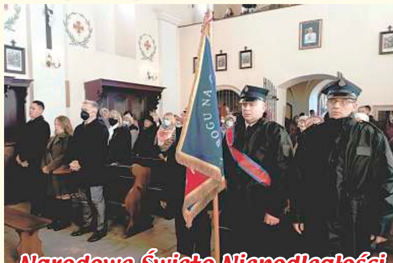
Narodowe Święto Niepodległości