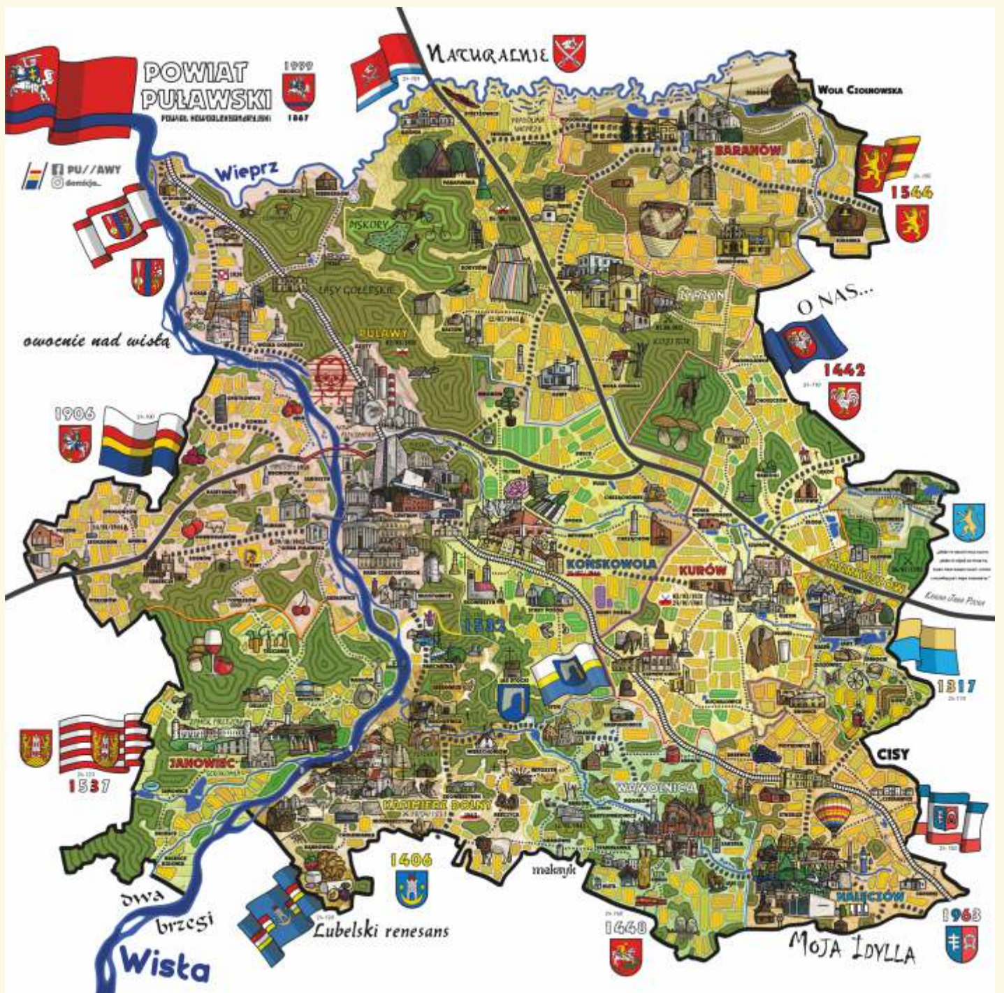
Autor mapy Dominicjan Grabowski