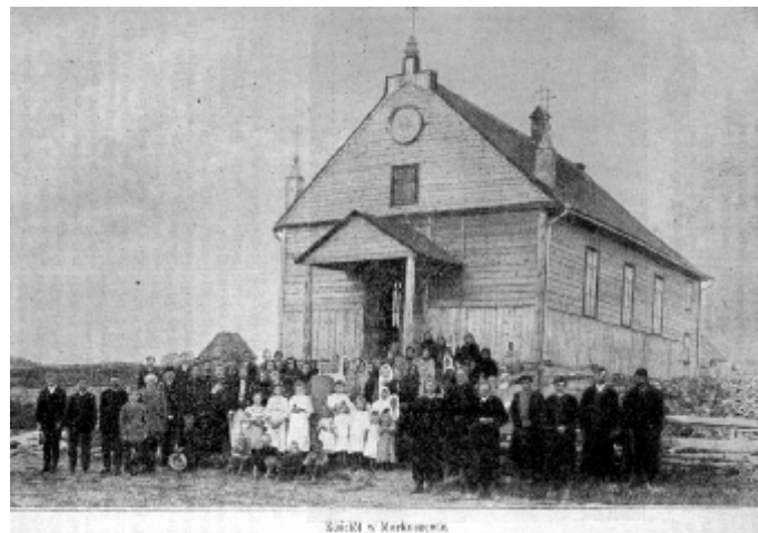
1908 r.